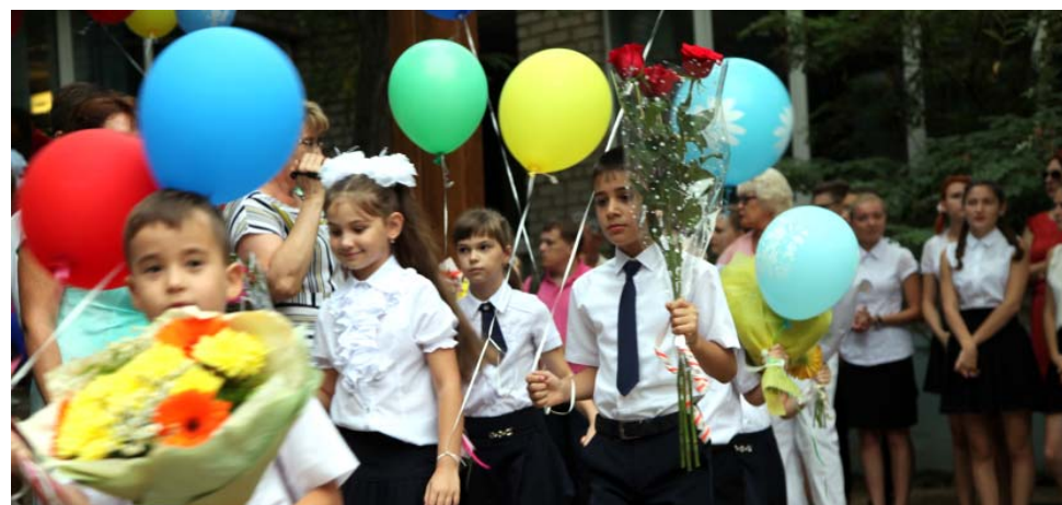
СОШ № 18