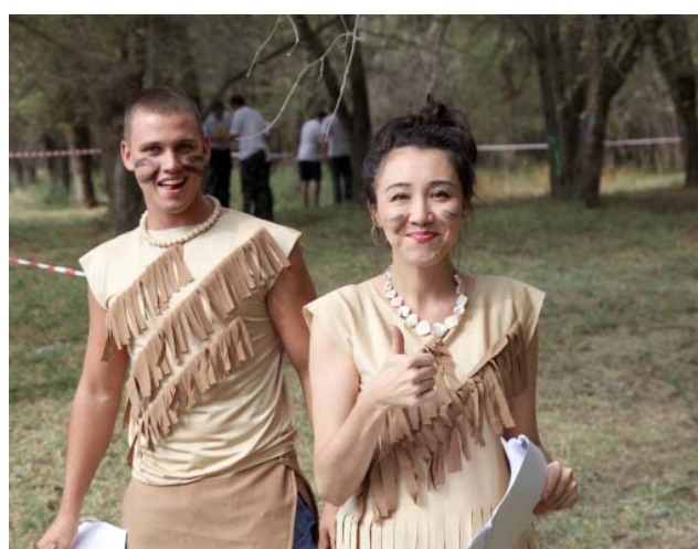
Главные герои конкурса «Робинзоида»