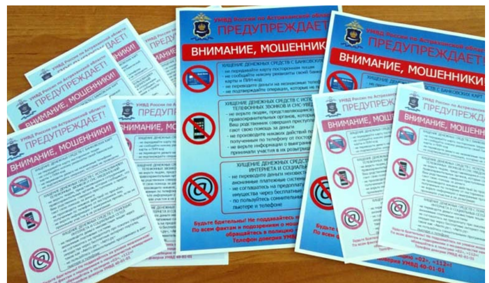
Управление МВД России по Астраханской области обращается к жителям региона с просьбой не поддаваться на уловки мошенников. Будьте внимательны!

Молодая женщина, собравшись отдохнуть с семьёй в условиях более щадящего, по сравнению с астраханским, крымского тепла, увидела объявление о сдаче в аренду жилья в одном из пригородных посёлков. Согласно догово-