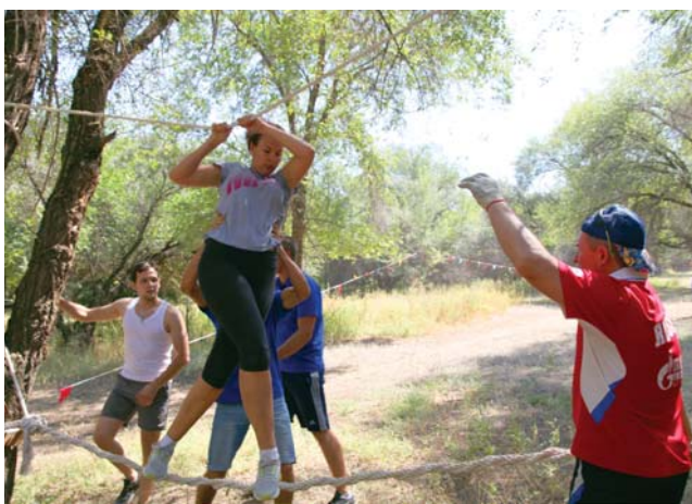
Команда УКЗ ООО «Газпром добыча Астрахань» – на этапах эстафеты