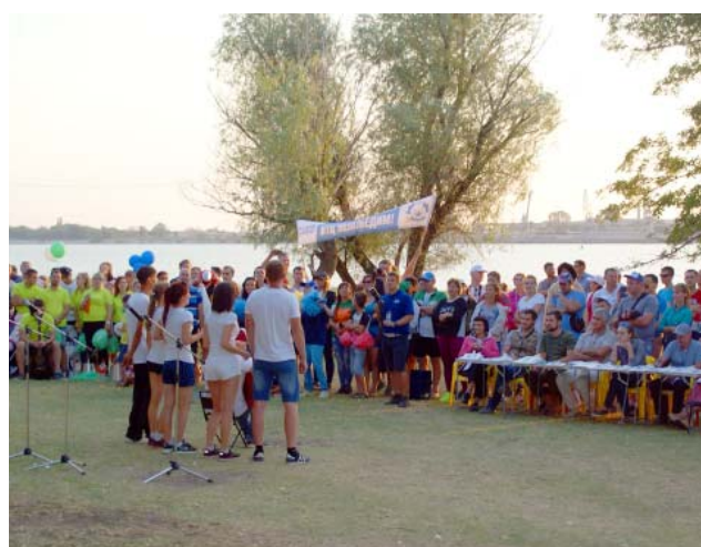
Конкурс «Туристическая песня» завершил первый день турслёта