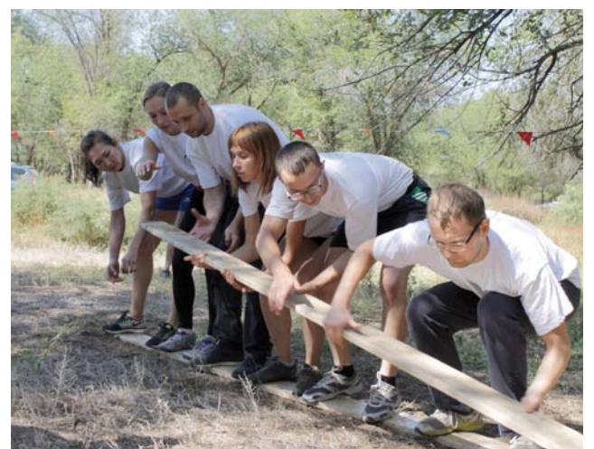
Задания эстафеты очень непростые