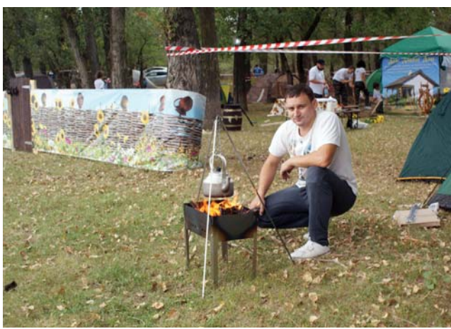
Нет лучше чая, чем чай с «дымком»