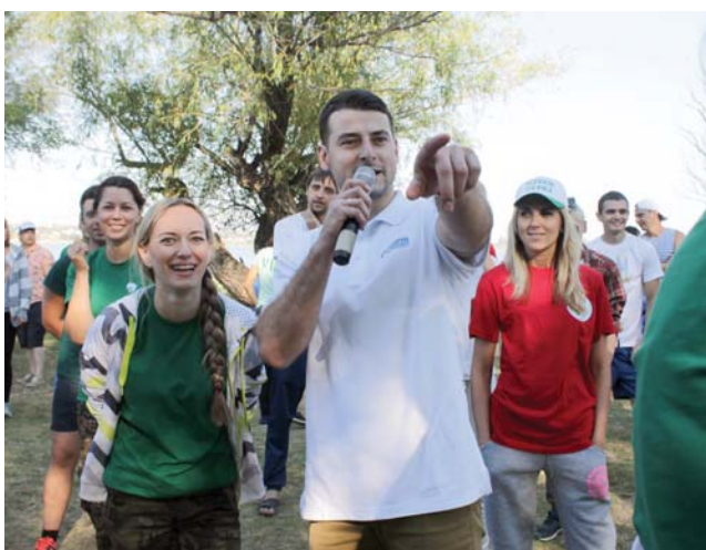
Зарядка проходила под весёлым руководством