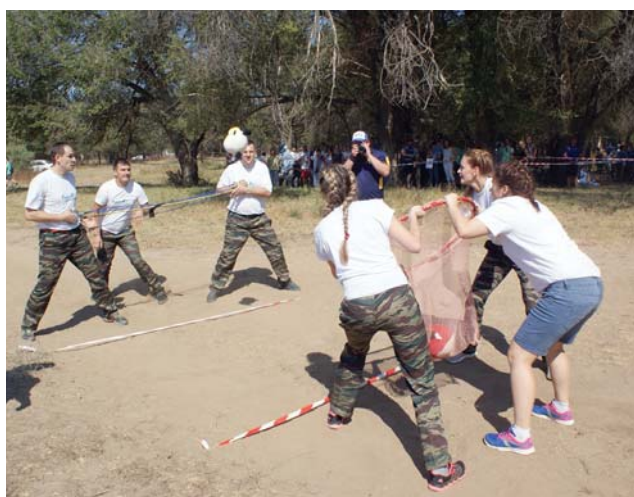
Только слаженная команда преодолит задания эстафеты