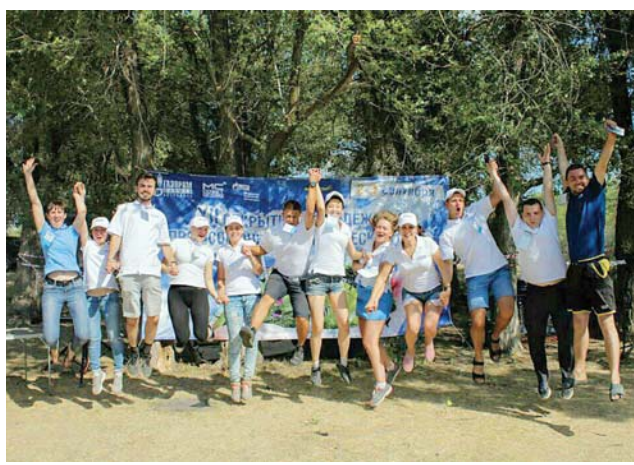
Организаторы мероприятия СМС ООО «Газпром добыча Астрахань»