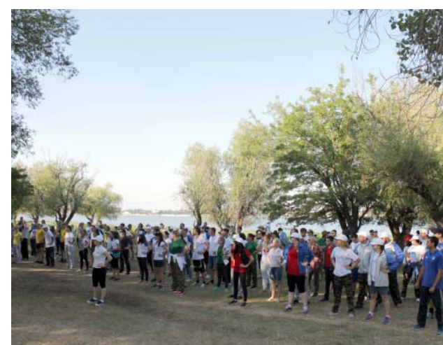
Утро второго дня началось с зарядки