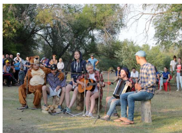
Команда ВЧ ООО «Газпром добыча Астрахань» открывает конкурс «Туристическая песня»