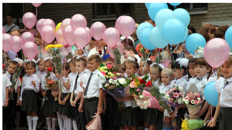
Гимназия № 2

– Газпром многое делает для того, чтобы жизнь астраханцев стала более праздничной и достойной. Это строительство набережных, спортивных площадок, мест проведения досуга, – отметил Анатолий Васильевич. – Хочу обратиться к ребятам, для которых этот школьный год – последний. Перед вами открываются большие просторы. Многие пожелают работать в нашей компании, самой эффективной компании страны. Но для этого вам