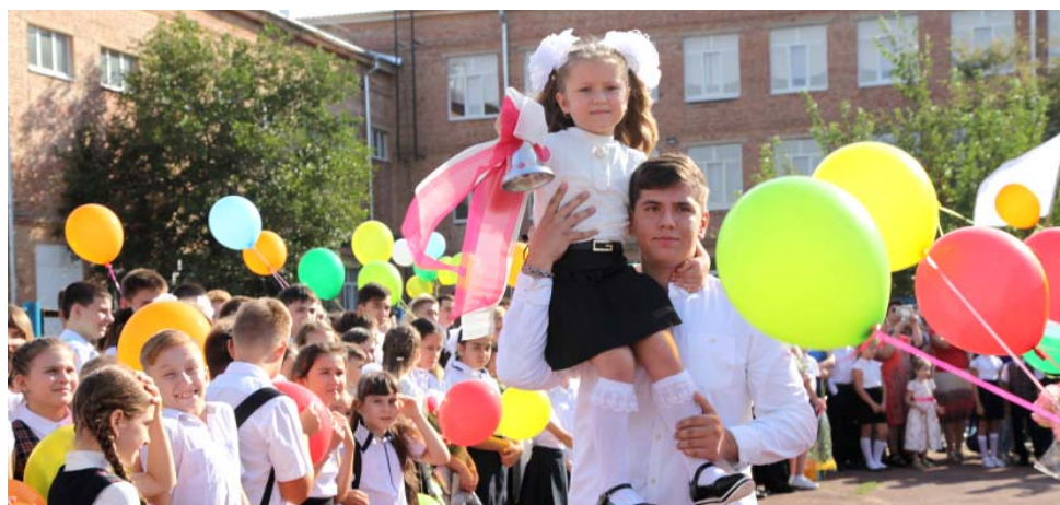
СОШ № 14

Поздравляя детей, их родителей и учителей с Днём знаний, шефы желали им крепкого здоровья, удачи, оптимизма и стремления к новым знаниям. По окончании линеек ребята, впервые вошедшие в учебные классы, с интересом изучали содержимое «Наборов первоклассника», которые призваны помочь им познавать этот мир и получать необходимые знания.