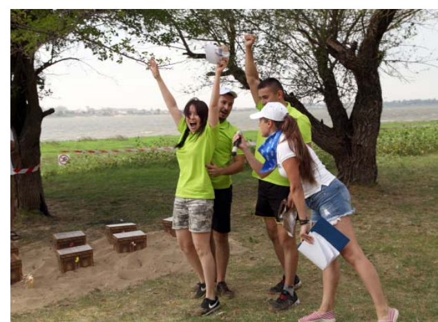
Команда ГПУ ООО «Газпром добыча Астрахань» – победители конкурса «Робинзоида»