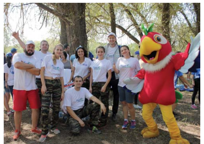
А куда же без любимых мультяшек?