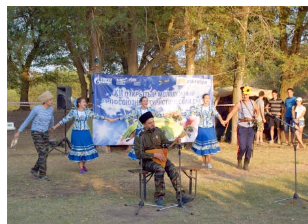
Выступление команды ООО «Газпром трансгаз Волгоград» добавило национального колорита