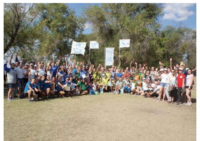
Участники турслёта: награды вручены, но победила дружба