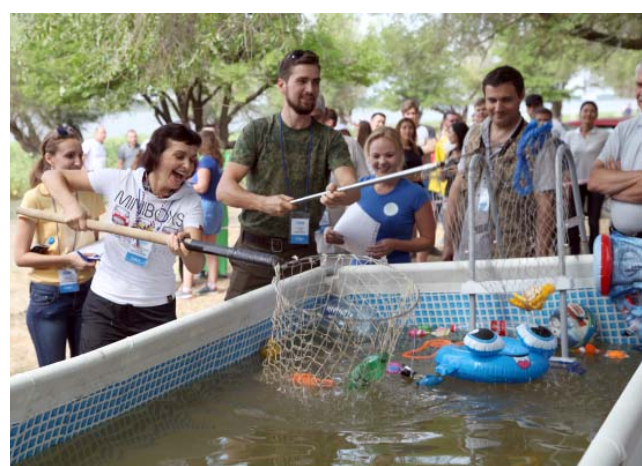
Команда УС ООО «Газпром добыча Астрахань» удивила судей оригинальностью