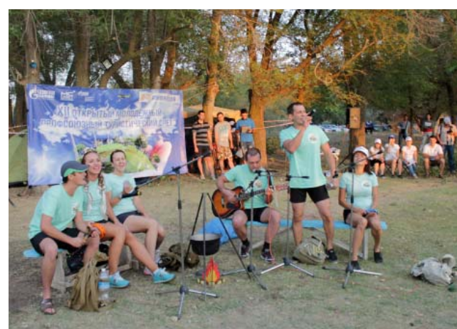
Команда УКС ООО «Газпром добыча Астрахань» – в стремлении к победе