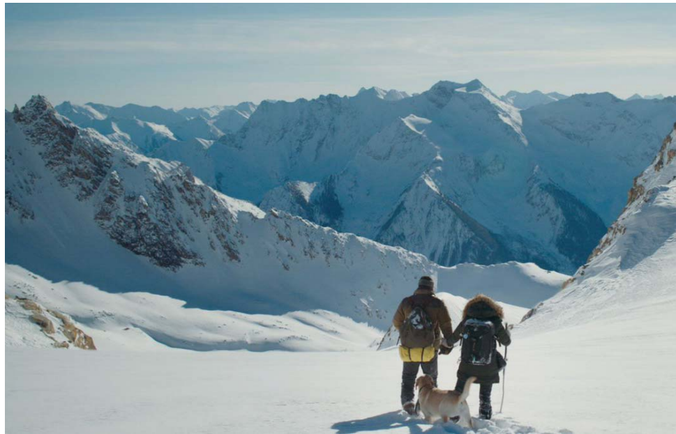
«Между нами горы»

Сентябрь означает для большинства астраханцев две вещи: начало учебного года и начало осени. Для кого-то – и завершение периода летних отпусков. Но есть у поры «очей очарования» ещё один несомненный плюс: к этому времени года мировой кинематограф по традиции готовит громкие премьеры. «Пульс Аксарайска» ознакомился с ними и готов рассказать нашим читателям.