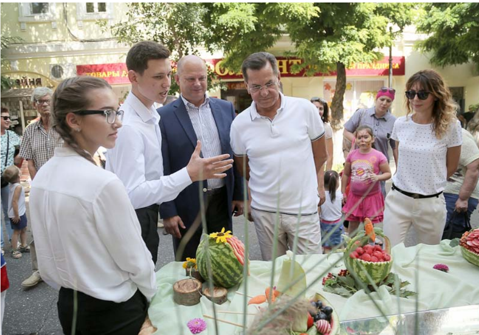
Во время празднования Дня города и Дня работников нефтяной и газовой промышленности

мого сентября, в Володарском районе при участии зампреда правительства РФ Аркадия Дворковича состоялось открытие первой в регионе солнечной электростанции мощностью 15 МВт. Компания, которая её построила – «Солар Системс» – планирует ещё строительство подобных объектов как в нашем, так и в некоторых других регионах страны. И как только все станции запустим, то в год они будут платить в регион миллиард рублей налогов.