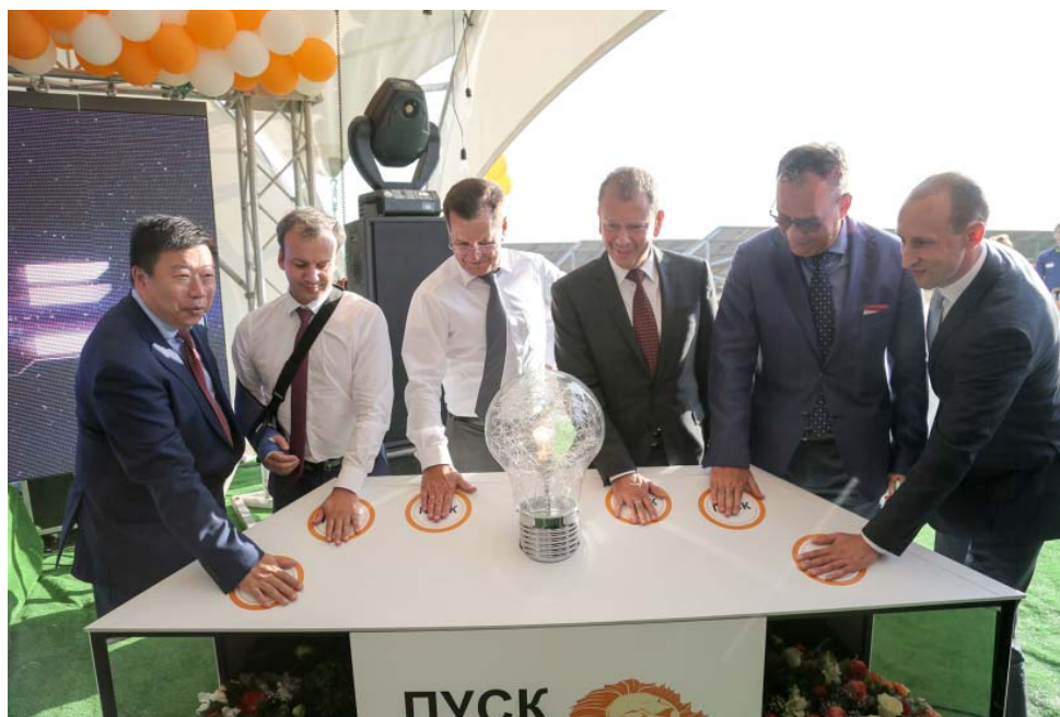
Запуск солнечной электростанции «Заводская»