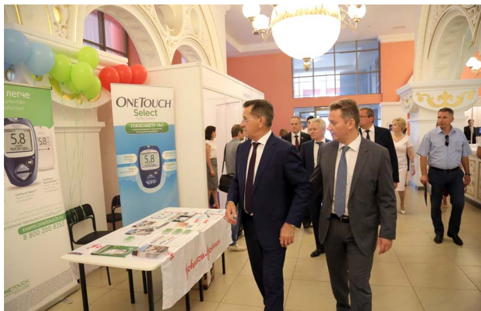
Научно-практическая конференция «Достижения профилактической медицины как основа сохранения национального здоровья и благополучия общества»