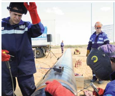
АО «ГАЗПРОМ ГАЗОРАСПРЕДЕЛЕНИЕ АСТРАХАНЬ» – 50 ЛЕТ стр. 5

СОХРАНИ НЕБО: МЕЖДУНАРОДНЫЙ ДЕНЬ ЗАЩИТЫ ОЗОНОВОГО СЛОЯ стр. 6–7