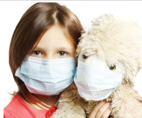
ГРИПП: ПРОГНОЗЫ, ВАКЦИНАЦИЯ, СОВЕТЫ стр. 10

«СЕЛИАС-2017»: ТАЛАНТЛИВАЯ МОЛОДЕЖЬ СОБРАЛАСЬ НА ФОРУМ В ОЦ ИМ. А.С. ПУШКИНА стр. 12