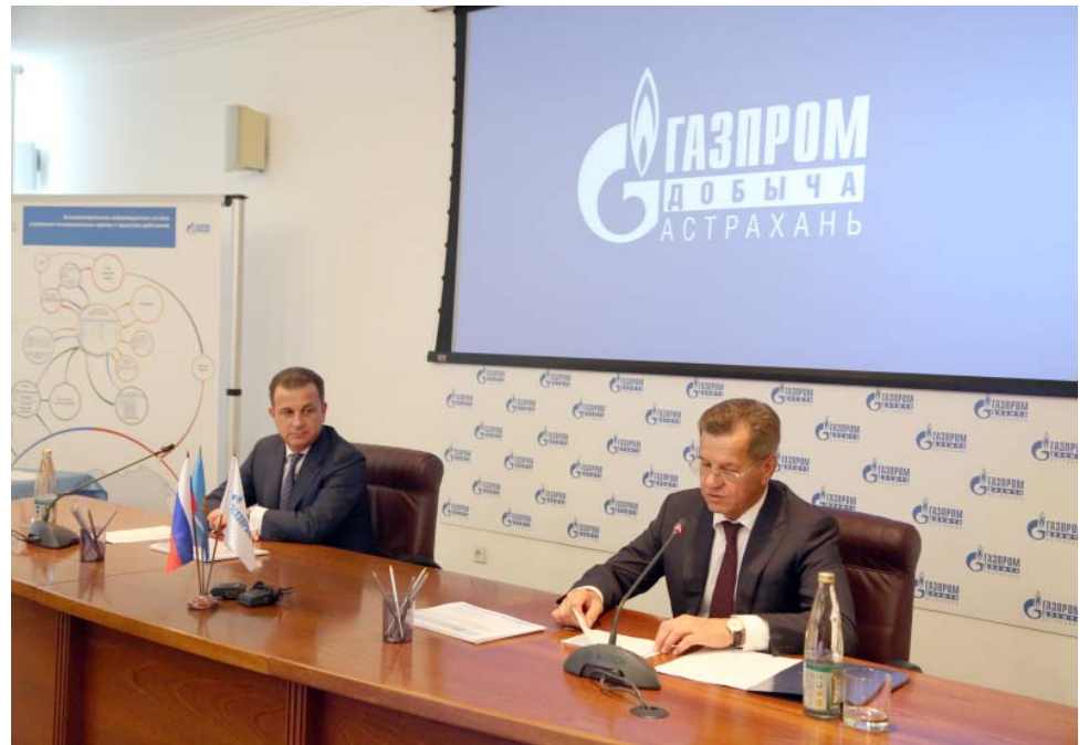
Инженерный научно-промышленный совет при губернаторе Астраханской области

можными способами восполнить утраченные объёмы по тем или иным видам обитателей наших территорий: выращиваем и выпускаем в живую природу рыб, в том числе осетровых видов, а также уток, фазанов, кабанов, сайгаков.