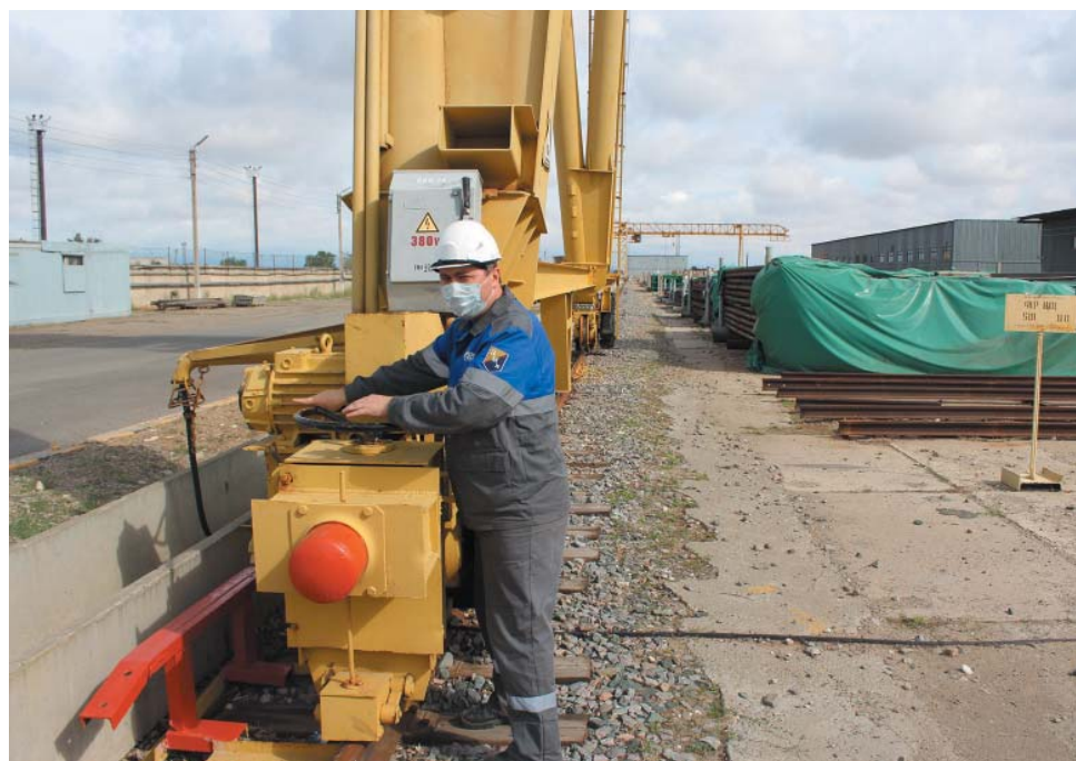
Подготовка козловых кранов к работе на базе УМТСиК