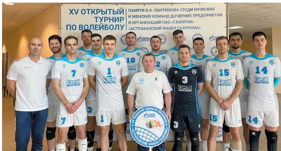
Победители в мужской сетке турнира команда ООО СУМУО ПАО «Газпром»

счётом 3:2 и 3:0 соответственно и взяли бронзу. На первом месте в женской сетке – ООО «Газпром межрегионгаз», на втором – спортсменки из Ухты.