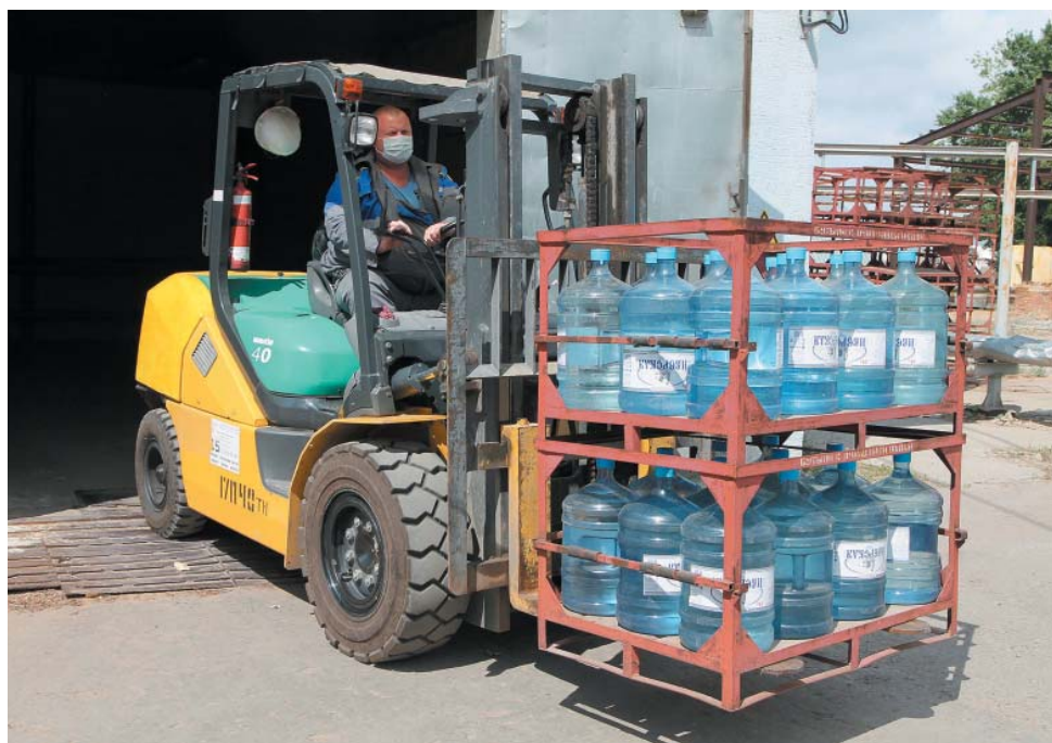
Отгрузка бутилированной питьевой воды

– В результате разграничения функций в УМТСиК был создан отдел комплектации (сейчас это Участок № 3 по обеспечению