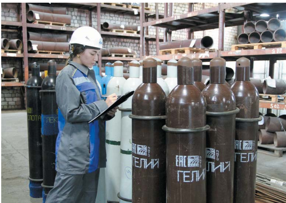
Входной контроль баллонов для чистых газов на базе УМТСиК