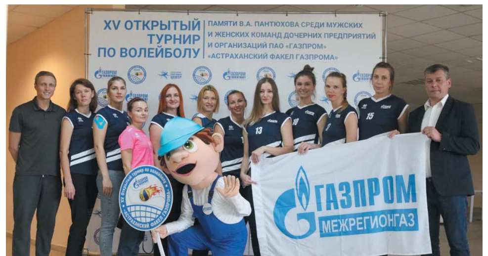
Победители в женской сетке турнира команда ООО «Газпром Межрегионгаз»

Торжественное закрытие турнира проходило в Оздоровительном центре имени А.С. Пушкина. Победители и призёры соревнования получили дипломы и медали,