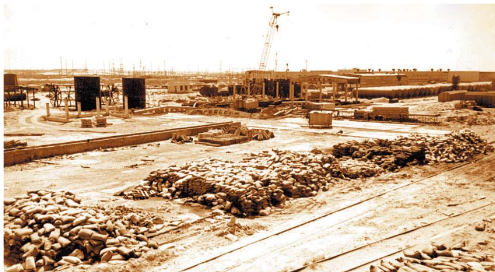
Строительство базы УПТОиК, 1983 г.

Одновременно с ООО «Газпром добыча Астрахань» отмечает свой день рождения Управление материально-технического обслуживания и комплектации (УМТСиК). Одним приказом Министерства газовой промышленности СССР было создано производственное объединение по добыче и переработке газа в Астраханской области «Астраханьгазпром», а в его составе – Управление производственно-технического обслуживания и комплектации (УПТОиК). Ведь «снабжение, как говорил советский исследователь Арктики И. Папанин, – не второстепенное дело. Иначе можно провалить самое ценное начинание».