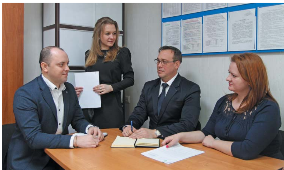
Обсуждение заявочной кампании в отделе снабжения химическими и прочими материалами

риод распространения новой коронавирусной инфекции без перебоев обеспечивал Общество МТР в соответствии с заявками и одновременно участвовал в закупке материалов и оборудования, необходимых для борьбы и профилактики Covid-19, в целях сохранения здоровья сотрудников нашего предприятия, недопущения распространения заболевания.