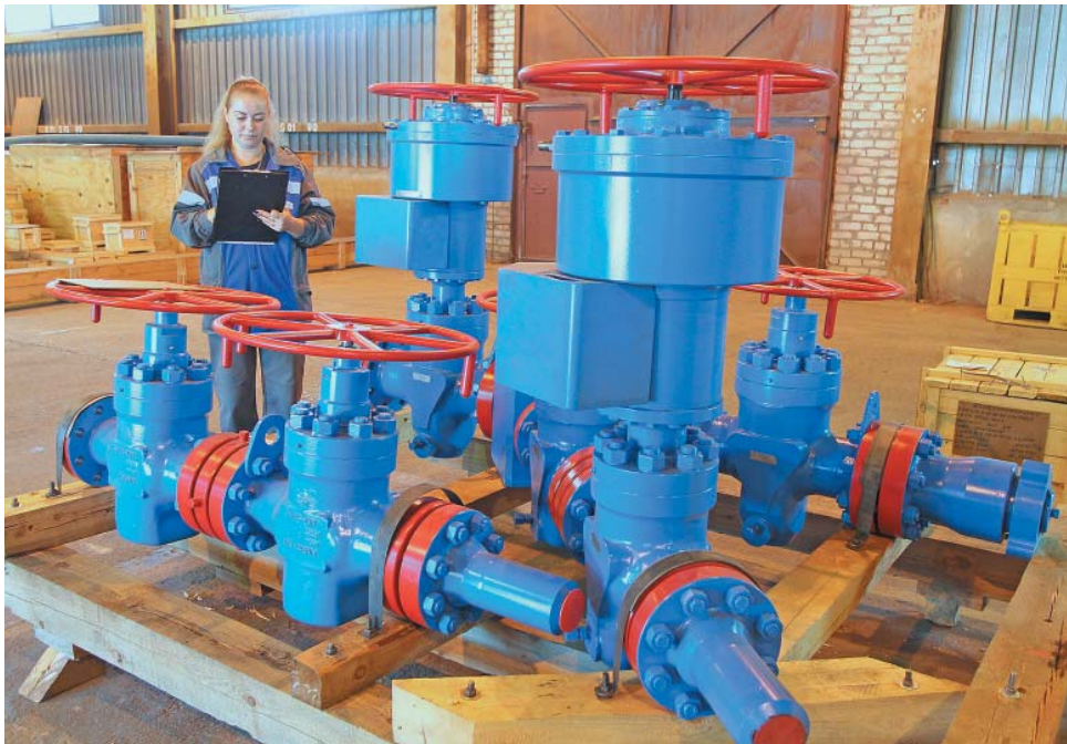
Учёт оборудования на базе УМТСиК

нию приёма, хранения и реализации МТР (Базы Управления), что позволило повысить оперативность и качество обслуживания структурных подразделений Общества при выдаче МТР. Была организована работа по представлению своевременной и корректной информации об остатках МТР в разрезе структурных подразделений; по заявкам подразделений производится планирование отгрузок, предварительное комплектование отгрузочных партий и создание проектов накладных на отпуск МТР. Упрощена процедура и минимизировано время оформления накладных и получения МТР, которое в среднем составляет от 15 минут до 2 часов (в зависимости от номенклатуры и необходимости использования специальной техники при отгрузке МТР). Это позволило снизить затраты на использование автотранспорта.