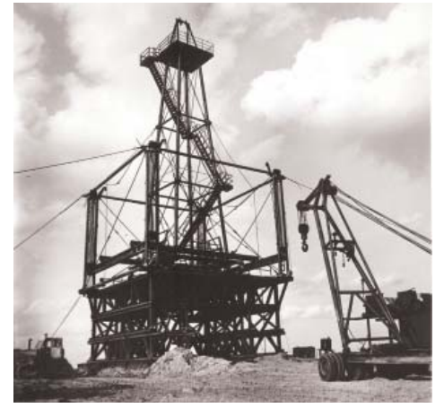
Монтаж буровой вышки

Не будем забывать и о том, что глубина эксплуатационных скважин на АГКМ также тянула на своеобразный рекорд, однако бурились на месторождении и более глубокие скважины. Начиная с 1997 года, организовано активное параметрическое бурение на девонский комплекс отложений в левобережной и правобережной частях Астраханского свода. Параметрическая скважина 1-Правобережная была заложена на западном погружении подсолевых отложений Астраханского свода с целью выяснения основных закономерностей геологического строения и пер-