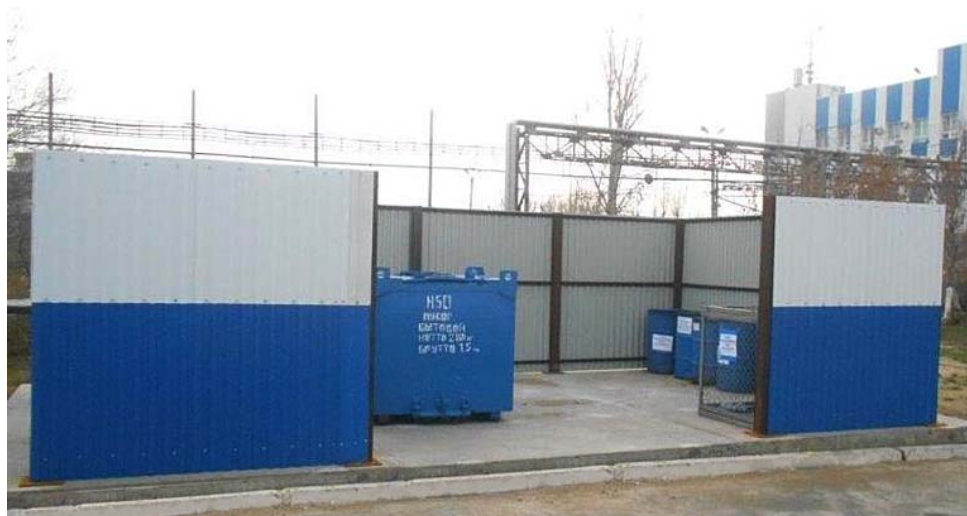
Площадка цеха ТСиМЦК для сбора отходов

Ещё одна значимая намеченная цель – оптимизация управления отходами. В августе по заводу были получены новые нормативы образования отходов и лимиты на их размещение сроком действия на пять лет. АГПЗ планомерно продолжает осуществлять работы по снижению объёмов образования отходов – в частности, посредством вовлечения материалов, включённых в отходы, в хозяйственный оборот в качестве вторичных ресурсов. Так, например, в ходе аккумуляции, усреднения в резервуарах КНС-1 производственных сточных вод, поступающих с производства № 3, а также в ходе очистки производственно-дождевых сточных вод на МОС-1 образуются углеводороды – обводнённый нефтепродукт, который (в соответствии с технологической схемой) собирается в ёмкости Е-01 КНС-1. В ёмкости Е-01 обводнённый нефтепродукт отстаивается до соответствующих характеристик, и когда содержа-