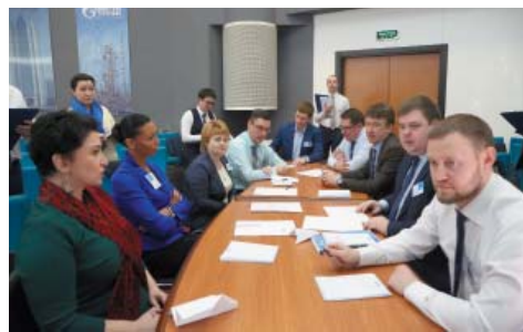
АСТРАХАНЬ СТАЛА ПЛОЩАДКОЙ ПО ОБУЧЕНИЮ И ОБМЕНУ ОПЫТОМ Третий модуль программы обучения МВА Газпром прошёл в Астрахани стр. 3