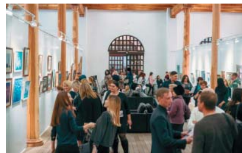
ЖЕНСКИЙ ВЗГЛЯД НА КРАСОТУ-2018 В Цейхгаузе открылась традиционная выставка астраханских художниц под названием «Женский взгляд на красоту» стр. 7