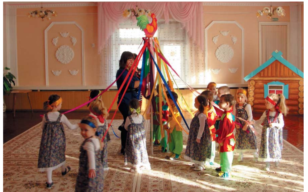
Масленица в детском саду № 121 «Катенька».

В детском саду № 136 «Остров сказок» хозяйка Русской избы – тётюшка Арина – накануне масленичной недели разослала детям приглашения. И каждый день в назначенный час в избу на праздник приходили дети из разных групп. Вместе с тётюшкой Ариной они постигали традиции и обычаи русского народа, хороводили, веселились, мерялись силой в играх. К детям подготовительной группы приходил иерей Димитрий, который сыграл на балалайке и рассказал о Масленице. Дети с удовольствием поиграли в народные игры, спели под балалайку и полакомились блинами. Не забыл коллектив дет-