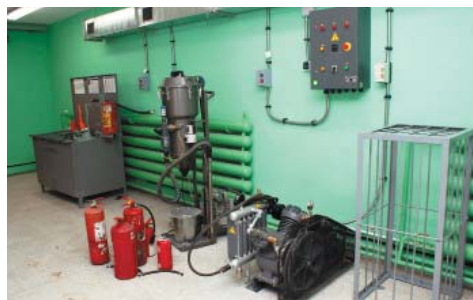
УЧАСТОК ПОЖАРНОЙ БЕЗОПАСНОСТИ В ООО «Газпром добыча Астрахань» начал работать участок по техническому обслуживанию огнетушителей стр. 2