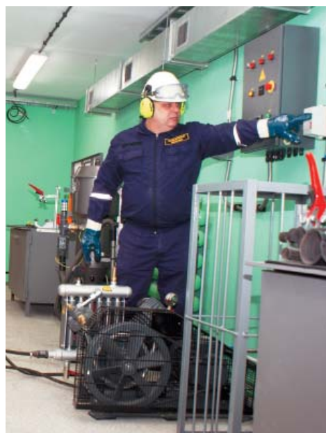
На участке по техническому обслуживанию, ремонту, зарядке и испытанию огнетушителей работа специалистов по зарядке порошкового огнетушителя занимает около 30 минут, углекислотного – 20 минут

Участок состоит из двух цехов: по ремонту и зарядке огнетушителей и проведению гидроиспытаний, а также склада хранения, выдачи огнетушителей и административного помещения. Цех ремонта и зарядки огнетушителей оборудован станциями для заправки порошковых и углекислотных огнетушителей, компрессорами, измерительными приборами и прочим оборудованием и инструментами. В цехе проведения гидроиспытаний также стоит необходимая аппаратура, смонтиро-