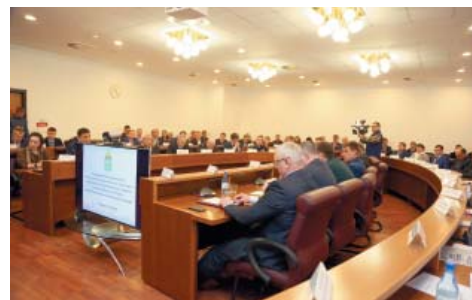
ОБ ИТОГАХ И ПЕРСПЕКТИВАХ В АЦГ состоялось расширенное заседание коллегии министерства промышленности, транспорта и природных ресурсов стр. 4