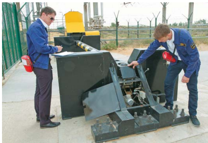
Обслуживание противотаранного устройства

ПОДБОР ПЕРСОНАЛА – СЕРЬЁЗНАЯ ЗАДАЧА Бесперебойная эксплуатация комплексов ИТСО на объектах ООО «Газпром добыча Астрахань» обеспечивается системным подходом по организации технической экс-