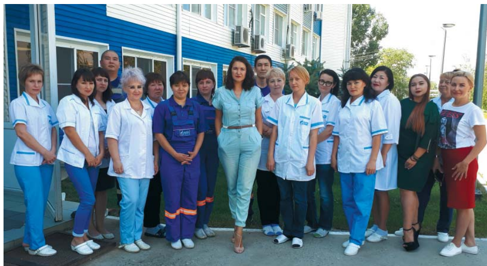
Коллектив административно-хозяйственного отдела ГПУ

– Я курирую направление «столовое оборудование и бытовое». В 2016 году из