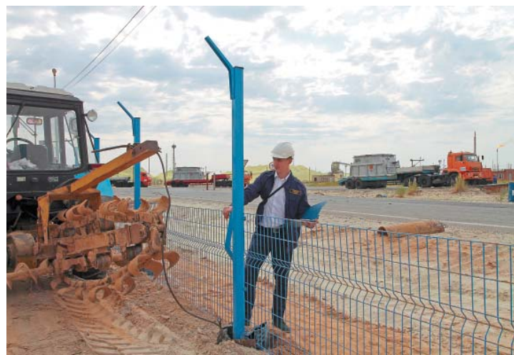
Контроль строительства охраняемого периметра

Сегодня уже нельзя представить эффективную работу охраны без ИТСО. Инспекторы по защите имущества имеют на своих рабочих местах полный комплекс инженерных средств – системы видеонаблюдения, различные варианты охранной сигнализации, СКУД. И в дальнейшем значение данных комплексов в обеспечении безопасности предприятия будет только расти.