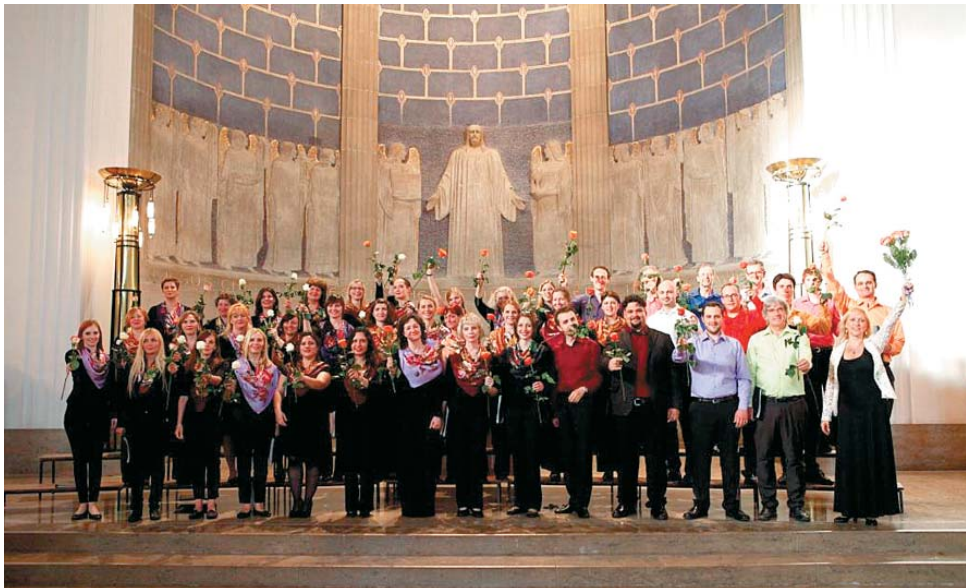
Русский хор из Цюриха «Белые ночи»

Под занавес лета Астрахань ждёт несколько ярких событий под открытым небом и не только. Читайте нашу афишу и планируйте, как провести незабываемый август.