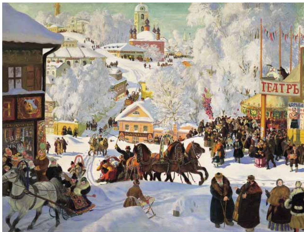
Б. Кустодиев «Масленица»

Любимая многими поколениями россиянина шапка-ушанка, по мнению некоторых исследователей, пришла к нам из Монголии. Малахай монголов представлял собой колпак в виде конуса, скроенного из овчины, и его широкие отвороты защищали лица и щёки ордынских воинов от ветра и ме-