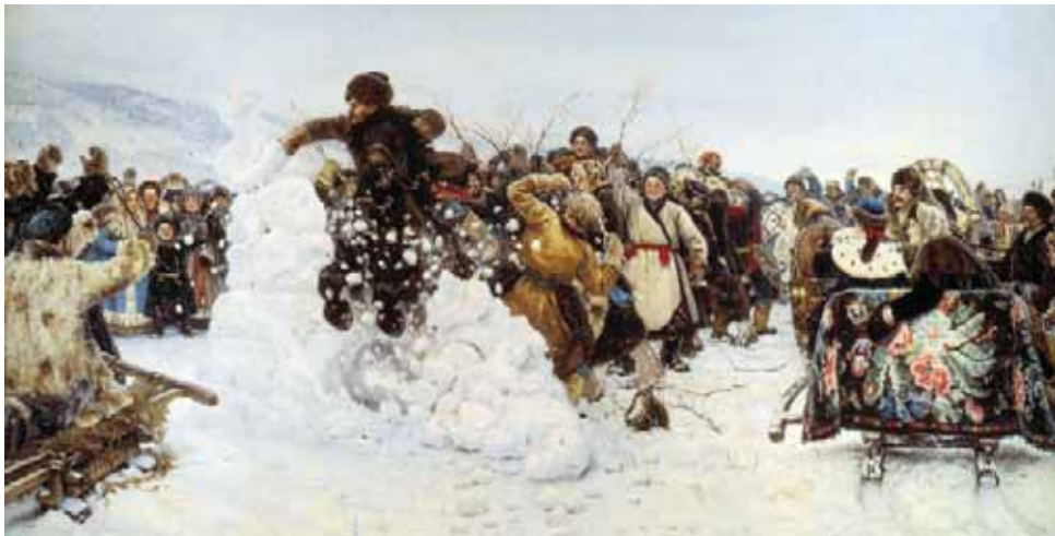
В. Суриков «Взятие снежного городка»

Ну вот и вступил в свои права 2014, объявленный в России Годом культуры. Публикации корпоративного Музея в этом знаменательном году мы посвятим всему многообразию отечественной культуры. А начнём с такой важной стороны нашей жизни, как гардероб. Тем более что русская зима снабдила нас на многие годы неповторимыми аксессуарами и костюмами.