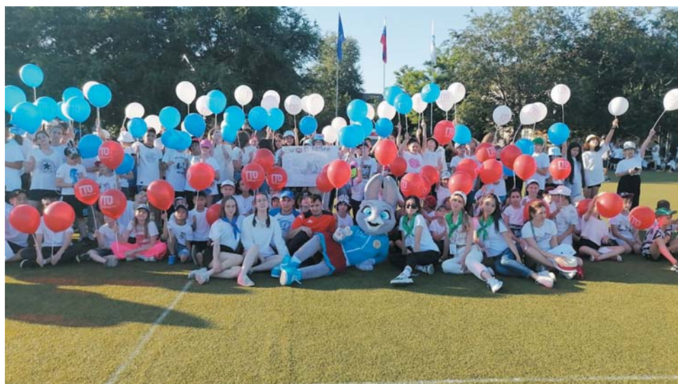
Общее фото с зайкой Лизой – талисманом фестиваля «Готов к труду и обороне»

Под зажигательную музыку в сопровождении организаторов мероприятия – представителей министерства физической культуры и спорта АО – большинство из ребят