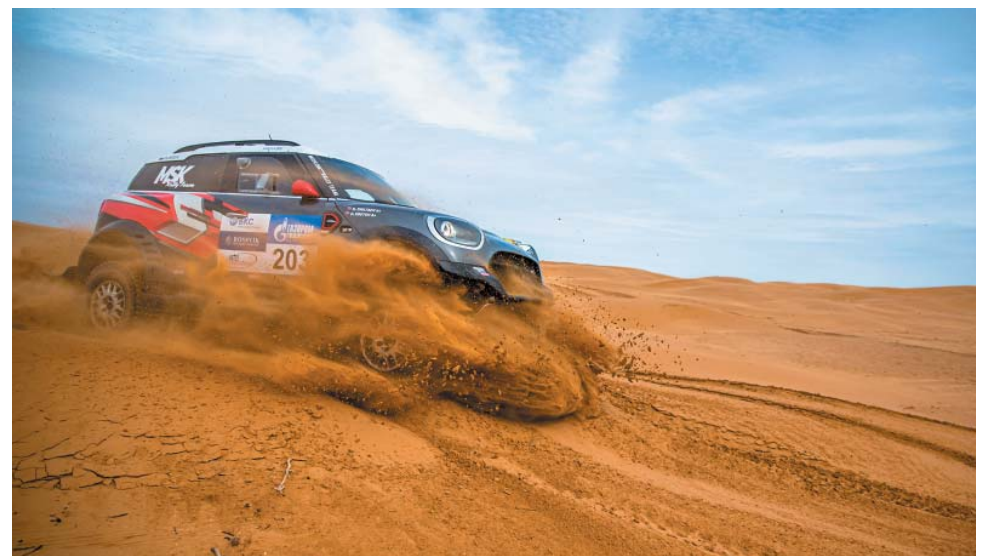
На гонке грузовики, внедорожники и багги находятся в одинаковых условиях