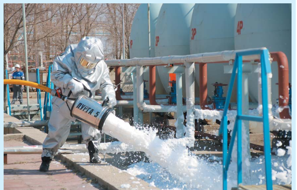
Учения на объекте промысла, март 2022 года

– Начало строительства Автоматизированной локальной системы оповещения Общества.