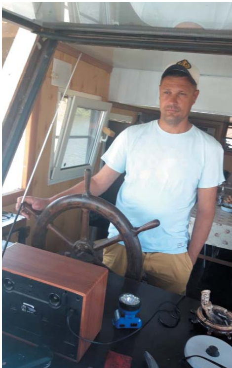
Не накормит земля – накормит вода

– В основном рыбачу на Белинском банке. Ещё, бывает, на Гандуринском. У меня лодка с мотором, куластики. Друзья живут в Володарском районе, они подсказывают, где сейчас рыба клюёт, куда ехать, куда – не надо.