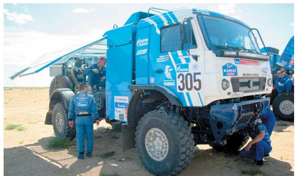
После каждого финиша производится тщательный осмотр техники