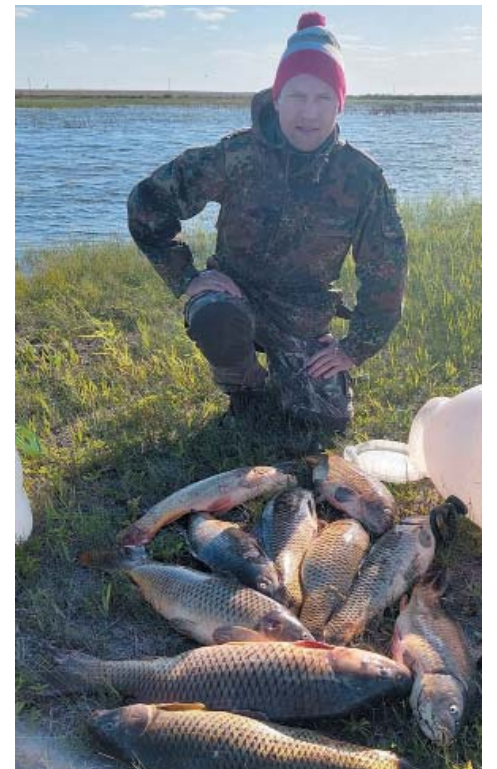
Клевало вчера – будет клевать и завтра

– Поехали мы с братом на рыбалку с ночёвкой по весне, ловили сазана на жмых, клёв был результативным, вечером поставили палатку и улеглись спать. Ночь оказалась холодной, и пришлось перебраться в машину, которую периодически прогревали. Наутро смотрю в окно и говорю брату: «Смотри, чья-то палатка проплывает». Вышли из машины, и ока-