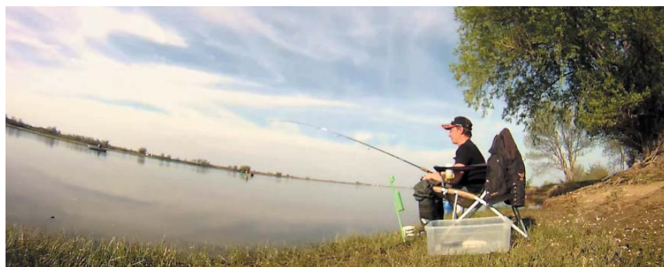
Не учи астраханца рыбу ловить

– Самое главное в рыбалке – верить в свои снасти, верить в успех. Если человек берёт удочку и не верит в себя, ничего не получится. Даже если у него будет золотая блесна, удача к нему лицом не повернётся. Позитивный настрой очень важен, как и удовольствие от самого процесса.