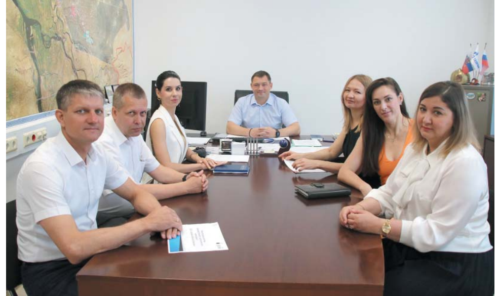
Совещание с участием работников специального отдела

– Основное направление работы, которую я веду, – воинский учёт и бронирование граждан, пребывающих в запасе ВС РФ. Считаю, что это очень важное направление в рамках всей деятельности нашего