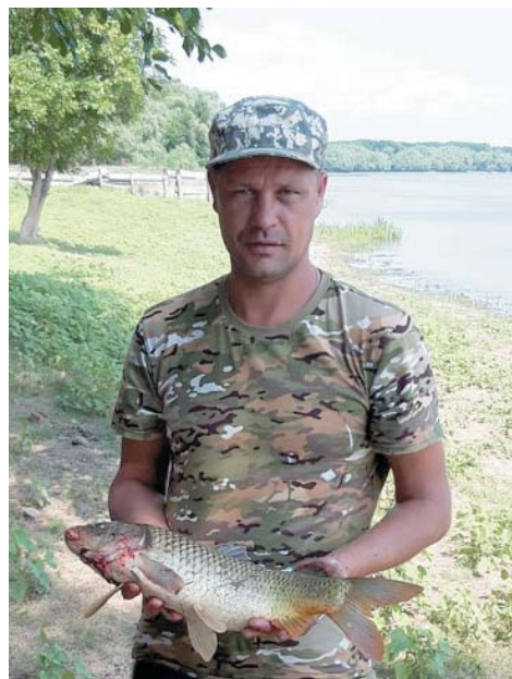
Всякая рыба хороша, коли удочку нашла

– Приходилось ли рыбачить в других регионах?