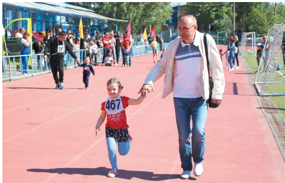
На корпоративном мероприятии

Важное значение в связи с понятием «любовь» приобретают понятия «семья» и «брак»: «Без мужа жена – всегда сирота», «Без жены как без шапки». Казахи думали аналогично: «Дом без женщины – сирота», а татары советовали: «Займи да женись, долг отдашь – жена останется».