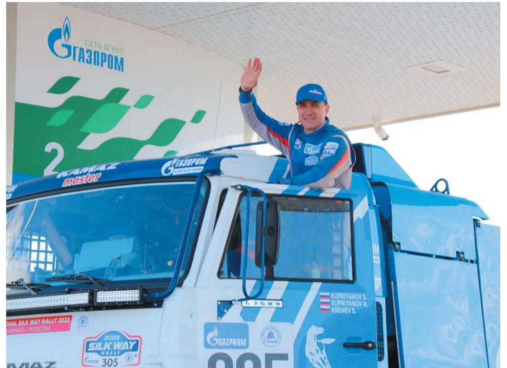
Газодизельный КАМАЗ заправлен – можно выходить на старт

Сегодня участники соревнования проходят экватор гонки, а уже завтра станут известны имена победителей и призёров бахи «Золото Кагана – 2022». Церемония награждения пройдёт на территории спортивно-зрелищного комплекса «Звёздный». Участие в астраханской гонке принимают автоспортсмены из России, Беларуси, Казахстана и Туркменистана. Кроме того, в рамках соревнования проходят международное соревнование по кросс-кантри ралли МФР (мото, ATV, SSV), исторический зачёт «Легенда» и гранд-тур «Дорогами Петра». Гоночная трасса проложена по степям и пескам Наримановского и Енотаевского районов Астраханской области и является одной из сложнейших в России. О том, кто победит в соревновании и увезёт заветный трофей, мы расскажем в следующем номере нашей газеты.