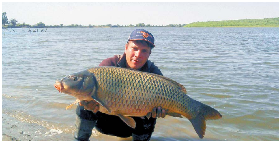
Коль сазан усат, то рыбак богат

– Каковы ваши самые впечатляющие трофеи?