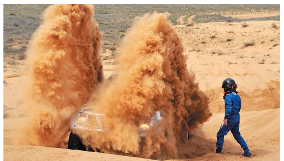
Коварные песчаные ловушки астраханской гонки