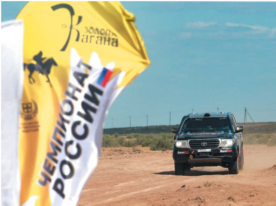
На официальных тренировках проверяется готовность машин к большому старту