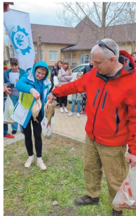
У любого рыбака есть своя история

– Дело было весной этого года в районе села Иванчуг Астраханской области. Мы с семьёй ездили на весеннюю рыбалку на воблу. Этот выход ничем не отличался бы от остальных в былые годы, если бы не одна особенность. Нам удалось вытащить на червя двух сазанов около двух килограммов каждый. На наше счастье, у наших соседей, которые находились рядом на берегу, оказался сачок, иначе вытащить на берег этих сазанов у нас не получилось бы.