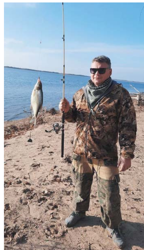
Рыбка мелка, да уха сладка

– Никаких секретов нет. Только по собственному опыту подмечено, когда основательно готовишься, планируешь выезд, то бывает, что клёв не удаётся, а вот когда