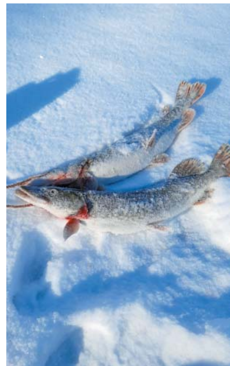
Из ериа уха, из щуки – котлеты

– Прошлой зимой открыл для себя новый вид рыбалки на жерлицу и живца на хищную рыбу. Техника ловли подлёдной рыбалки понравилась, да и улов порадовал. Причём удалась рыбалка с первого раза: пока устанавливал последнюю снасть, на первой уже поймалась щука. В тот день хищница была очень активная. Иногда при подсечке чувствовался серьёзный соперник, и тогда нужно было проявить максимум сноровки, чтобы подвести рыбу к лунке и вытащить её на лёд. Невероятная была рыбалка! Так я ещё никогда не ловил.