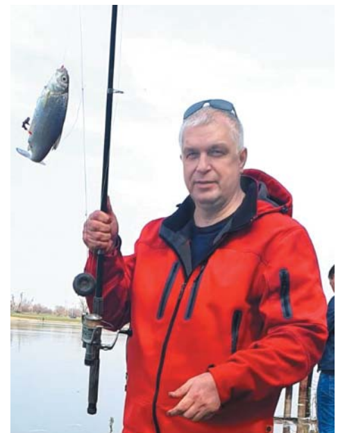
Была бы удочка, а рыба будет

– Часто хожу на рыбалку на свои проверенные места. Люблю рыбачить на лодке или уезжать на Бузан. В весенне-летний период чаще выезжаем с семьёй на природу, отдыхаем, купаемся и рыбку ловим. Однажды во время отпуска попробовал рыбачить в Чёрном море, наловили бычков. Конечно, рыбалка на море отличается от нашей. Но специально на рыбалку в другие города не ездил. Для меня рыбалка является прекрасным временем, чтобы побыть на природе с семьёй, друзьями. Она помогает мне забыть и отвлечься от ежедневной рутины, отдох-