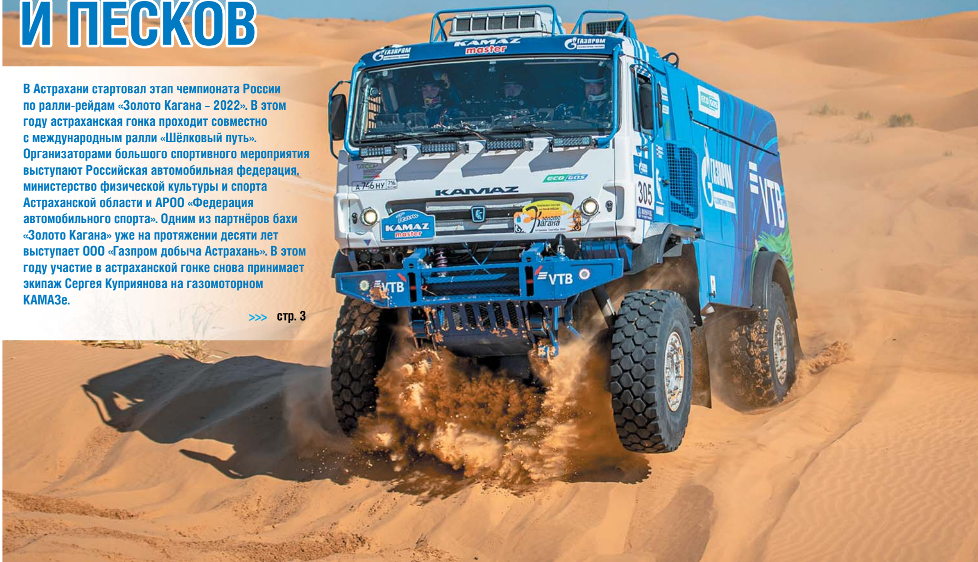
Экипаж Сергея Куприянова в астраханских песках