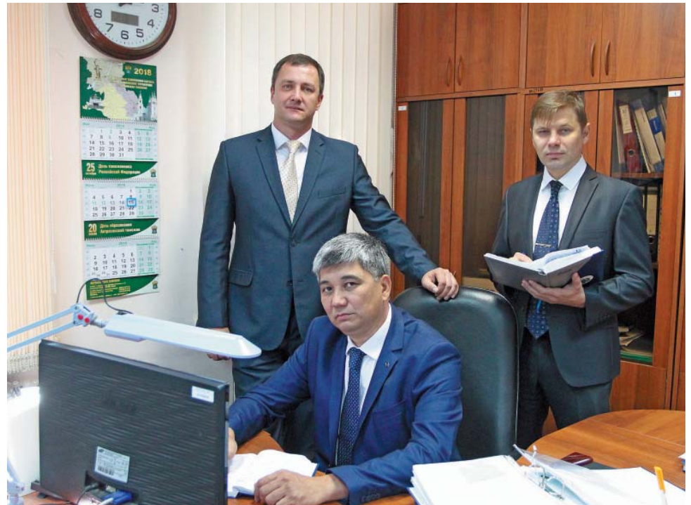
Подготовка к служебной проверке в подразделении