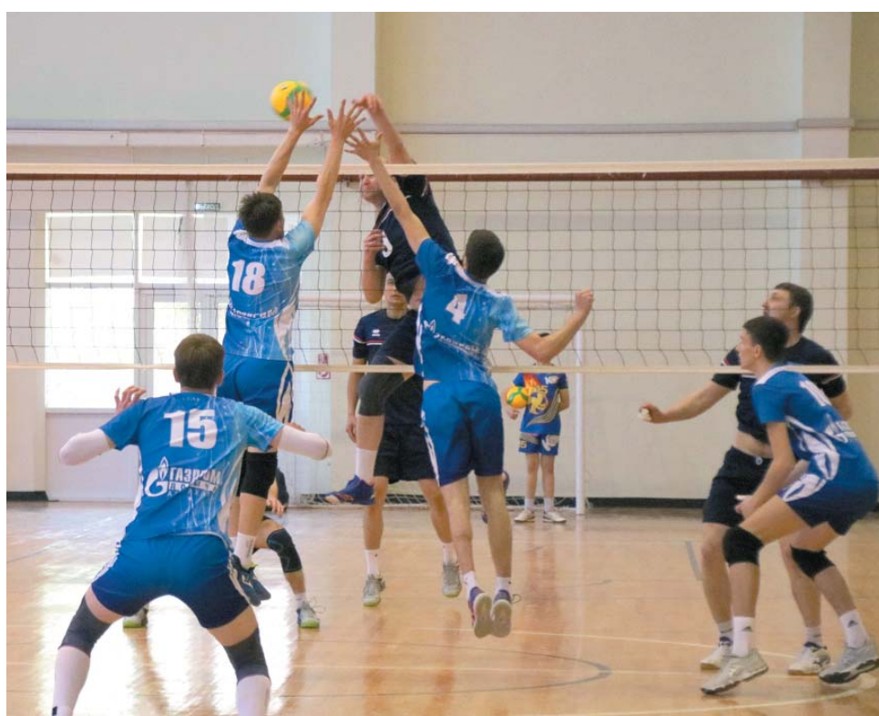
Мужская волейбольная команда ООО «Газпром добыча Астрахань»