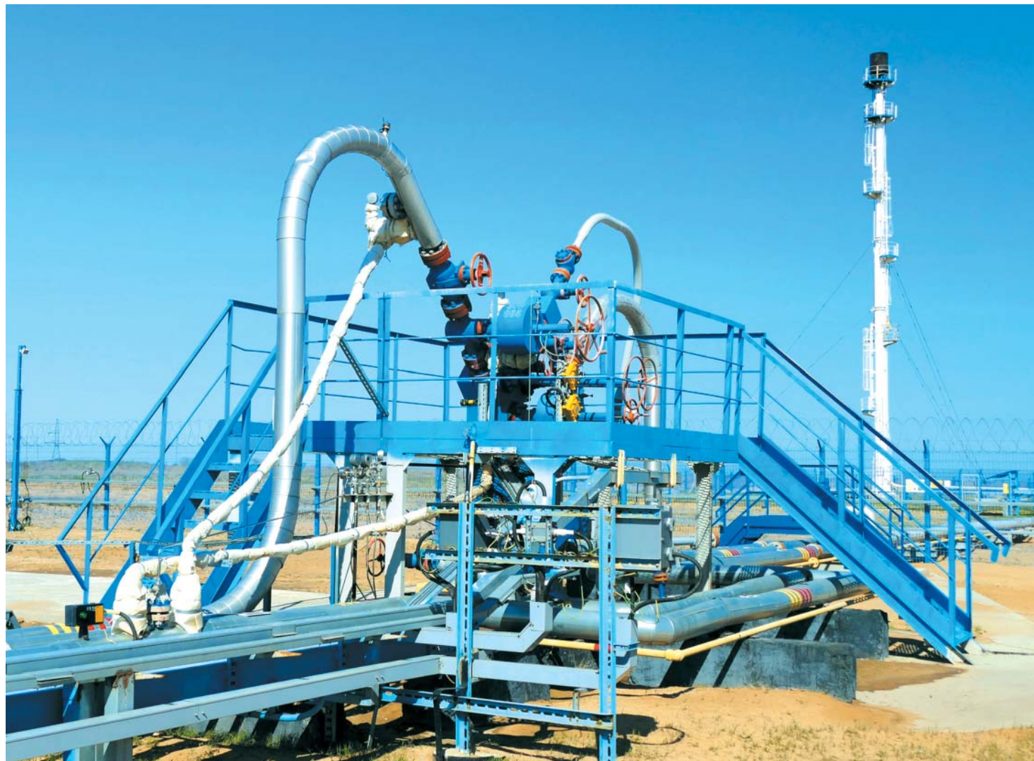
Фонтанная арматура Газпромышленного управления работает в любую погоду

– Владимир Иванович, несмотря на то, что в последние дни жара в Астраханской области отступила, лето ещё наверняка преподнесёт нам погодные сюрпризы. Впереди ещё как минимум 40 дней до календарной осени, а значит работники