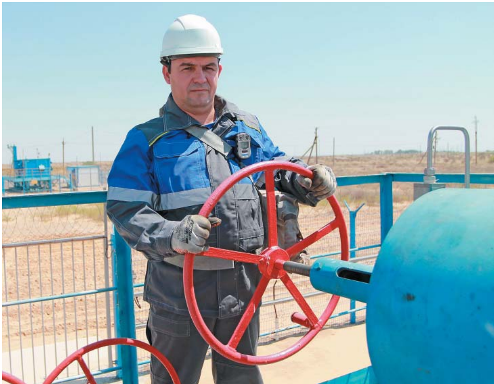
Мастер по ремонту скважин (подземному) ГПУ в процессе работы

– Астраханское ГКМ располагается на значительной территории, часть производственных объектов находится посреди степи, где нет возможности укрыться от палящего солнца. Какие в Обществе