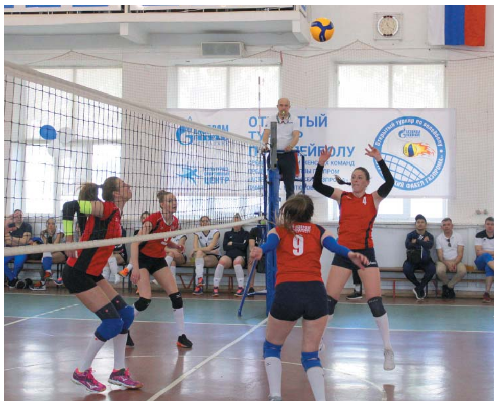
Женская волейбольная команда ООО «Газпром добыча Астрахань»