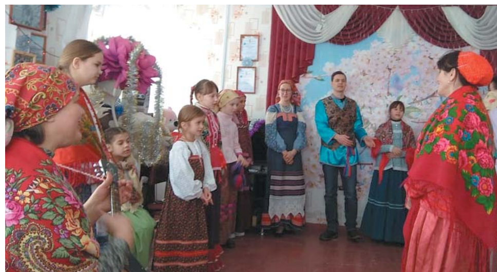
В гостях у липован

В этом году детский фольклорный ансамбль «Раздивье» Культурно-спортивного центра ООО «Газпром добыча Астрахань» празднует своё 15-летие. Коллектив воспитал много талантливых артистов. Некоторые из них продолжили карьеру на профессиональном уровне. За эти годы ансамбль прошёл большой творческий путь, являясь постоянным участником многих культурно-массовых мероприятий ООО «Газпром добыча Астрахань» и ПАО «Газпром», а также становился неоднократным победителем многих всероссийских и международных конкурсов.