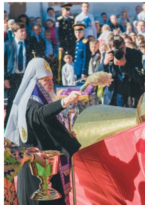
Освящение креста соборной колокольни Святейшим Патриархом Кириллом

Ещё одно новшество, прижившееся в храме – детские экскурсии. Здесь познакомиться с историей православной религии сотни астраханских школьников и воспитанников детских садов. Примечательно, что стены Троицкого собора расписаны так, что, продвигаясь вдоль них,