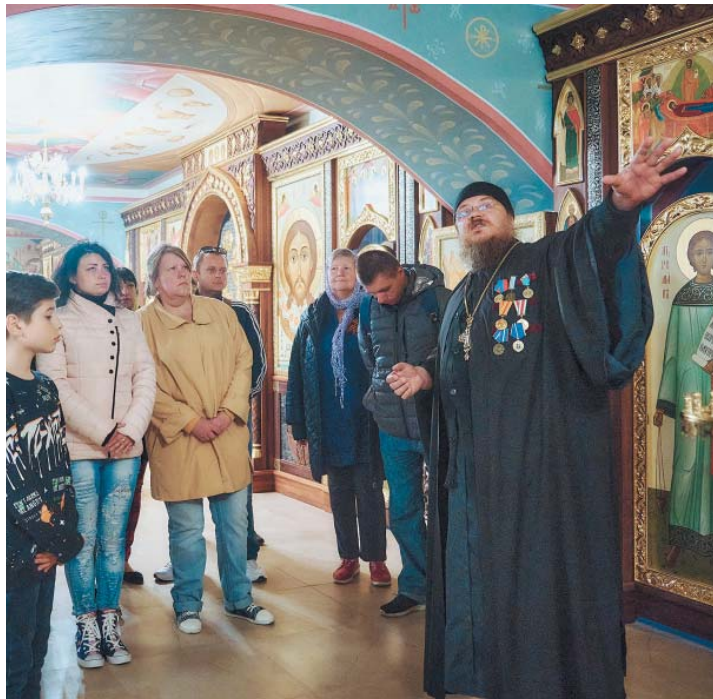
Экскурсия для гостей из Луганской и Донецкой народных республик

той Живоначальной Троицы стали пребывающие на астраханской земле жители Луганской и Донецкой народных республик. Вместе с ними в храм приеха-