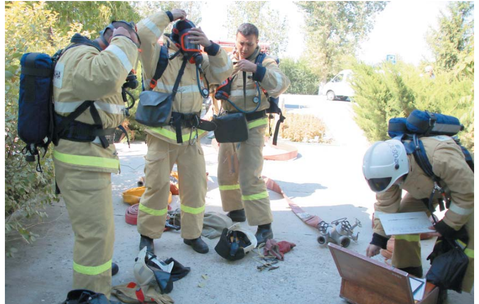
Пожарные надевают дымозащитную экипировку

При последовавшем разборе учений было отмечено, что все боевые расчёты ОВПО, участвовавшие в них, продемонстрировали высокие профессиональные навыки и умения, а задействованные подразделения и службы Общества показали хороший уровень взаимодействия.