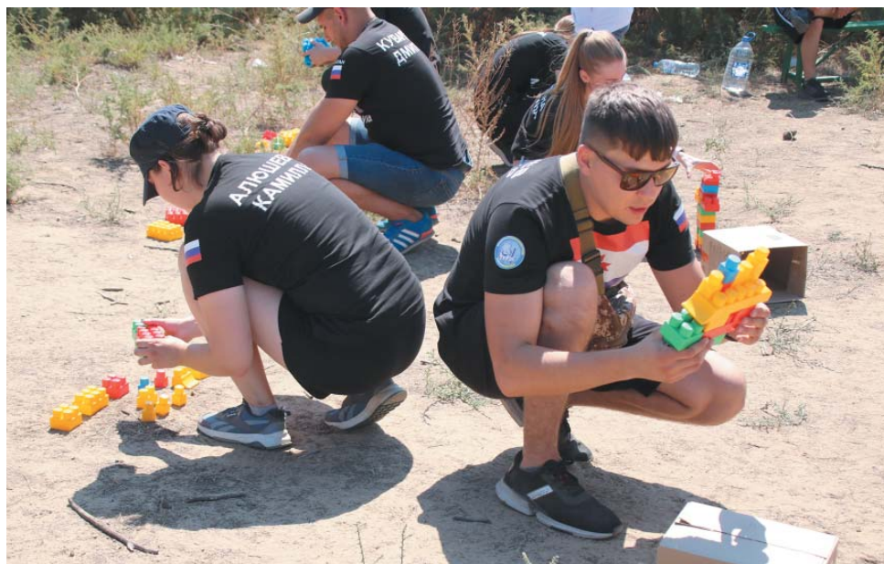
Умение работать в команде демонстрирует сборная ВЧ и Администрации