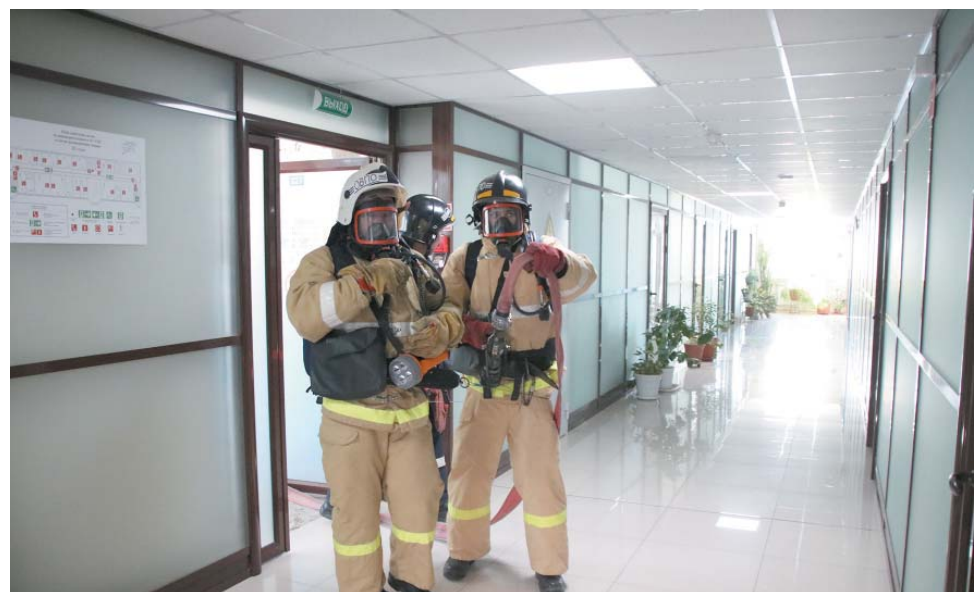
Проводится разведка третьего этажа здания