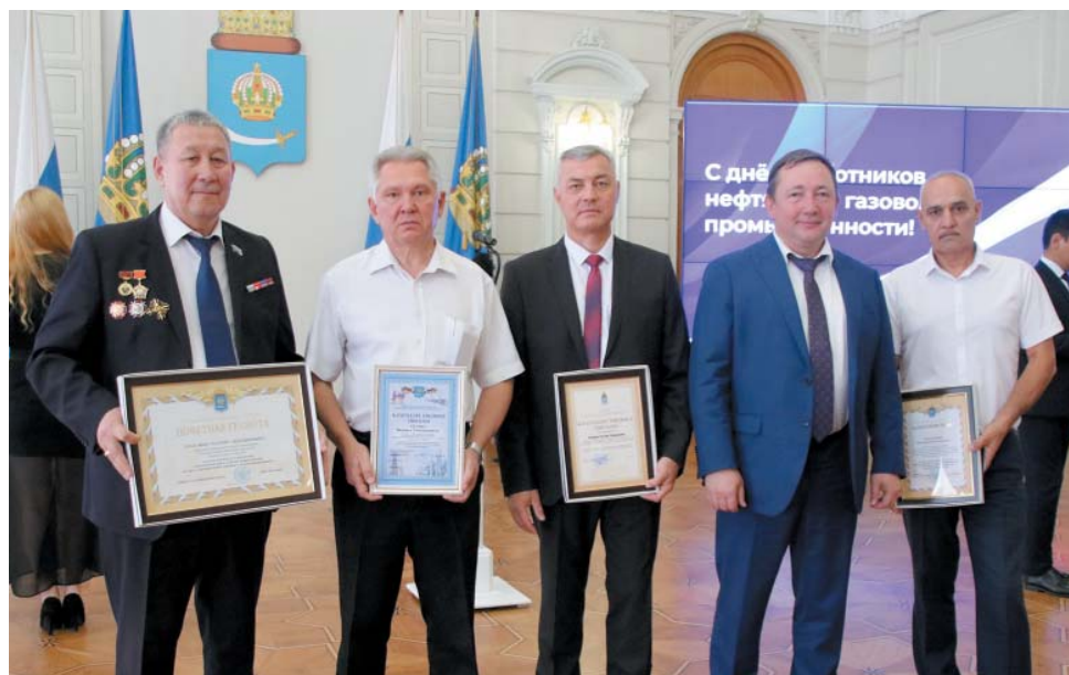
Представители ООО «Газпром добыча Астрахань» получили награды в преддверии профессионального праздника

– Развитие нефтегазовой отрасли – это не только возведение производственных мощностей, но и строительство жилья, новых крупных объектов соцкультбыта. Целые микрорайоны появились в Астрахани благодаря участию предприятий нефтегазового сектора. Желаю ра-