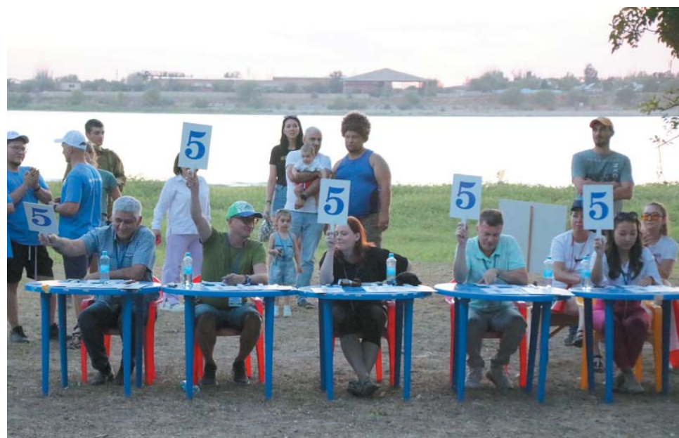
Жюри со всей строгостью оценивало конкурсные задания