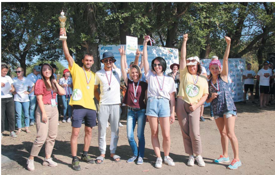
Второе место командного зачёта – сборная УКЗ и УЭЗиС