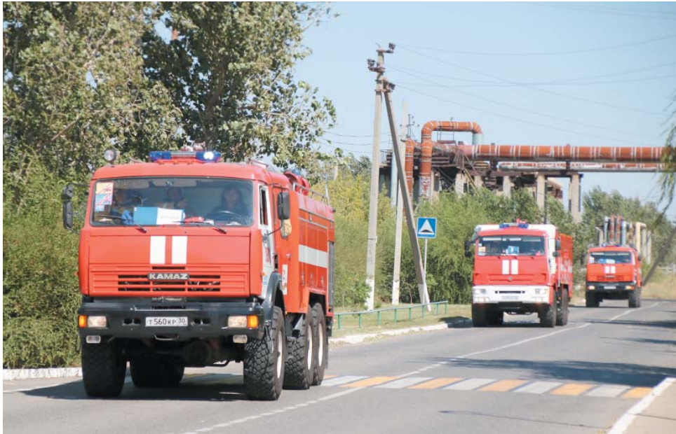
Подразделения ОВПО прибывают к месту вызова

Очередные тренировочные пожарно-тактические учения Отряда ведомственной пожарной охраны ООО «Газпром добыча Астрахань» состоялись в Газопромысловом управлении. Их объектом стало здание Инженерного корпуса № 1.