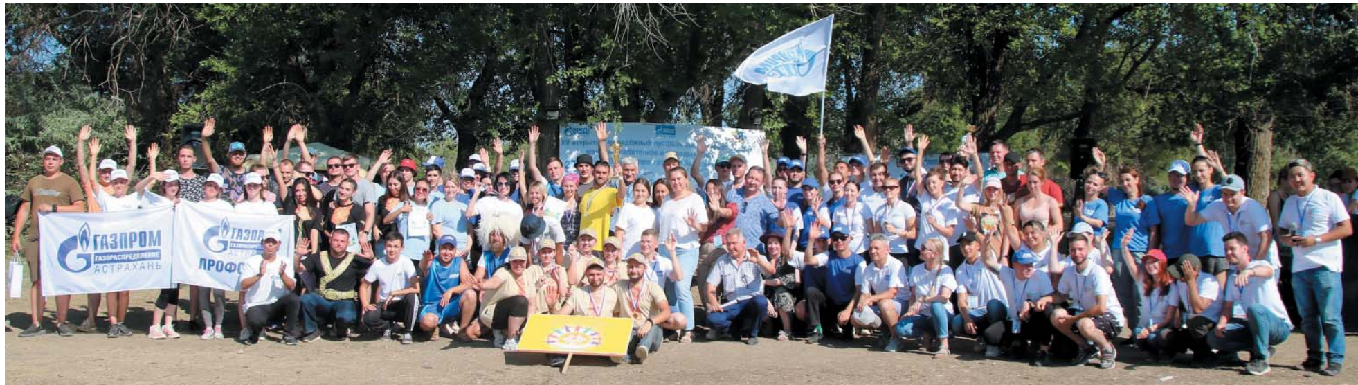
Общее фото участников XV открытого молодёжного профсоюзного туристического слёта молодых работников и молодых специалистов ООО «Газпром добыча Астрахань»

В Наримановском районе Астраханской области прошёл XV открытый молодёжный профсоюзный туристический слёт молодых работников и молодых специалистов ООО «Газпром добыча Астрахань». В двухдневном мероприятии приняли участие восемь команд, представлявших подразделения Общества, и пять команд предприятий и организаций Группы «Газпром» – Астраханского ГПЗ ООО «Газпром переработка», ООО «Газпром энерго», ООО «Газпром газораспределение Астрахань», филиала Банка ГПБ (АО) «Южный» и ООО «Газпромтранс-Астрахань». Организаторами выступили СМУС ООО «Газпром добыча Астрахань» при поддержке Управления кадров Администрации и ОППО «Газпром добыча Астрахань профсоюз».