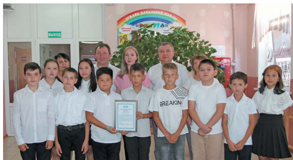
Встреча с участниками «Голубого патруля»

В рамках поездки в Красноярский район он встретился с активистами и поблагодарил за работу от имени генерального директора Общества Андрея Мельниченко и от себя лично. Благодарственные письма были вручены директорам МБОУ «Красноярская СОШ № 1» и МБОУ «Черёмухинская основная общеобразовательная школа». А школьников ждёт увлекательная поездка в Астраханский биосферный заповедник. Экскурсию организуют в середине сентября, будут отработаны вопросы безопасности, перевозки детей на автобусах.