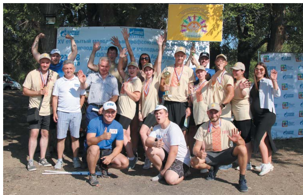
Победители туристического слёта – команда ГПУ