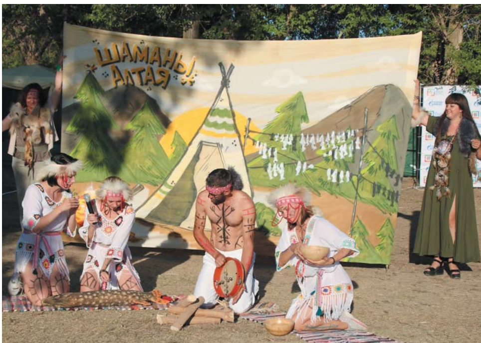
Сборная УКЗ и УЭЗиС представляет творческое задание