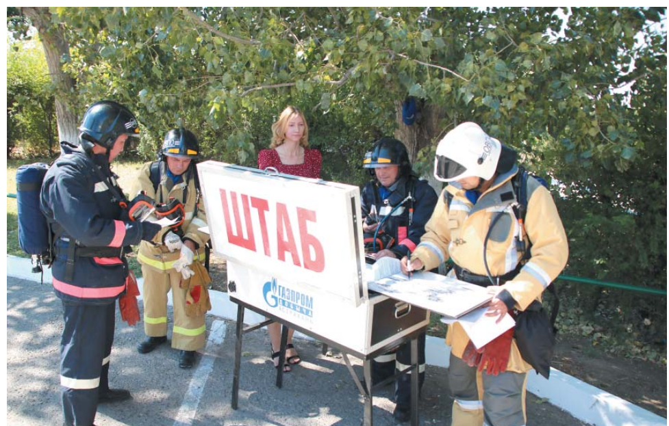
Штаб пожаротушения координирует действия огнеборцев