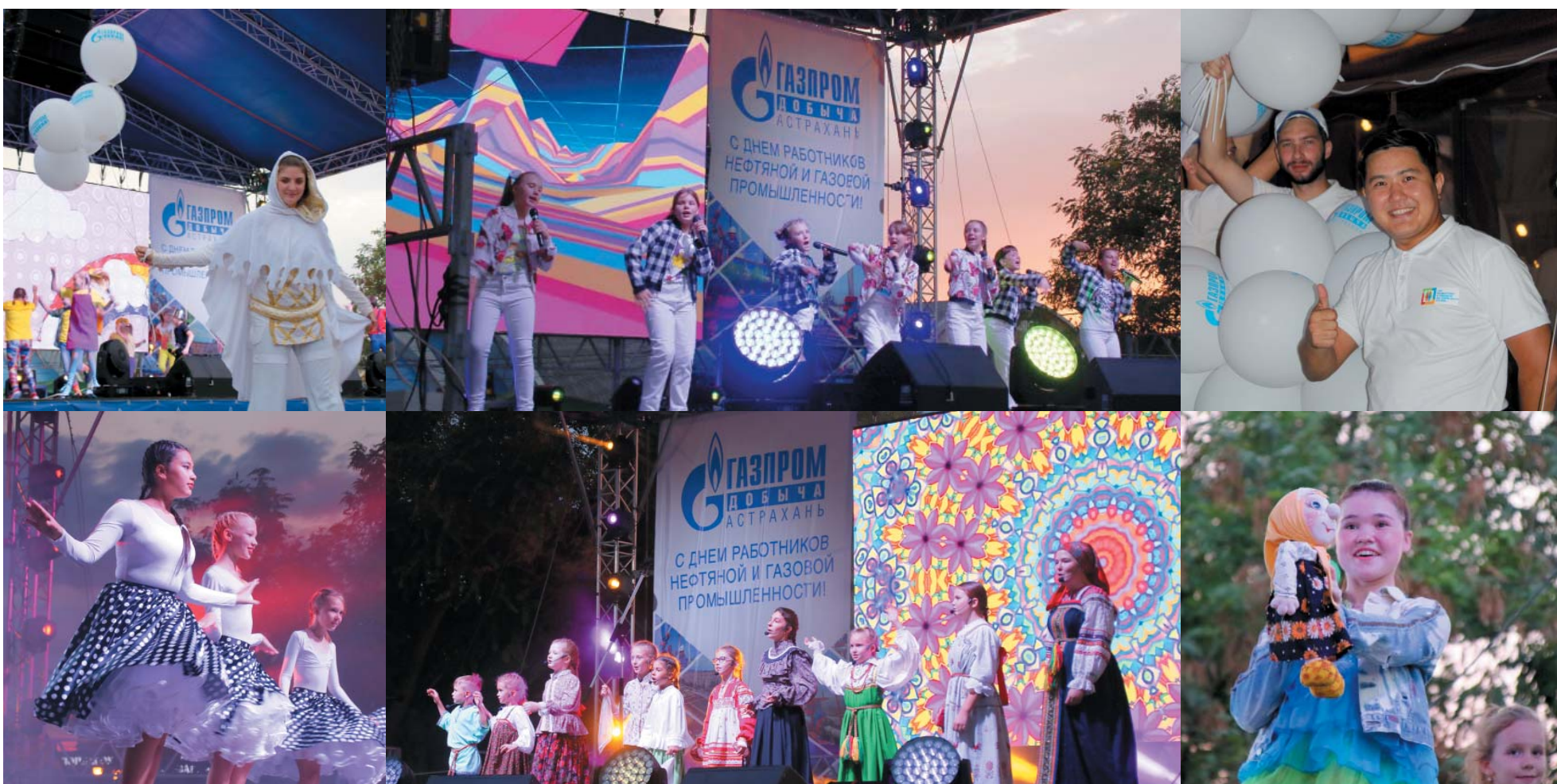
Праздничный концерт в День работников нефтяной и газовой промышленности на набережной Волги

В ДЕНЬ РАБОТНИКОВ НЕФТЯНОЙ И ГАЗОВОЙ ПРОМЫШЛЕННОСТИ ООО «ГАЗПРОМ ДОБЫЧА АСТРАХАНЬ» ПОДГОТОВИЛО ПРАЗДНИЧНЫЙ ПОДАРОК ВСЕМ АСТРАХАНЦАМ И ГОСТЯМ РЕГИОНА