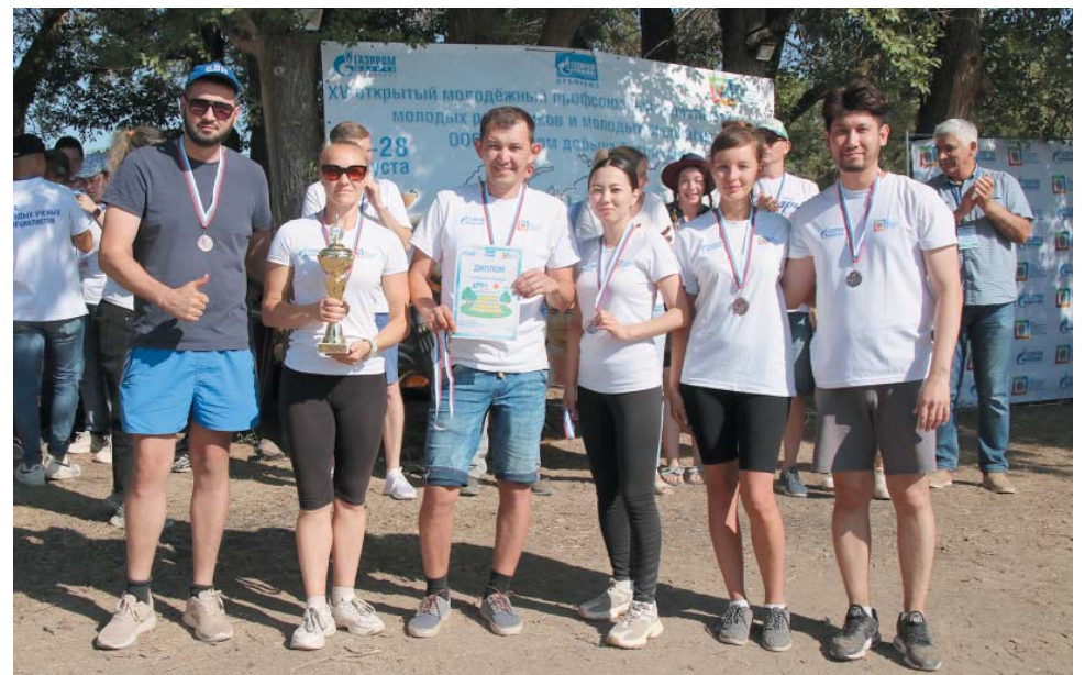
Бронзовый призёр – команда АГПЗ