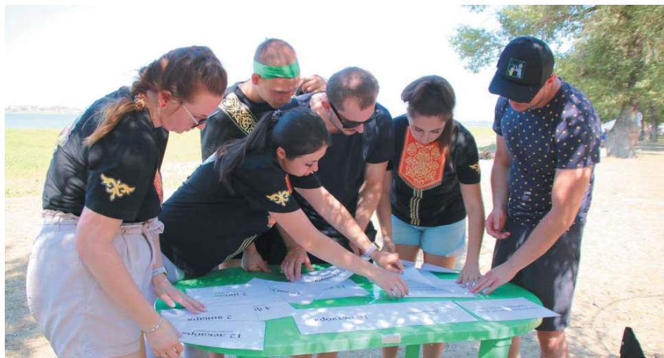
Одно из заданий туристического квеста выполняет команда ИТЦ