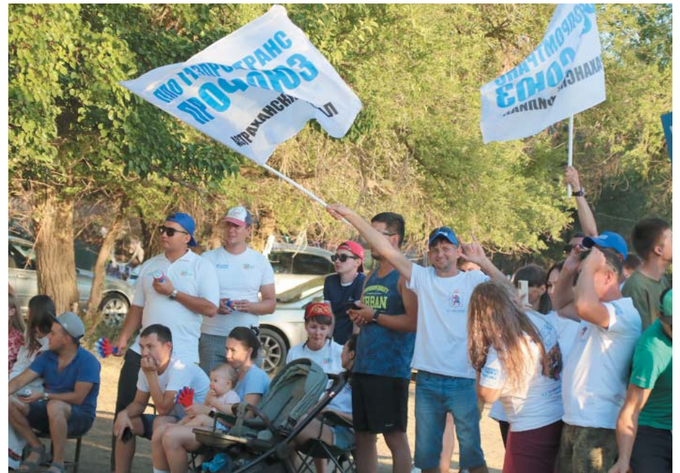
Многие участники и болельщики приехали на турслёт с детьми

Перед финальным конкурсом, который проходил уже во второй день туристического слёта, сразу несколько команд ггли дыханием спину лидера. Заключительное задание представляло собой туристический квест. В течение трёх с половиной часов участники прошли 13 локаций, включавших в себя конкурсы – от интеллектуальных до спортивных. На финиш-