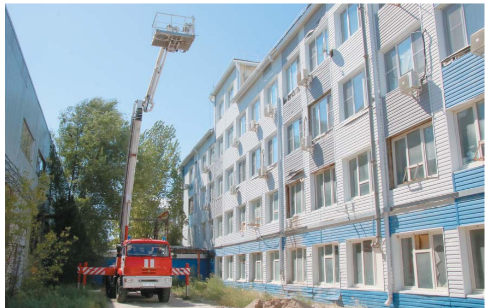
На месте условного пожара работает коленчатый пожарный автоподъёмник