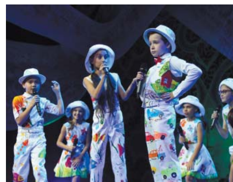
Эстрадно-джазовая студия «Rich Sound»