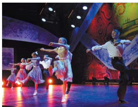
Студия народного танца «Волжские зори»