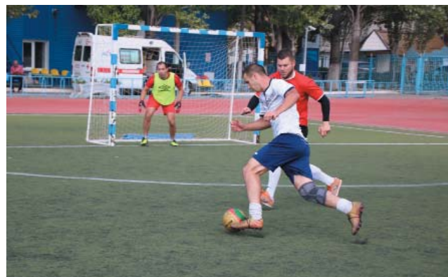
Лидер команды ЦДГиГК № 1 и ЛЭС в атаке