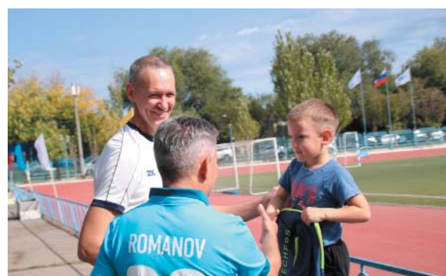
Призы от профкома получили все юные участники