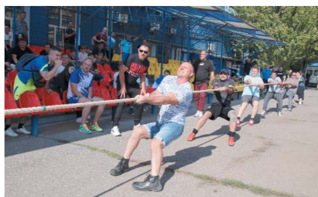
Самая зрелищная дисциплина – перетягивание каната