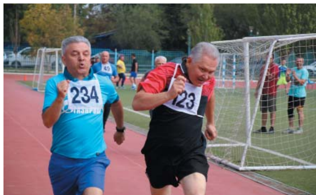
Бескомпромиссная борьба на финише