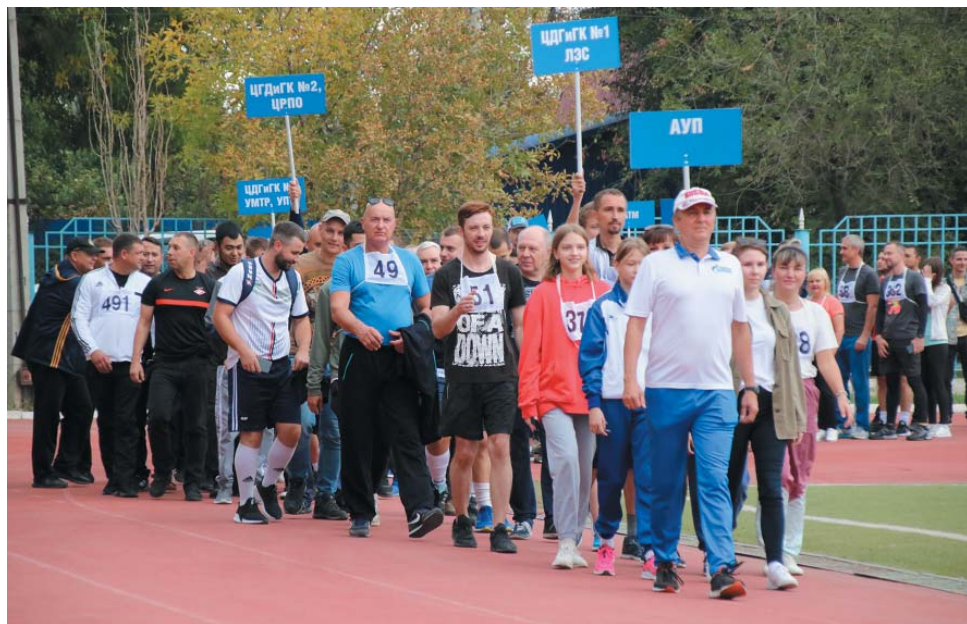
Открытие спартакиады Газопромыслового управления

В Обществе «Газпром добыча Астрахань» завершилась спартакиада Газопромыслового управления. В течение нескольких недель восемь команд газопромысловиков, представлявшие подразделения ГПУ, выявляли сильнейших в семи спортивных дисциплинах. В финальной части прошли соревнования по волейболу, мини-футболу, легкой атлетике среди мужчин и среди женщин, а также по перетягиванию каната.