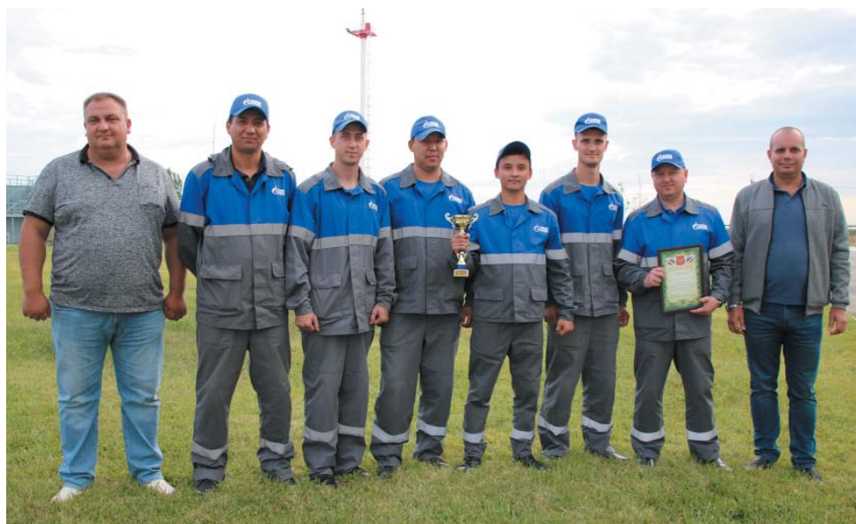
Участники и руководители команды ОВПО – серебряные призёры чемпионата