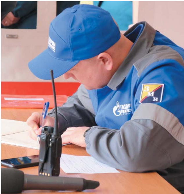
Задача диспетчера – координация действий расчёта