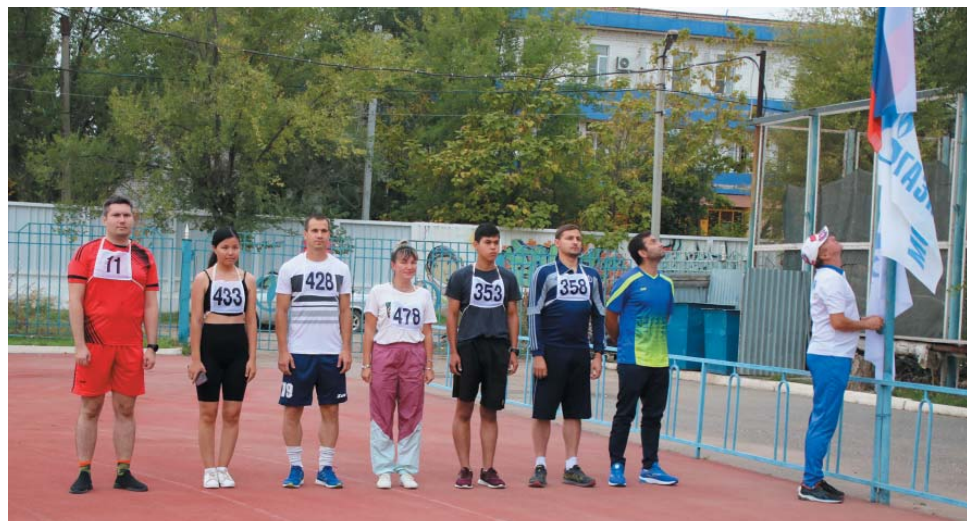
Торжественное поднятие флагов

Завершилась спартакиада Газопромыслового управления церемонией награждения, где призёры в четырёх видах спорта получили грамоты и медали, а победители ещё и кубки. По итогам всех семи дисциплин первое место и главный кубок соревнования завоевали спортсмены ЦНИПР, на втором месте АУП, на третьем – сборная ЦДГиГК № 1 и ЛЭС.