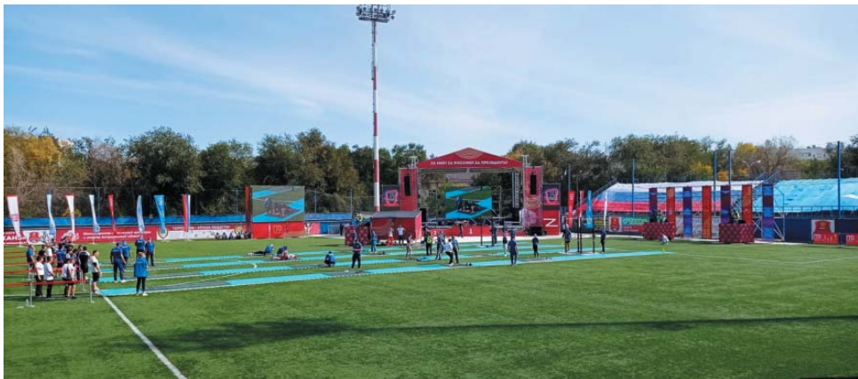
Большой фестиваль ГТО проходил в формате эстафеты

В воскресенье, 2 октября, на стадионе спортивного клуба «Астрахань» на улице Ползунова состоялся Большой фестиваль Всероссийского физкультурно-спортивного комплекса «Готов к труду и обороне» (ГТО). Его участниками стали 12 команд из Астрахани и области, среди них – сборная ООО «Газпром добыча Астрахань».