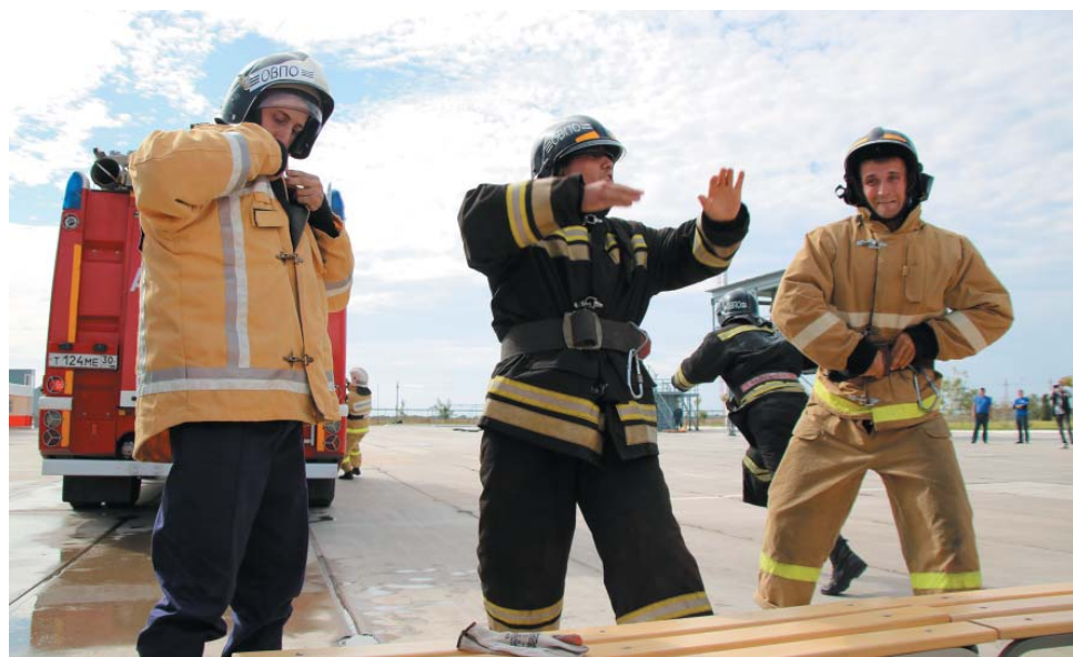
Надеть пожарную амуницию за несколько секунд – дело непростое

Сотрудники Отряда ведомственной пожарной охраны ООО «Газпром добыча Астрахань» приняли участие в открытом чемпионате Главного управления МЧС России по Астраханской области по комплексному боевому развёртыванию. Соревнования проходили на базе учебного центра в с. Ильинка Икрянинского района и были приурочены к 90-летию гражданской обороны Российской Федерации.