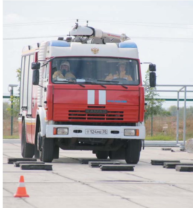
Одновременно испытывается профессионализм водителя пожарной цистерны