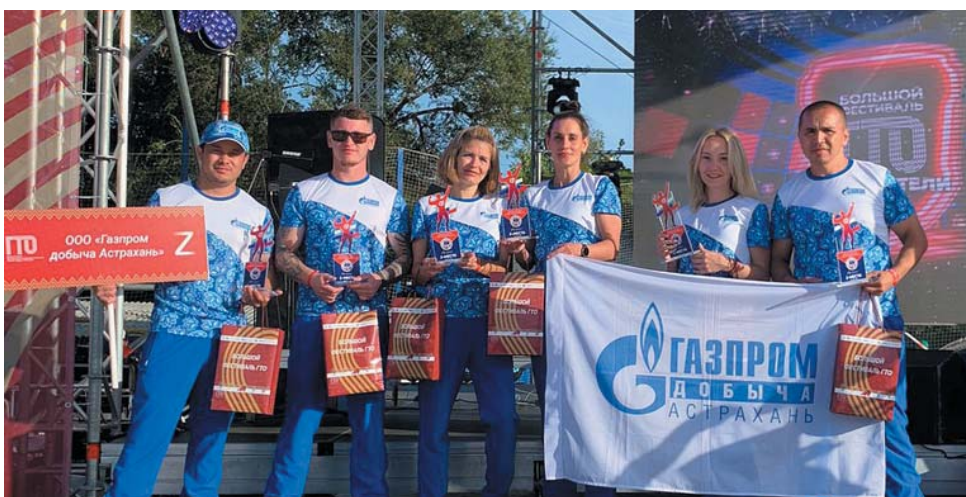
Команда ООО «Газпром добыча Астрахань»

По итогам фестиваля наша команда заняла второе место, уступив только сборной Ахтубинского района. На третьем месте – представители Приволжского района. Впрочем, фестиваль ГТО – пример соревнований, где проигравших не бывает.