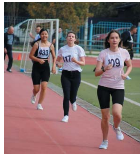
Легкоатлетический забег среди женщин