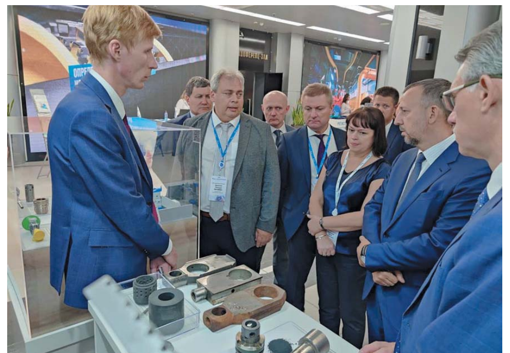
ООО «Газпром добыча Астрахань» представило на выставке в рамках XI Международной конференции «Обслуживание и ремонт основных фондов ПАО «Газпром» стенд «Изготовление деталей по технологии порошковой металлургии»

Данная разработка вызвала живой интерес и со стороны участников XI Международной конференции «Обслуживание и ремонт основных фондов ПАО «Газпром». Она была удостоена диплома в номинации «Реализация современных технологических решений при восстановлении основных фондов».