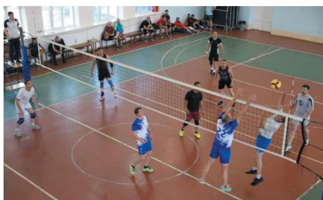
Финал волейбольного турнира