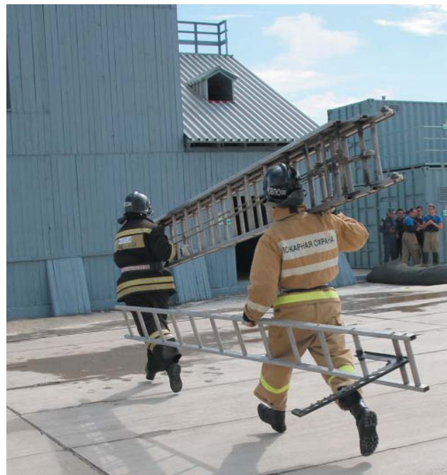
На башню необходимо подняться по трёхколенной и штурмовой лестницам