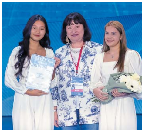
Rich Sound, старшая группа