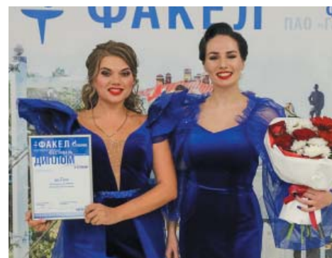
Дуэт Bella voce