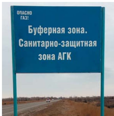
Граница буферной зоны на местности обозначена специальными информационными знаками

Современные технические решения обеспечивают раннее обнаружение газопроявлений или утечек при добыче и переработке сырья. Буферная (защитная) зона является территорией с особым пропускным режимом, порядок нахождения в ней людей и ведения работ строго регламентирован, а именно: запрещено пребывание лиц без средств индивидуальной защиты органов дыхания и не прошедших соответствующего инструктажа о правилах безопасного нахождения на данной территории, проживание населения, выпас домашнего скота, строительство производственных и иных объектов, остановка и стоянка транзитного пассажир-