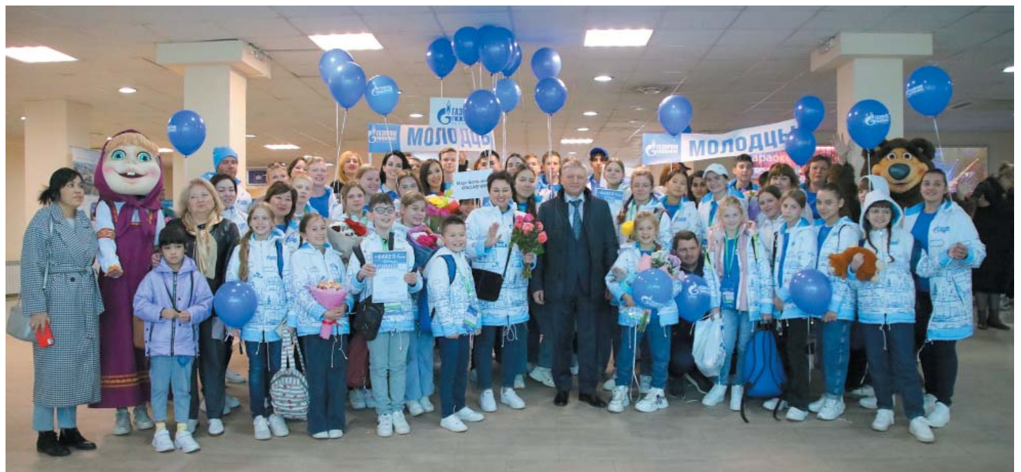
Возвращение астраханской делегации домой