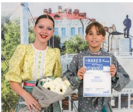
Ансамбль народного танца «Лазурь»