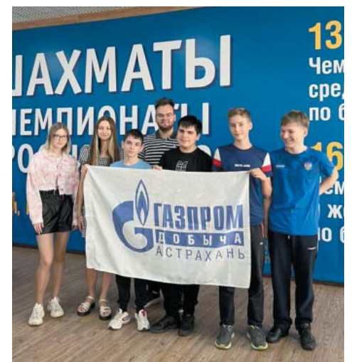
Сборная ООО «Газпром добыча Астрахань» по шахматам в Сочи

Участие в турнире принял 91 шахматист из Москвы, Санкт-Петербурга, Республики Крым, Краснодарского края, а