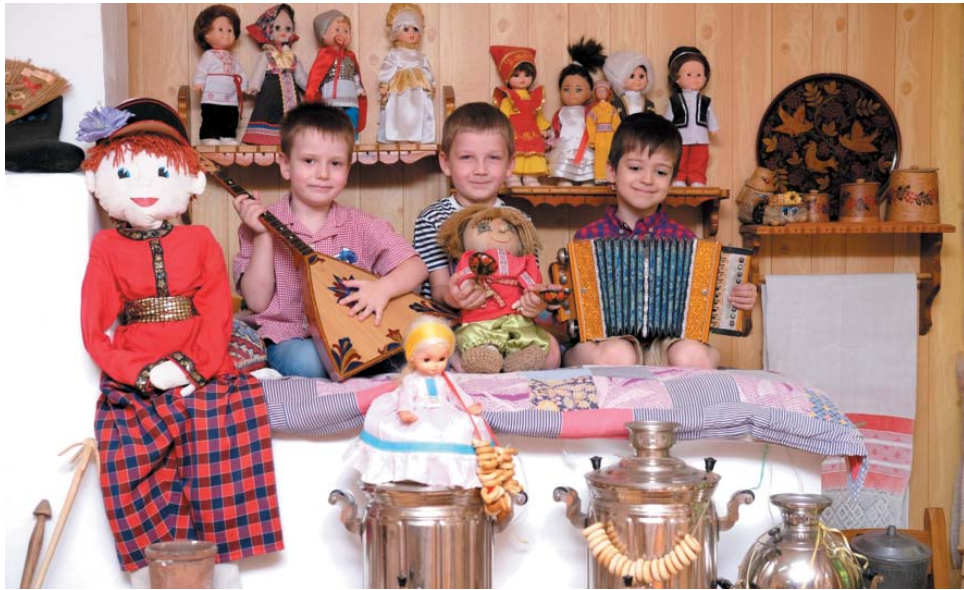
Интерактивное занятие в музее «Русская изба»

Как известно, 2022 год посвящён культурному наследию народов России. С целью приобщения воспитанников к народным традициям, расширения кругозора, популяризации народного искусства в детских садах ЧДОУ «ЦРР – д/с «Мир детства» в течение года проводятся интересные тематические мероприятия.