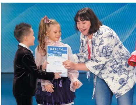
Rich Sound, младшая группа