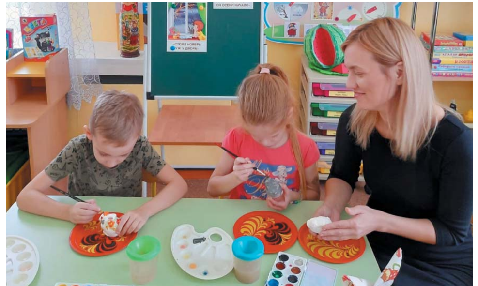
Мастер-класс «Роспись сказочной птицы»