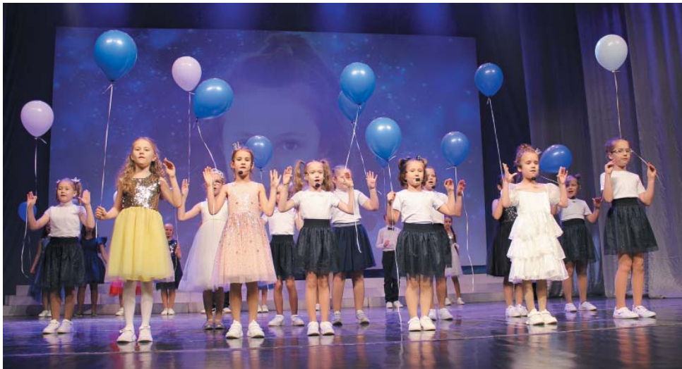
Финальный номер «Я пою»