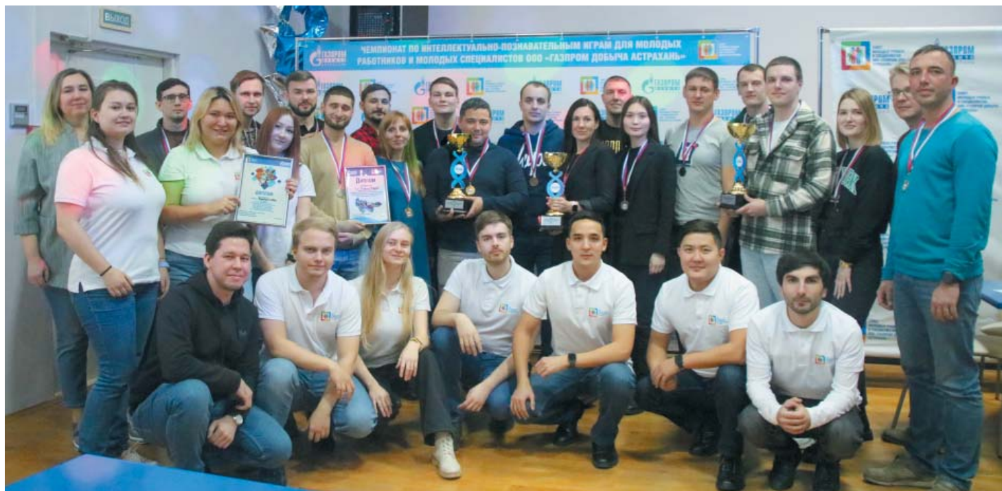
Победители, призёры и организаторы турнира

– Радует, что у нас в Обществе уделяют должное внимание работе с молодёжью и вновь принятыми работниками. Хотим поблагодарить организаторов турнира, сказать большое спасибо Совету молодых учёных и специалистов, представителям отдела развития персонала и управления кадров Общества. Организация чемпионата была на самом высшем уровне. Очень приятно принимать участие в подобных мероприятиях.