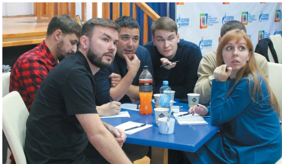
Победителем турнира стала команда «В кругу Друзей» (Газпромнефтегазовое управление)

ких-либо сюрпризов. Команды лидирующей тройки уверенно отвечали на самые сложные вопросы, поочередно вырываясь вперёд в турнирной таблице.