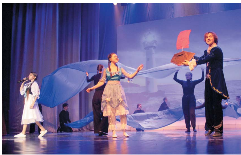
Концертный номер «Асоль»

Участие в концерте приняли как самые маленькие артисты, начавшие заниматься в этом году, так и взрослые ребята старшей группы, некоторые из них уже стали студентами музыкального колледжа. Всем коллективом они открыли торжество попу-