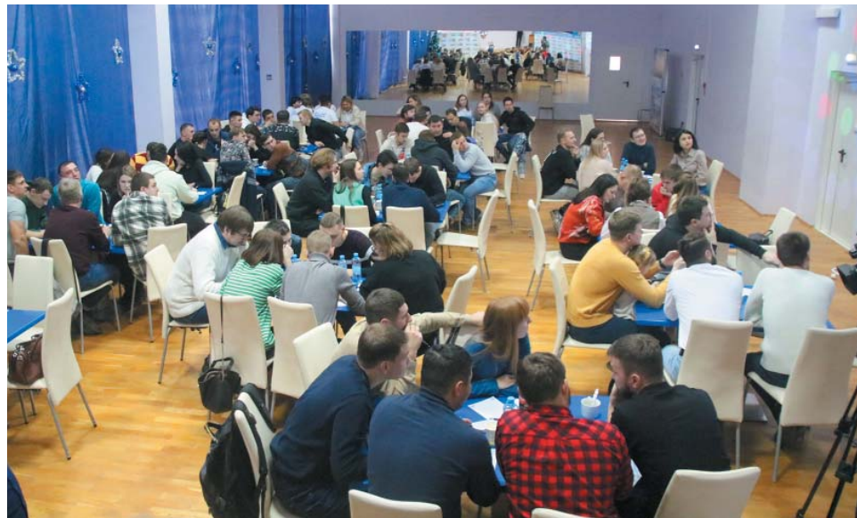
В заключительной игре Чемпионата по интеллектуально-познавательным играм среди молодых работников и молодых специалистов ООО «Газпром добыча Астрахань» приняло участие 14 команд

Группу преследователей возглавляла «Кристина аСМУС» – сборная, представлявшая Совет молодых учёных и специалистов. Однако её отставание от лидировавшего «триумvirата» было достаточно большим. Поэтому можно сказать, что третий этап чемпионата прошёл без ка-