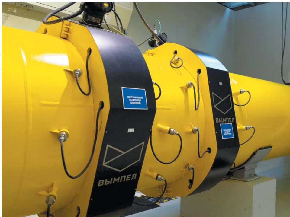
Ультразвуковой измерительный комплекс

В конце ноября 2022 года заключён договор на поставку двух новых газотурбинных двигателей АЛ-41СТ-25. Установка головного образца двигателя в состав газоперекачивающего агрегата и начало опытно-промышленных испытаний на компрессорной станции «Газпрома» запланированы в декабре 2023 года.