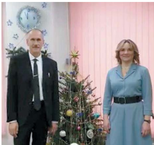
Новогоднюю ночь диспетчеры Общества встречают на работе

Телефон службы очень легко запомнить, наверное,