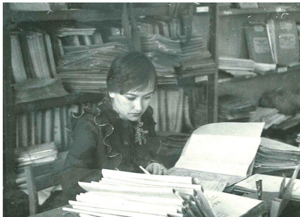
Проверка исполнительной документации, осень 1986 года