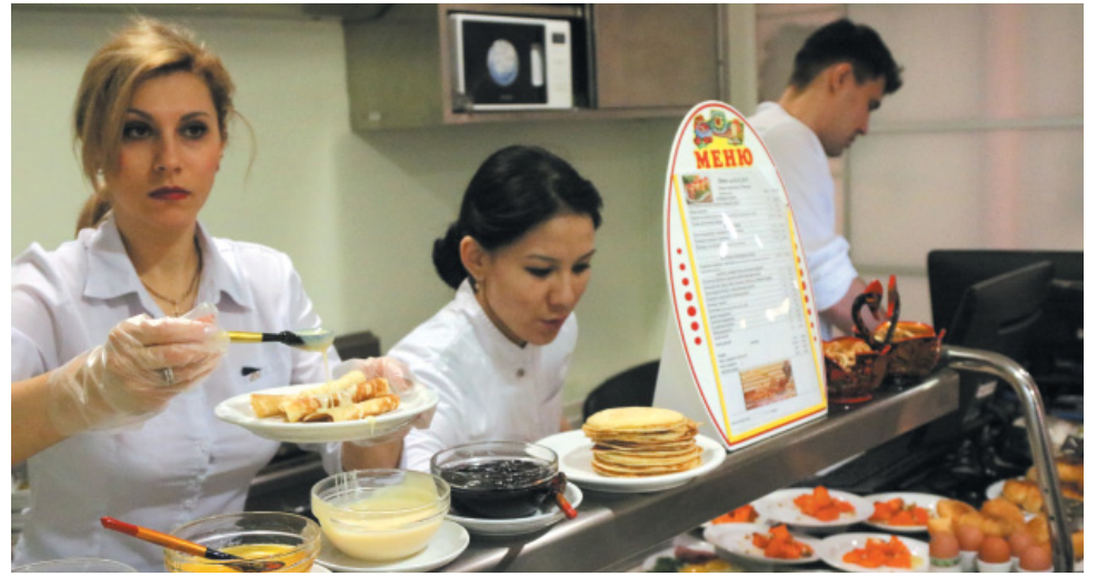
Тысячи блинов с разными начинками и добавками приготовили на праздничной неделе сотрудники комплекса питания УЭЗиС

На этой неделе в столовой главного офиса Общества «Газпром добыча Астрахань» был настоящий гастрономический бум: блины с начинками и без, чаи, компоты, кисели, оладушки и торты. Таким вкуснейшим разнообразием сотрудники комплекса питания УЭЗиС поздравили работников с Масленичной неделей. Весь ассортимент лакомств был представлен в специальном тематическом меню от шефа-повара.