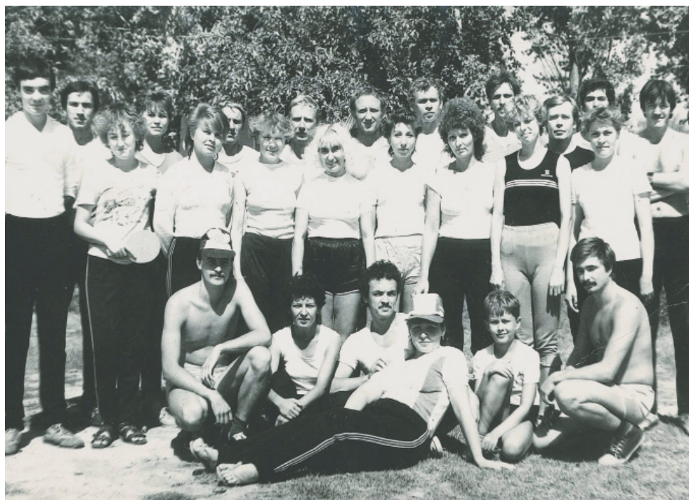
Спартакиада ДП «Астраханьгазпром», август 1986 года