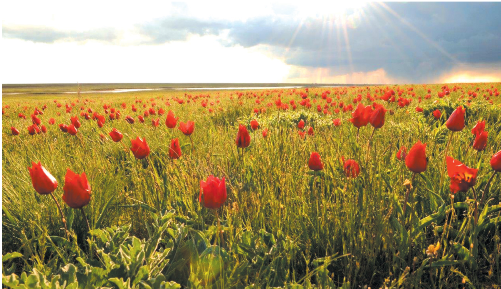
«Умытая дождем степь», автор – ведущий инженер ОООС ИТЦ Марина Семяк. Работа участника фотоконкурса «Кудрявый пеликан-2018»