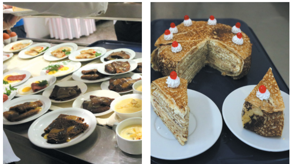
Блины на пшеничной, гречневой, рисовой муке, кружевные на минеральной воде и классические дрожжевые и, конечно, блинный торт