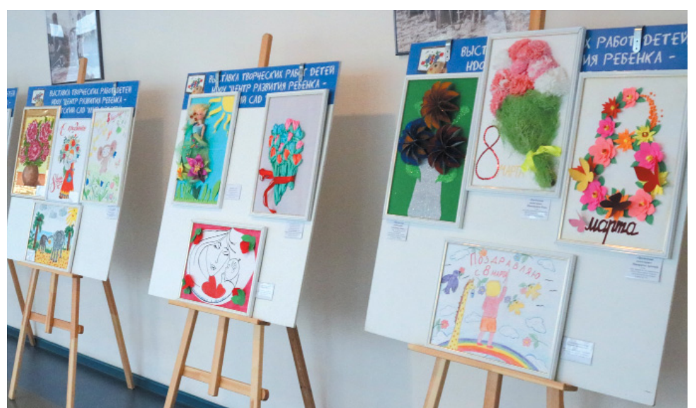
Выставка детского творчества к 8 Марта, посвящённая мамам, в АЦГ-1