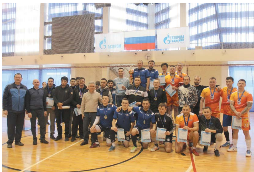
Победители и призёры соревнований по футболу