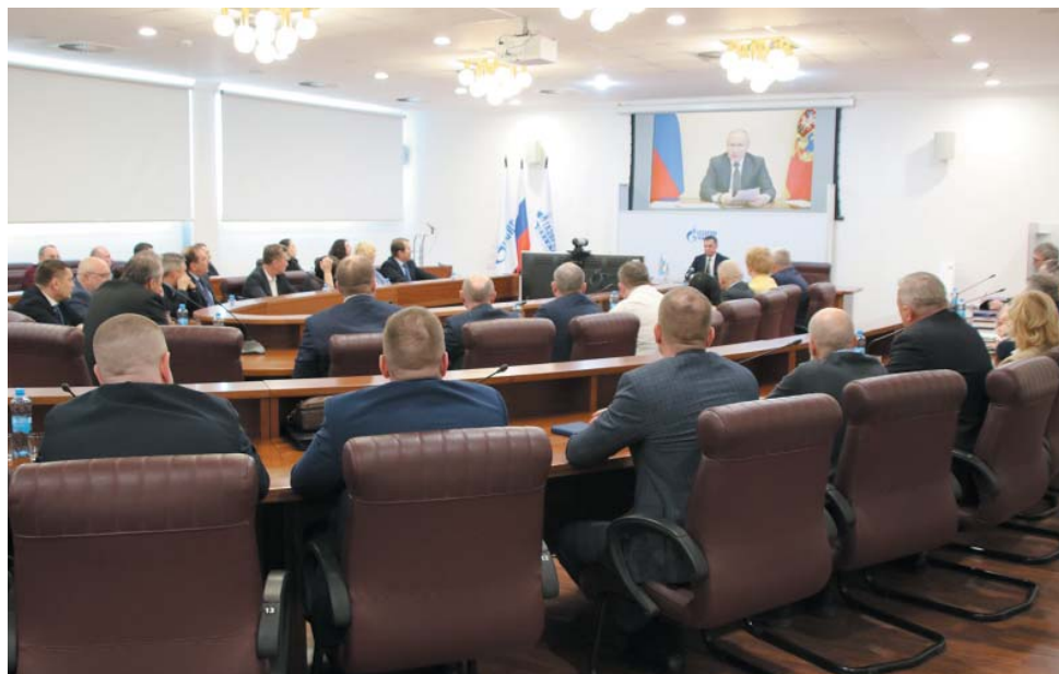
Праздничный селектор в ООО «Газпром добыча Астрахань»