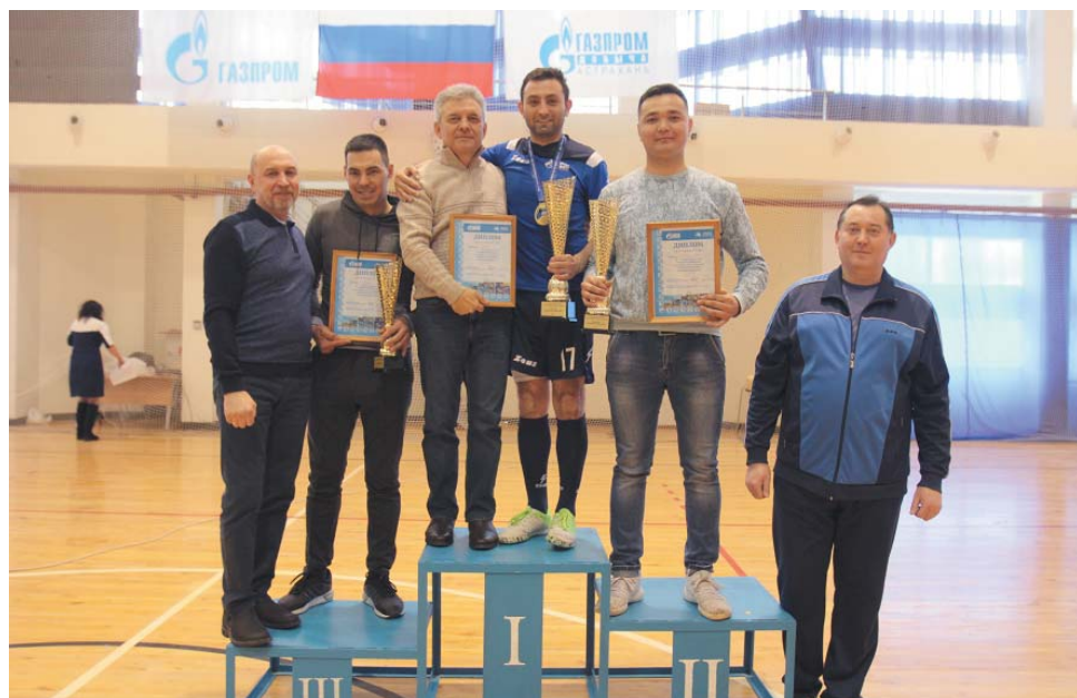
Пьедестал почёта 36-й Зимней спартакиады работников структурных подразделений ООО «Газпром добыча Астрахань» в комплексном зачёте