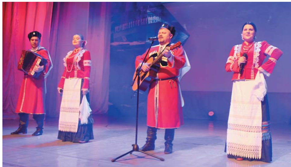
Артистам удалось наполнить сердца зрителей чувством гордости за нашу Родину