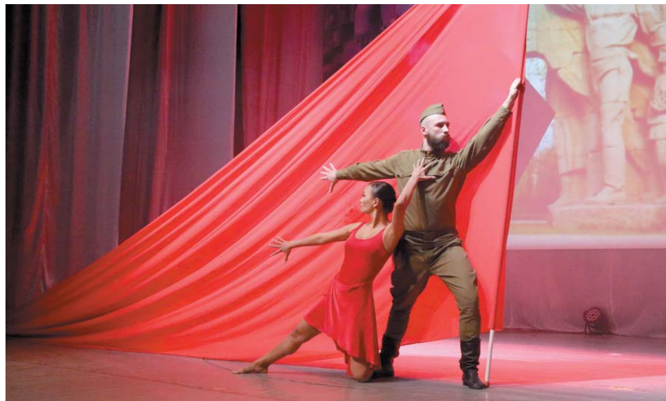
Лейтмотивом праздничного концерта стала патриотическая тематика

Завершилось праздничное действие громкими аплодисментами зрителей. Ве-