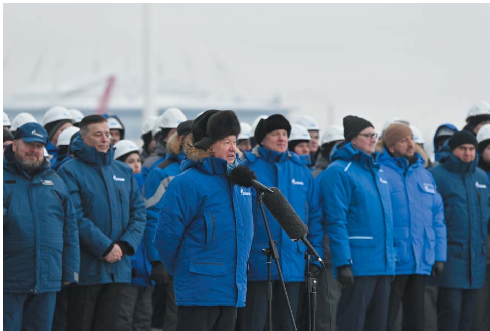
Председатель Правления ПАО «Газпром» Алексей Миллер во время телемоста