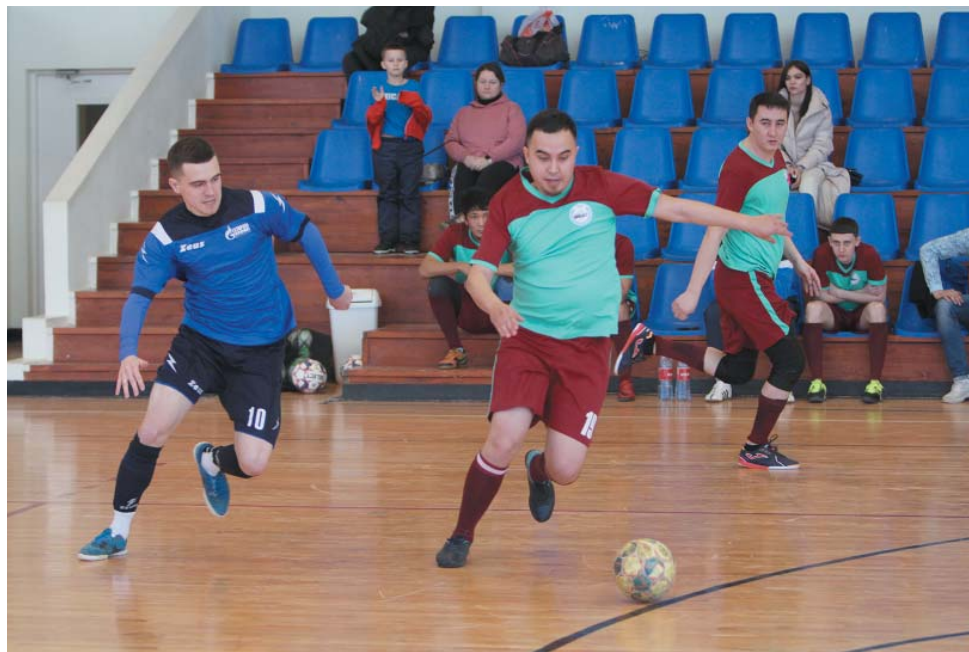
Большинство матчей турнира прошло в упорной, напряжённой борьбе