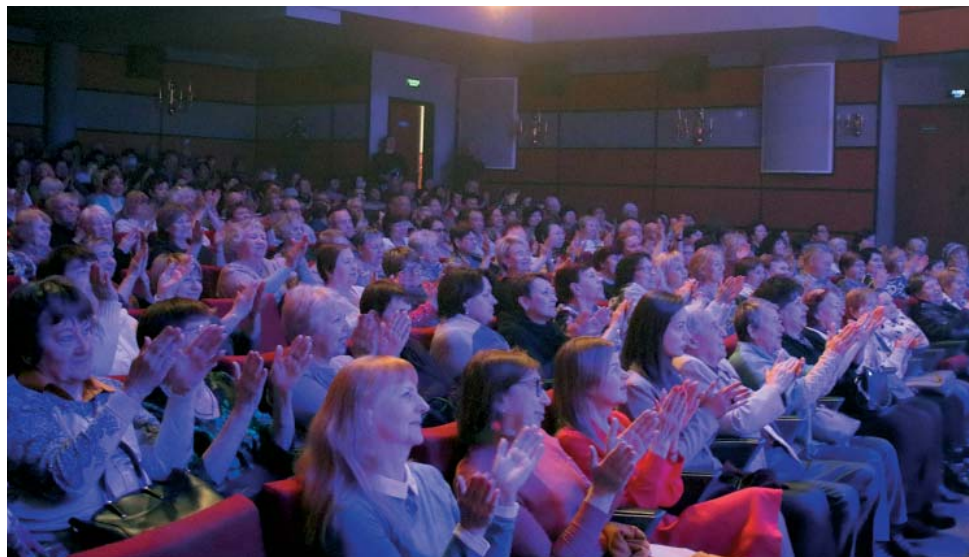
Аплодисменты зрителей – лучшая благодарность