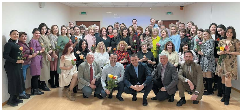
Управление материально-технического снабжения и комплектации