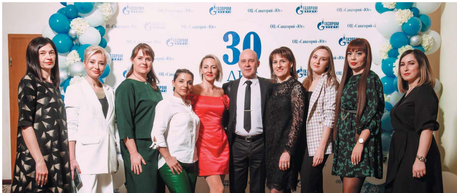
Сотрудники санатория «Юг» на праздничном мероприятии