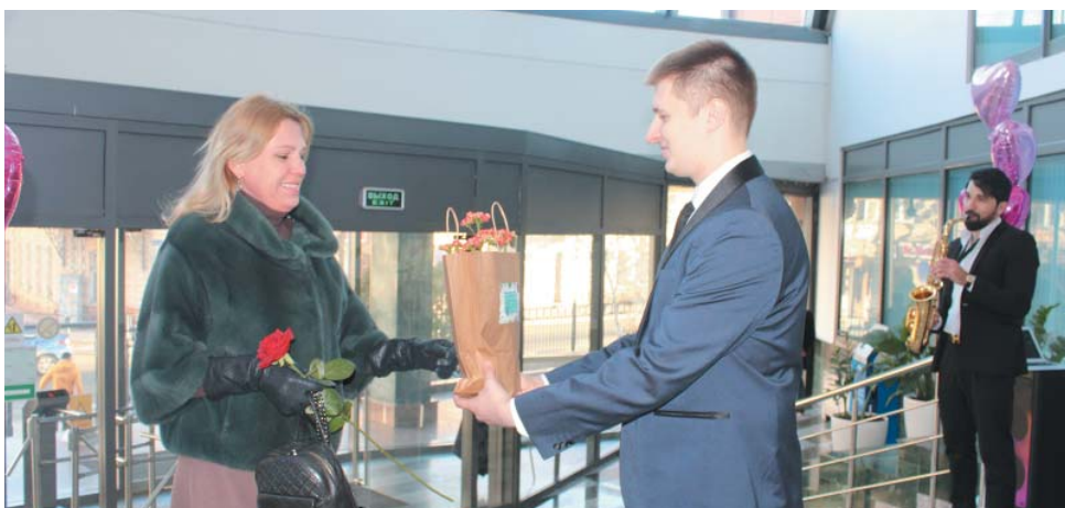
Административный центр газовиков-1