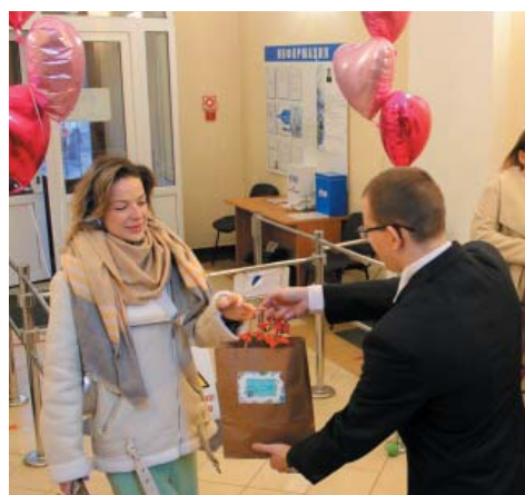
Административный центр газовиков-2

Накануне Международного женского дня, в административных зданиях Общества и во всех структурных подразделениях Астраханского газодобывающего предприятия мужчины встречали представительниц прекрасного пола цветами и поздравлениями. В ООО «Газпром добыча Астрахань» такое предпраздничное действие – давняя традиция, а также возможность поблагодарить женщин-коллег за их вклад в производственный процесс и создаваемую ими тёплую атмосферу в коллективе.