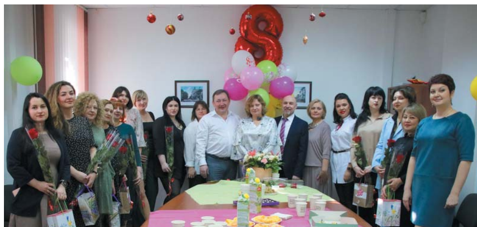
Управление корпоративной защиты