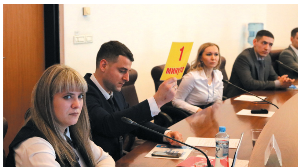
За соблюдением регламента строго следили