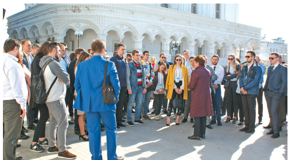
Экскурсия по достопримечательностям Астрахани