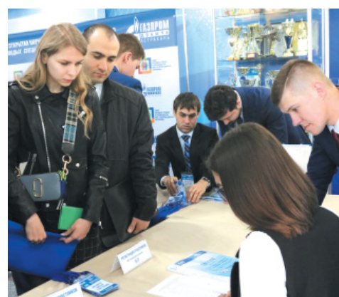
Регистрация участников конференции

Быть принимающей стороной такого масштабного мероприятия всегда ответственно, ведь на пять дней Общество «Газпром добыча Астрахань» превратилось в большую мультидисциплинарную среду для ежедневного интерактивного обще-