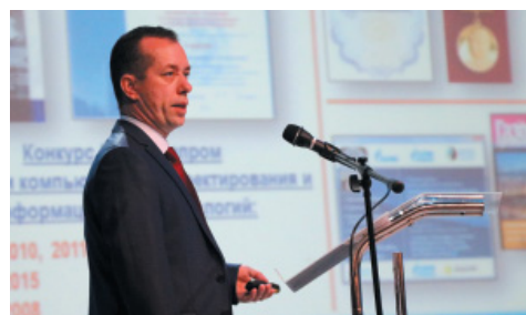
Работа пленарного заседания