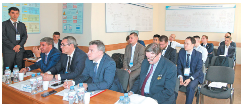
Конкурсную комиссию заинтересовали доклады по промышленной безопасности