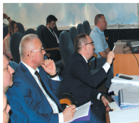
От жюри – профессиональные вопросы, от докладчика – компетентные ответы