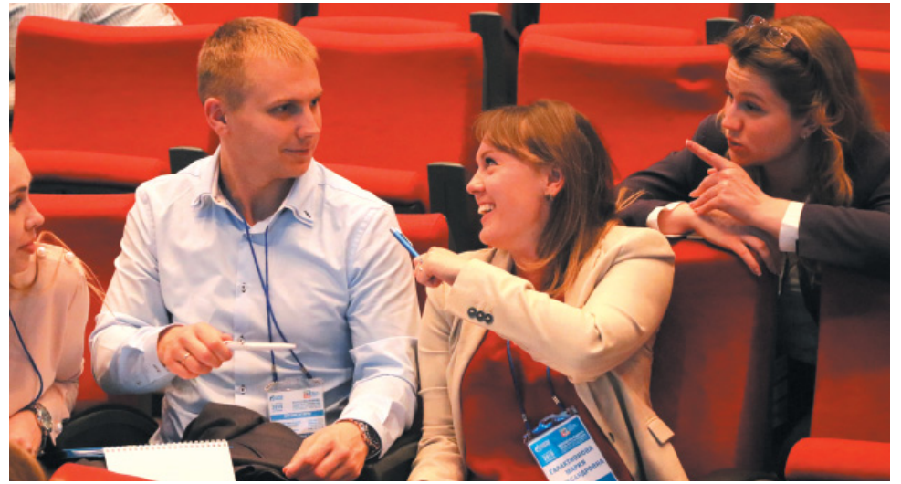
Дискуссия на практическом занятии в формате «Soft Skills Training»

– В первый день у нас прошёл интересный тренинг, также нам представили содержательный доклад о том, как делать яркие, интересные презентации. Считаю, что это очень полезная информация. На всех научных конференциях в дочерних обществах «Газпрома», где я бывал прежде, обсуждались лишь темы, касающиеся непосредственно нефтегазовой отрасли, и подобных докладов не хватало. Отмечу прекрасную организацию мероприятия. Очень приятно было то, что нам оказывали большое внимание буквально с первых минут нашего появления на астраханской земле. Здесь прекрасная атмосфера, есть возможность плодотворно пообщаться с коллегами из других дочерних обществ.