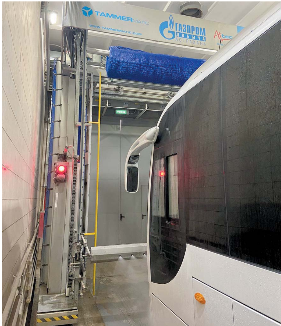
Работа автомойки производственного комплекса № 2

Одним из позитивных факторов деятельности группы, безусловно, является то, что вопросы, которые волнуют коллектив, не делятся на значительные и второстепенные. Каждой проблеме уделяется должное внимание, проводится анализ ситуации и в возможно короткие сроки принимается решение. Например, сотрудники автоколонны № 7, работающие по графику «день, ночь, два выходных», предложили перевести их на график «два в день, два в ночь, четыре выходных». Обращение рассматривалось на совещании у руководства УТТИСТ. С 1 января 2023