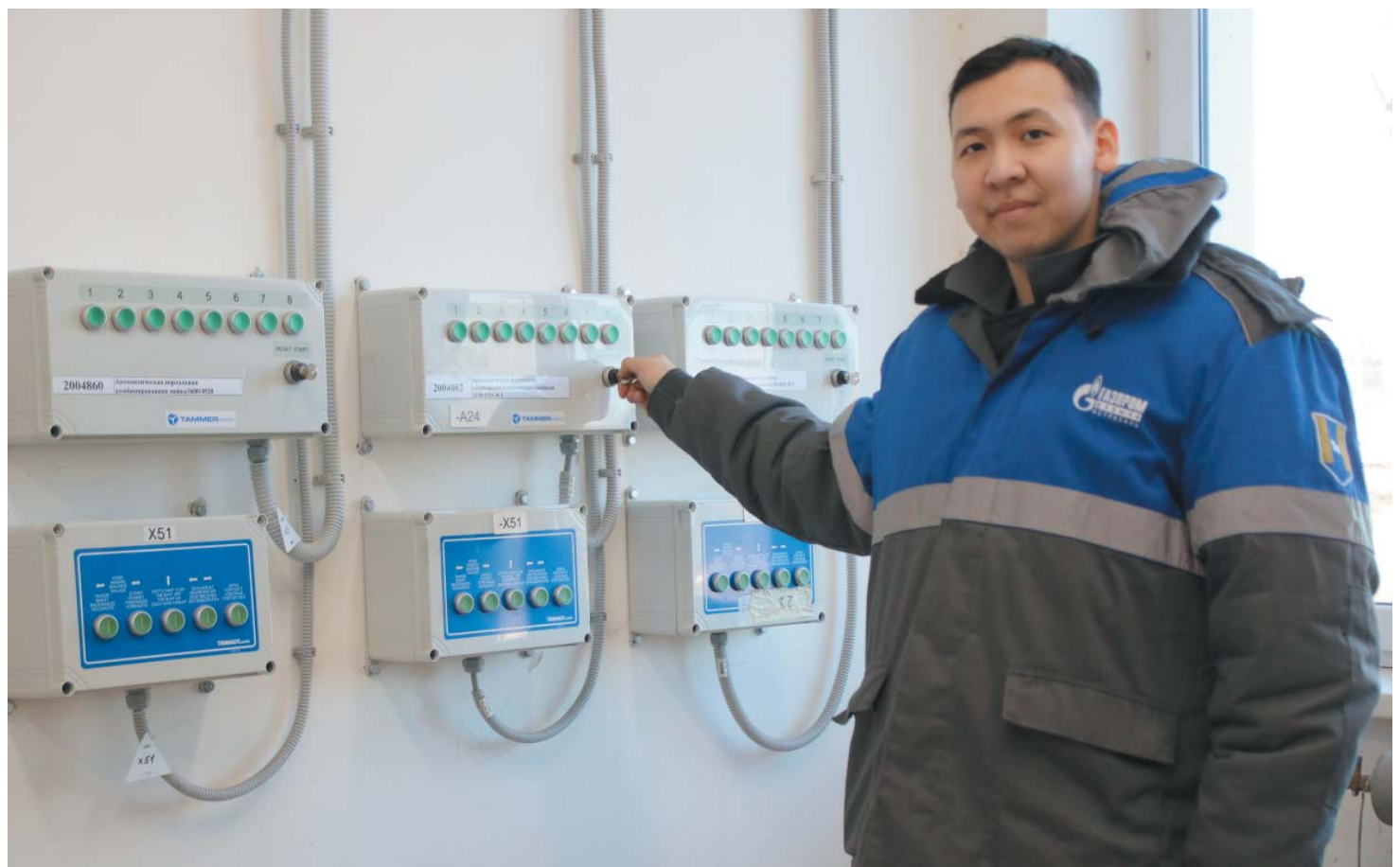
На новой автомойке все процессы полностью автоматизированы