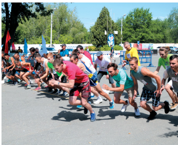
Старт самого престижного забега – среди мужчин 18-39 лет