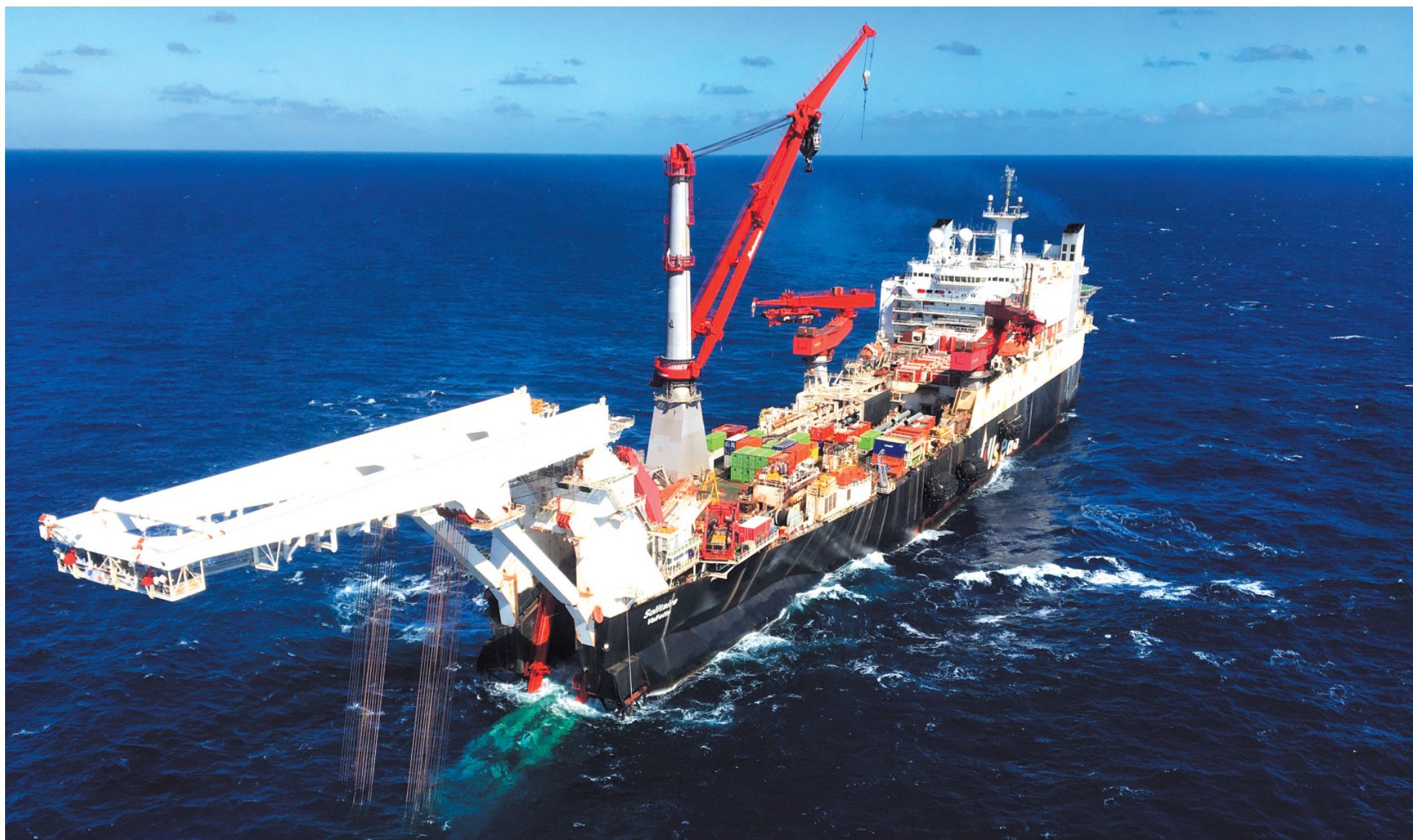
Судно Solitaire: укладка газопровода «Северный поток-2». Новый газопровод удвоит мощности эффективно работающего и востребованного газопровода «Северный поток».

ЭНЕРГИЯ ВЕЛИКОЙ ПОБЕДЫ Название нашего города в годы войны не звучало в сводках Совинформбюро. Нас считали и сегодня считают глубоким тылом, не знавшим бомбардировок стр. 7