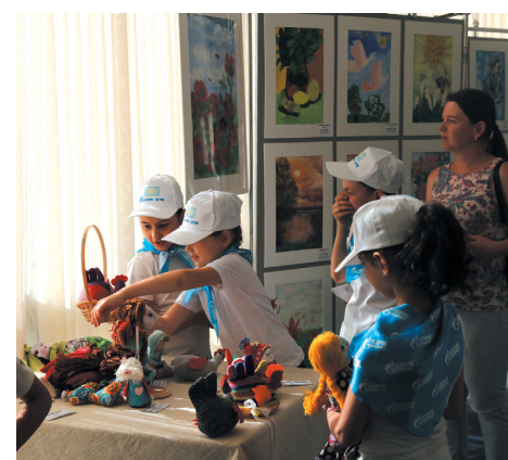
Забавные игрушки воспитанников «Мозаики»