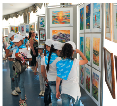
Выставка лучших работ «Акварели»