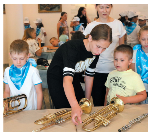
«Страна музыкальных инструментов»