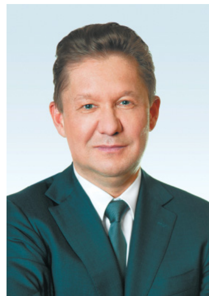
Председатель Правления ПАО «Газпром» Алексей Миллер

личен до 68,6 %. Газификация – это рост качества жизни населения, улучшение экологической обстановки и мощный стимул для развития промышленного производства.