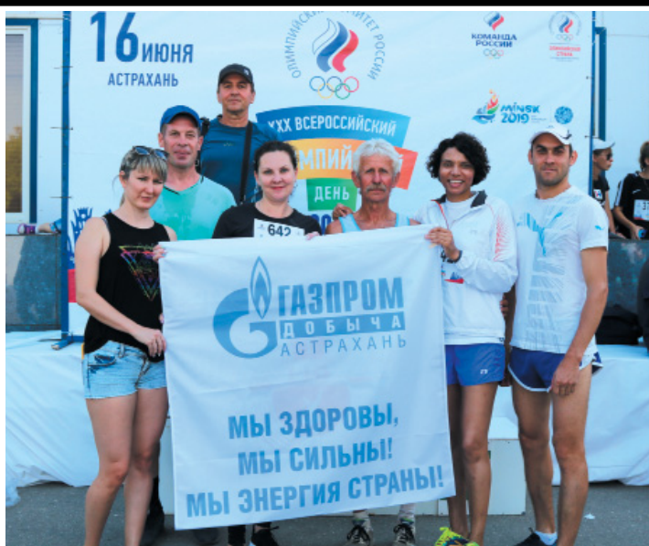
Работники и ветераны ООО «Газпром добыча Астрахань» перед началом соревнований