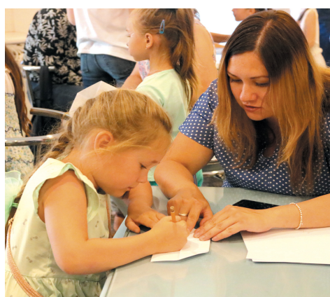
Мастер-класс по оригами