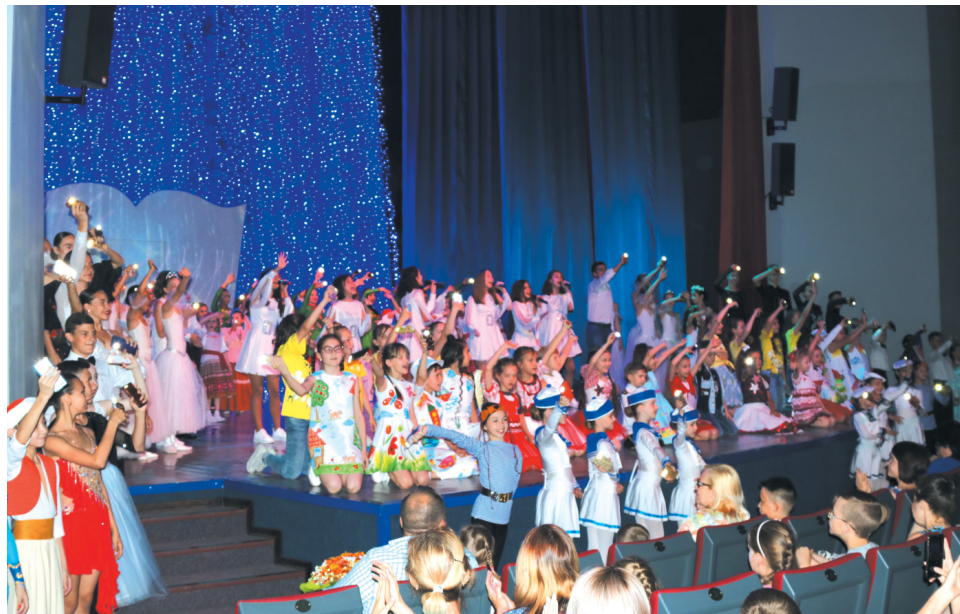
В отчётном концерте приняли участие представители девяти творческих студий Культурно-спортивного центра Общества

В пятницу, 14 июня, в театральной части административного центра газовиков состоялась развлекательная программа Культурно-спортивного центра ООО «Газпром добыча Астрахань» «Лето в городе». Помимо большого праздничного концерта, в программу вечера вошла интерактивная программа «Путешествие в страну музыкальных инструментов», выставка картин и мягких игрушек, мастер-класс по оригами, викторина и аквагрим для детей.