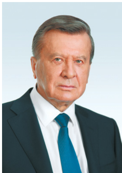
Председатель Совета директоров ПАО «Газпром» Виктор Зубков

вершена, не произошло никаких нештатных ситуаций, сохранена рабочая атмосфера в коллективах. При этом выполнены все плановые показатели: в газотранспортную систему России поставлено более 6 млрд куб. м. газа, обеспечена добыча более 11 млрд куб. м. газа сепарации и око-