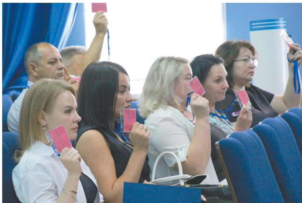
Участие во внеочередной отчётно-выборной конференции ОППО «Газпром добыча Астрахань профсоюз» приняли 52 члена профсоюза

Реализация молодёжной политики – одно из приоритетных направлений деятельности ОППО. Как отметил докладчик, при участии профсоюза в ООО «Газпром добыча Астрахань» созданы 10 молодёжных инициативных групп в структурных подразделениях, которые принимают активное участие в деятельности предприятия