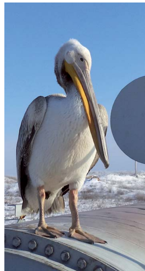
Номинация «Экология производства». «Бр-р-р, холодно!...», А.Г. Голубович, ГПУ, 1 место