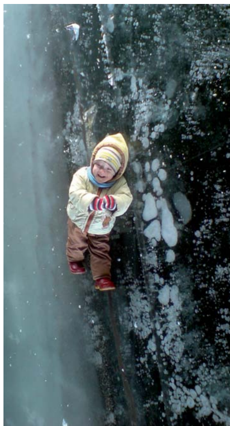
Номинация «Дети и природа». «Прогулка в стратосфере», М.А. Чернов, АГПЗ, 1 место