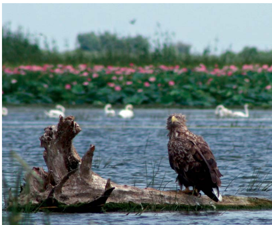
Номинация «Красота родного края». «Раскаты», В.Е. Афанасьев, ИТЦ, 1 место