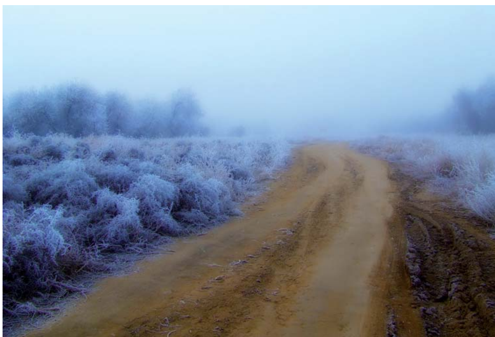
Номинация «Времена года». «Дорога», С.С. Марисюк, УЭЗиС, 1 место