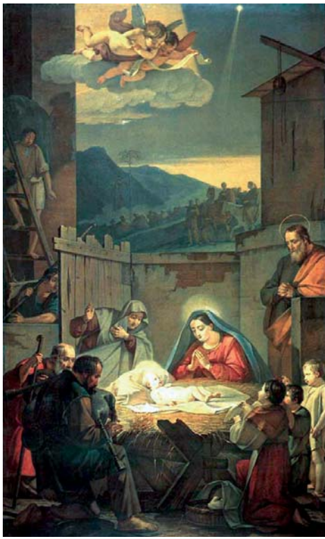
Василий Шебуев. Рождество Христово (Поклонение пастухов). 1847 г.

Для наших современников Иисус Христос – не сказочный персонаж, а вполне реальная историческая личность. Многие события его жизни находят подтверждение в источниках, но его биографы – авторы Евангелий – не сильно заботились о точности дат. Поэтому современным учё-