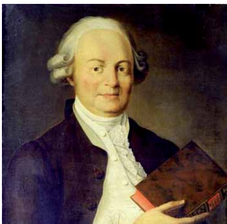
ТРЕДИАКОВСКИЙ ВАСИЛИЙ (1703-1768)

В Год литературы сама душа называет имена прозаиков и поэтов, которые «глаголом жгли сердца людей». Так давайте же назовём имена наших земляков из этой славной плеяды, чьё творчество имело и продолжает иметь отклик далеко за пределами Астраханского края.