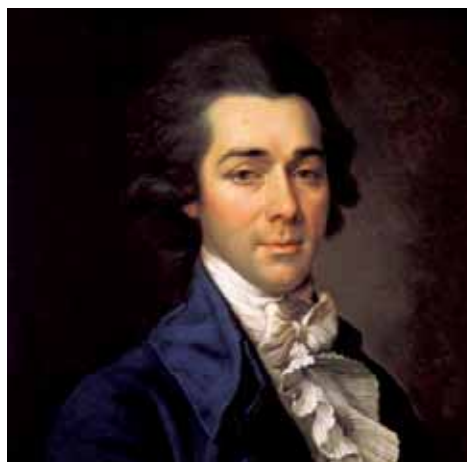
ХЕМНИЦЕР ИВАН (1745-1784)

Родился в Астрахани. Сыграл важную роль в становлении новой русской литературы и русского литературного языка. В 1735 г. он опубликовал труд «Новый и краткий способ к сложению российских стихов с определениями до сего надлежащих знаний», который положил начало реформе силлабической стихотворной системы. Эта реформа определила дальнейшее развитие русской поэзии.