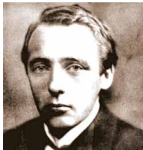
ХЛЕБНИКОВ ВЕЛИМИР (1885-1922)

Родился в Енотаевской крепости. Автор 91 басни. Около трети басен Хемницера – переводы, остальные 2/3 – оригинальные. Хемницер стал своеобразным творческим предшественником Ивана Крылова. Хемницер дал Крылову не только вполне готовую форму, но и тон, даже отчасти содержание, которому более талантливый преемник сумел придать новую силу и яркость.