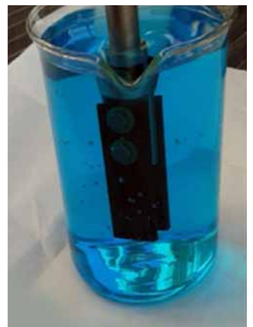
Экспозиция образцов в медном купоросе

Вне всякого сомнения, комплекс проведённых исследовательских работ помимо того, что принесёт реальную эконо-