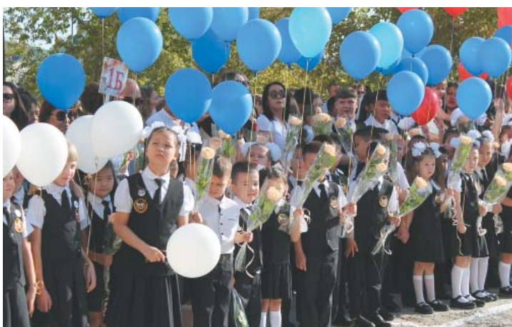
День знаний в Красноярской СОШ № 2