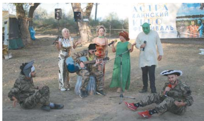
Другие участники исполняли песни под гитару