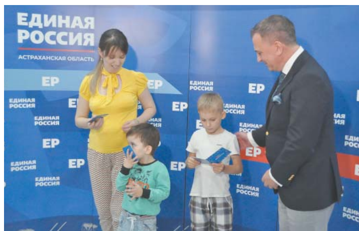
Андрей Мельниченко вручает подарочные карты астраханцам