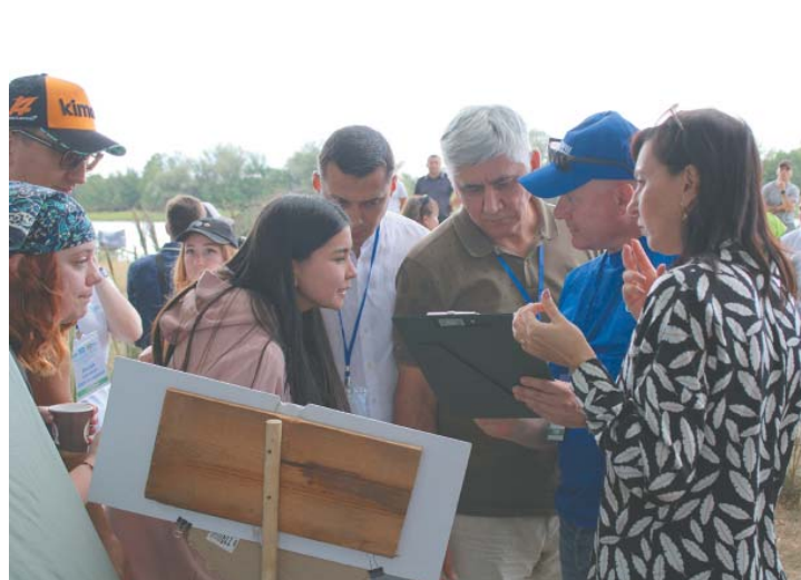
Обсуждение оценок членами жюри проходило в рабочем режиме