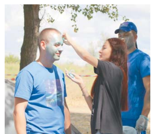
Хороший грим – половина успеха для киношного дерева