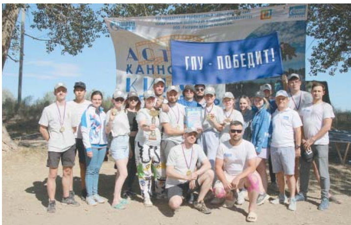
1 место – Газпромное управление ООО «Газпром добыча Астрахань»