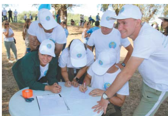
Новички турслёта – молодые специалисты Красноярского района