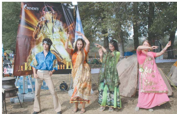
Одни участники встречали комиссию зажигательными танцами