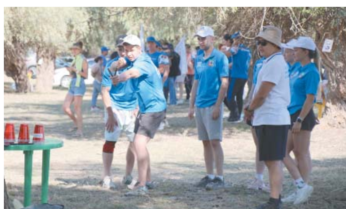
Спортивно-туристический квест выявил самых быстрых, ловких, смелых и метких