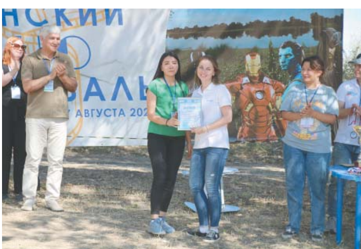
Лучший наставник – представитель команды СК «СОГАЗ»