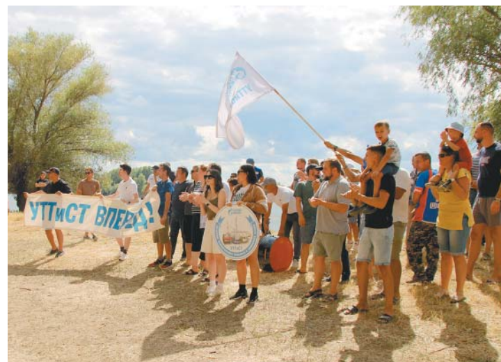
Болельщики УТТСТ – лучшие на турслёте