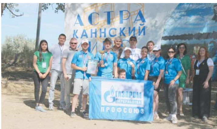
2 место – АГПЗ филиала ООО «Газпром переработка»