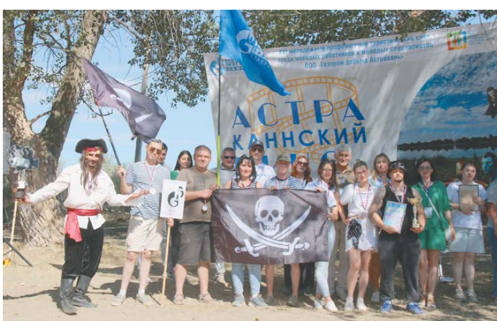
3 место – Астраханский филиал ООО «Газпром трансгаз Ставрополь»