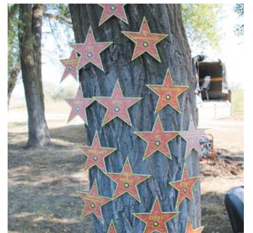
Звёздное дерево туристического слёта