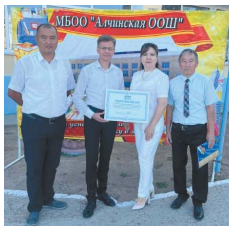
Газодобытчики вручили руководителям школ сертификаты на подарочные карты первоклассникам