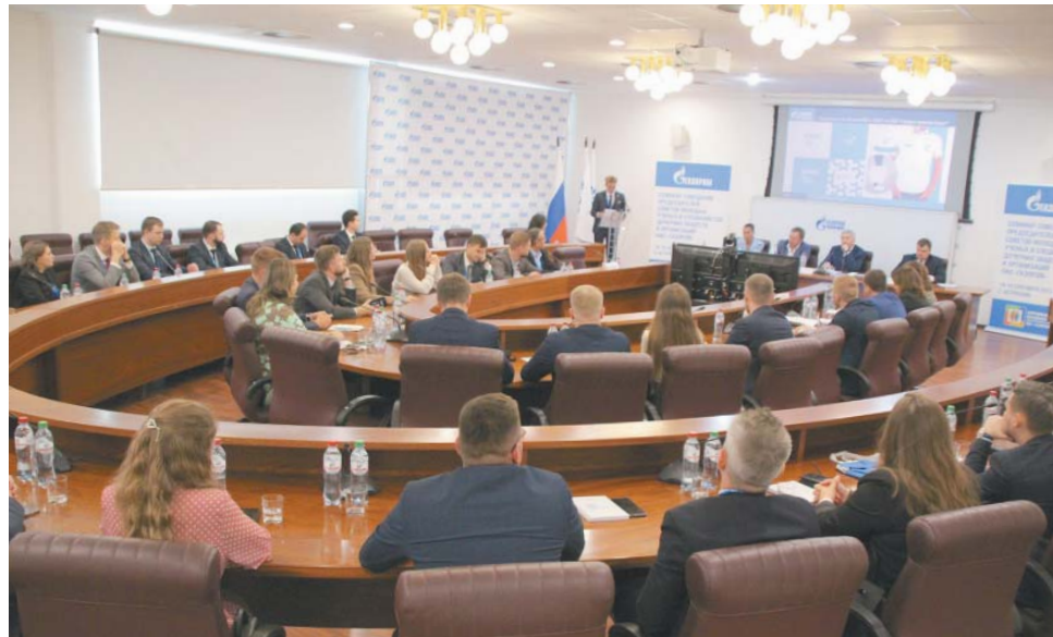
Круглый стол участников семинара-совещания председателей СМУС

Не менее увлекательна была деловая игра, нацеленная на правильное постро-