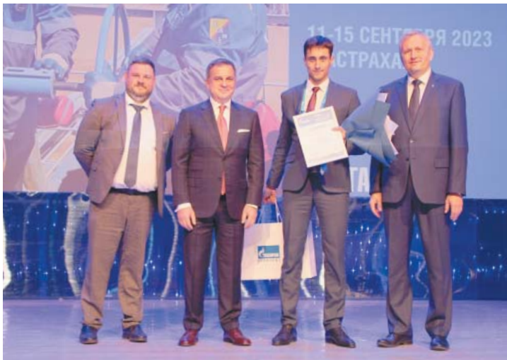
По окончании трёхдневных испытаний конкурсное жюри назвало лучших молодых работников Группы «Газпром»