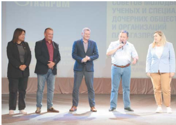
Закрытие Семинара-совещания председателей Советов молодых учёных и специалистов дочерних обществ и организаций ПАО «Газпром»

специалистов новые идеи, новые мысли, новые знания и, конечно же, контакты своих новых друзей.