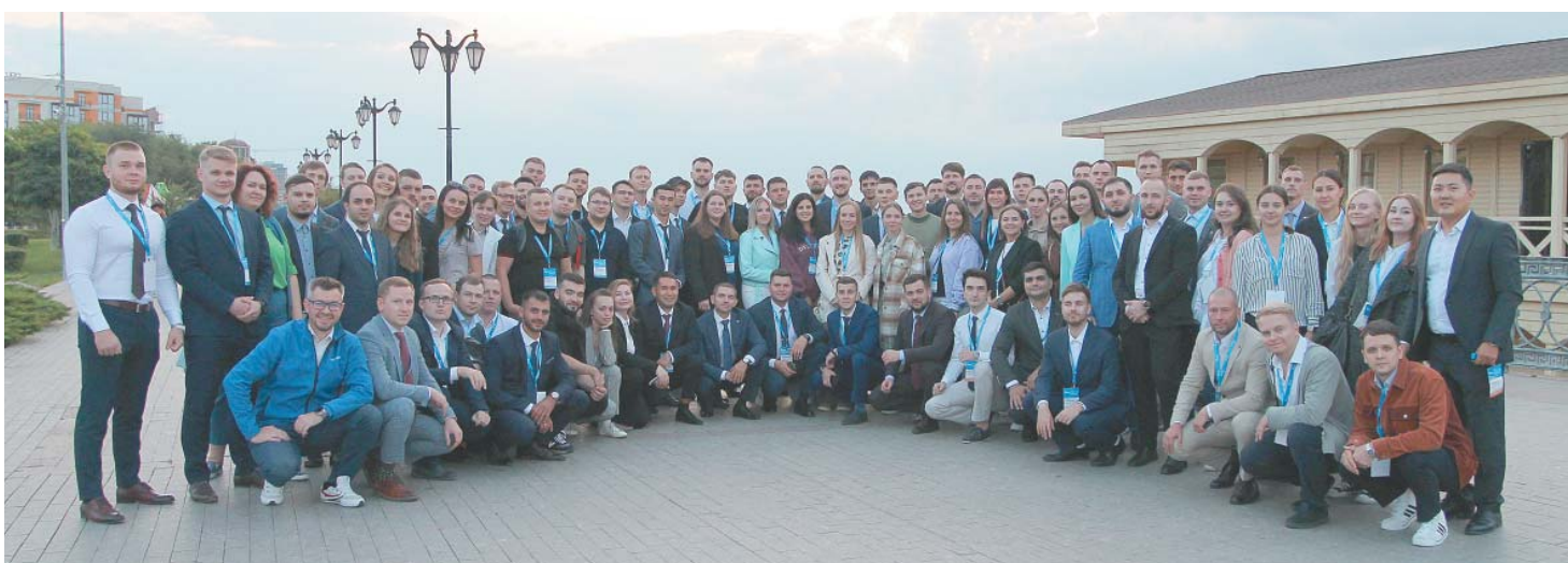
В ходе экскурсий гости посетили объекты АГКМ, а также достопримечательности Астрахани