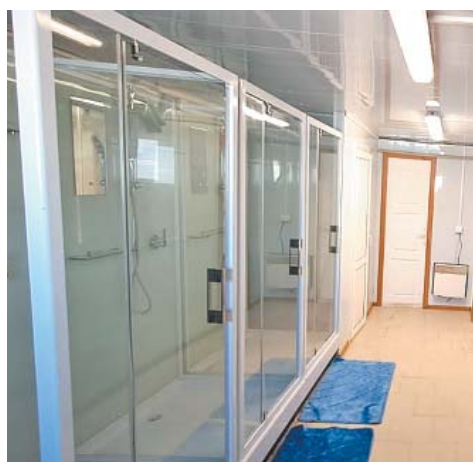
Управление материально-технического снабжения и комплектации