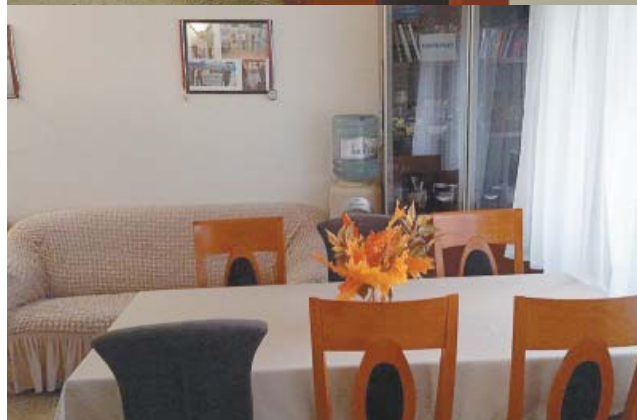
Управление по эксплуатации зданий и сооружений