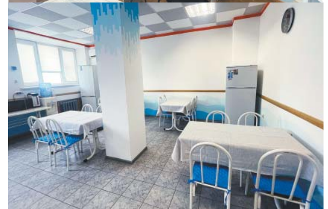
Отряд ведомственной пожарной охраны