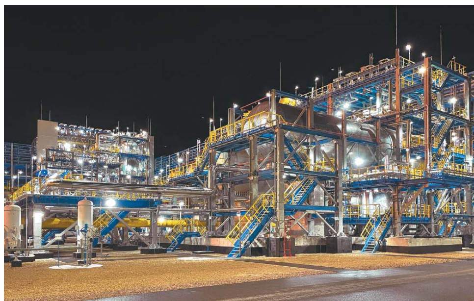
Комплекс по производству, хранению и отгрузке сжиженного природного газа (КСПГ) в районе КС «Портовая» в Ленинградской области

«Газпром» проводит последовательную работу с российскими предприятиями по