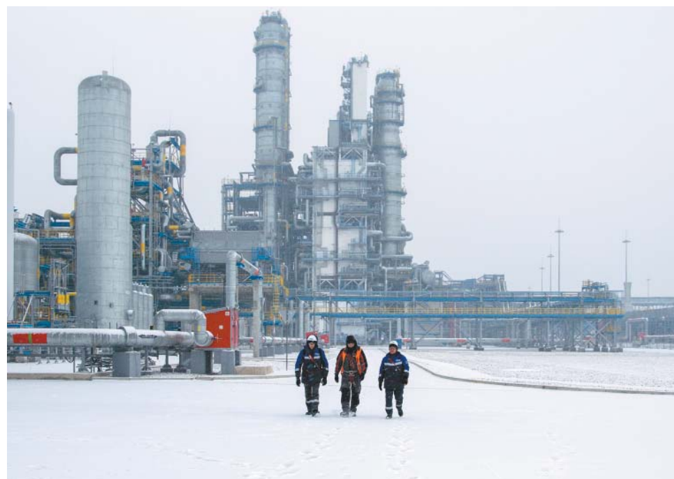
Амурский газоперерабатывающий завод