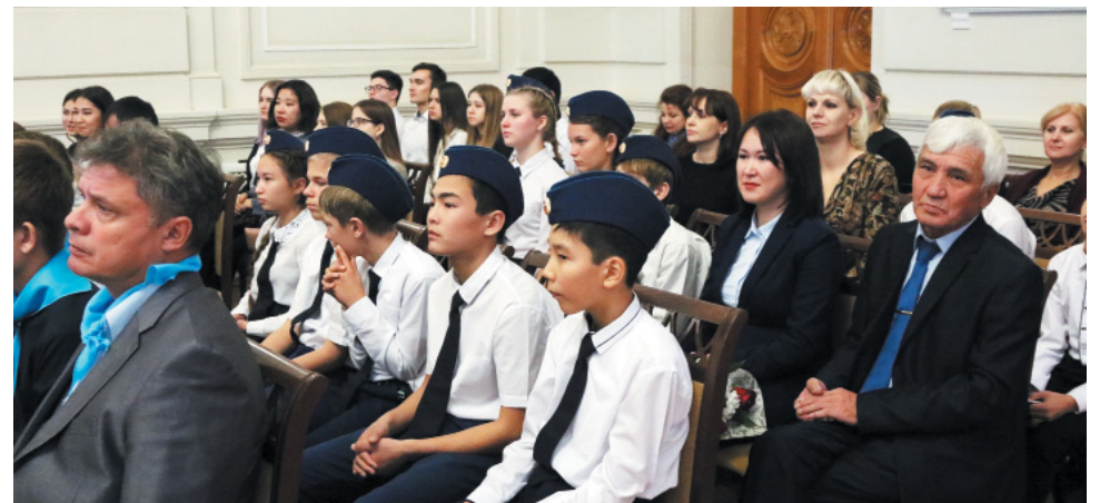
На торжественную церемонию были приглашены участники «Голубых патрулей» и их наставники