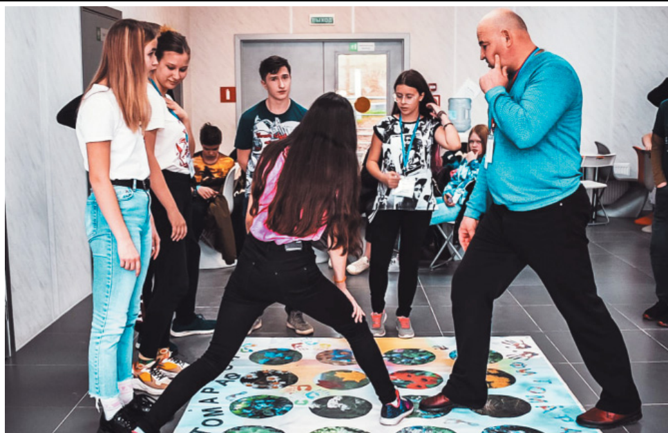
Участие в квесте «Фитомарафон»