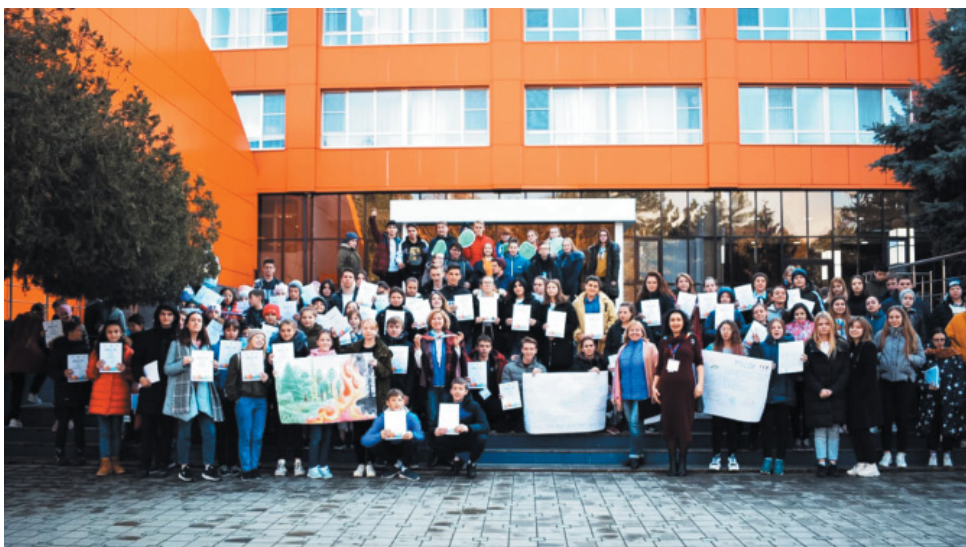
Общее фото участников смены