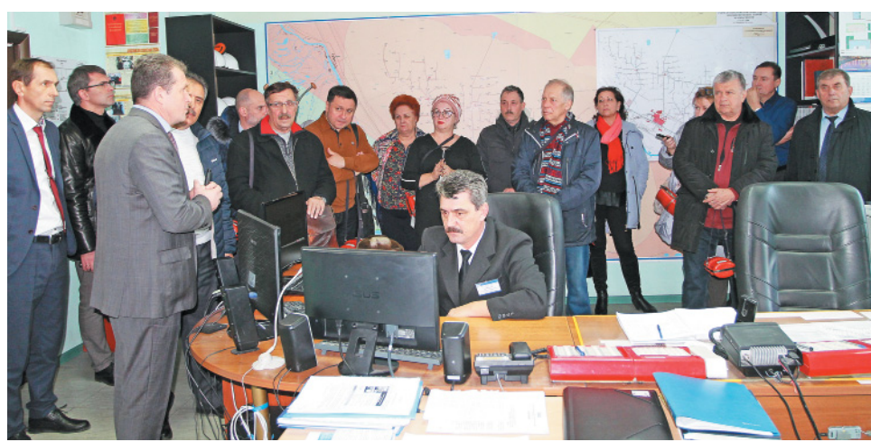
Делегация на посту газовой безопасности

5 декабря выездное расширенное совещание комиссии по вопросам экологии, природопользования и охране окружающей среды Общественной палаты Астраханской области состоялось на производственных объектах ООО «Газпром добыча Астрахань». О целях и задачах этого мероприятия корпоративная газета «Пульс Аксарайска» писала в статье «Новая встреча» в предыдущем №49 от 6 декабря 2019 года. О подробностях работы комиссии и выводах, которые сделали представители Общественной палаты, читайте прямо сейчас.