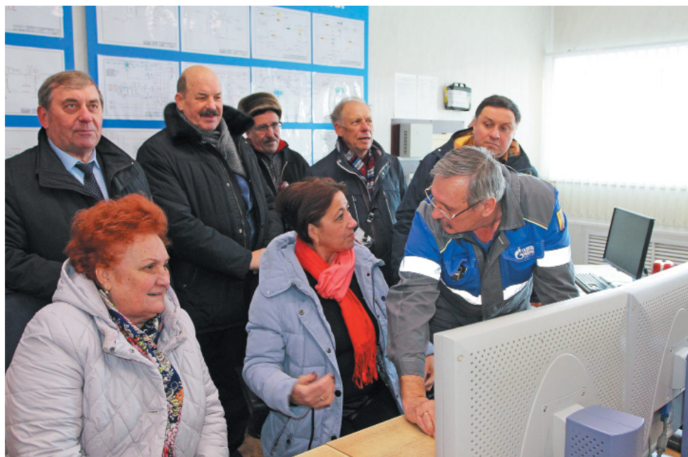
Члены Общественной палаты в операторной УППГ №2