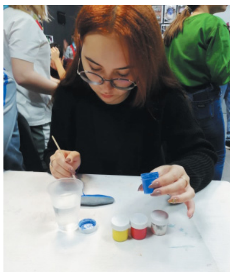
На занятиях по креативному творчеству