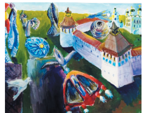
«Астрахань-2099», Святослав Абакумов