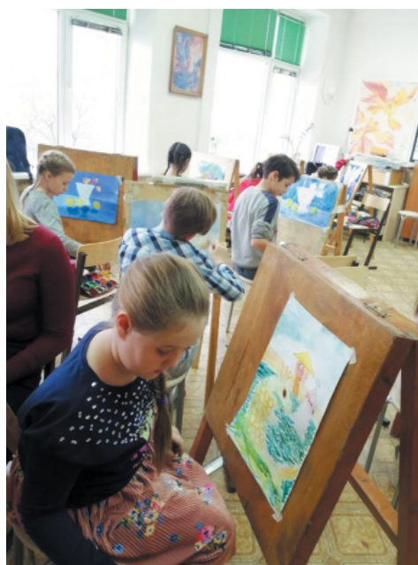
Очный этап конкурса «Ступени мастерства»