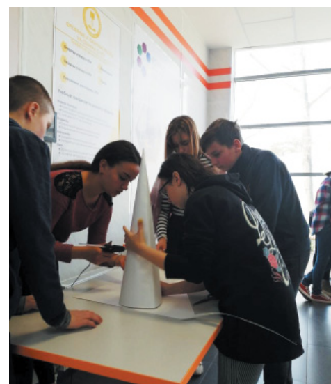
Подготовка конкурсного практического задания