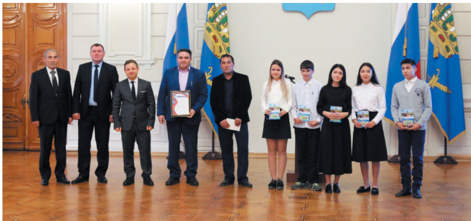
Победитель конкурса — МКОУ «Караулинская ООШ имени Героя Советского Союза К.П. Никонова»