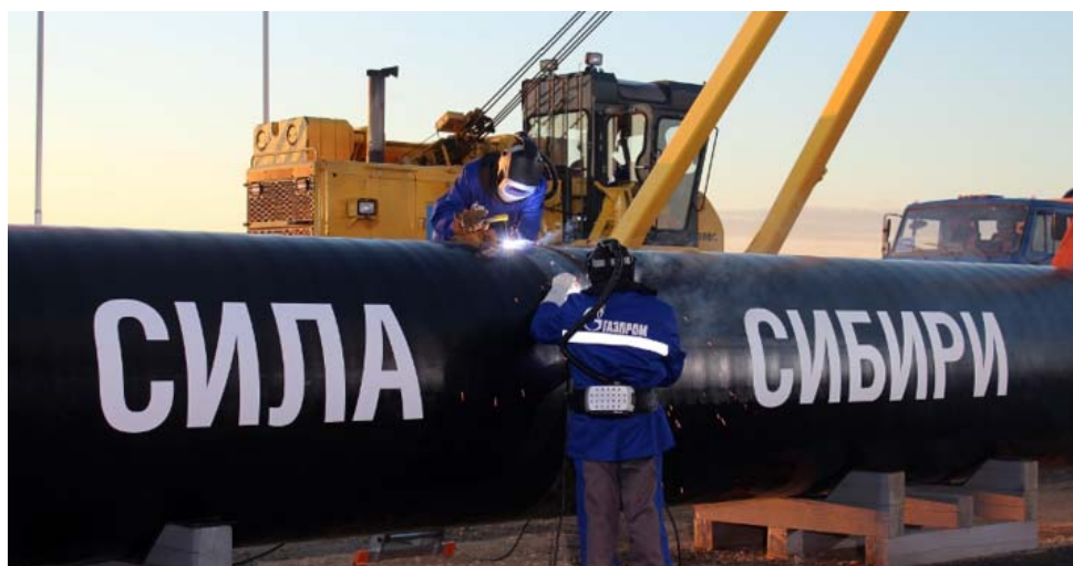
Сварка первого стыка газотранспортной системы «Сила Сибири»