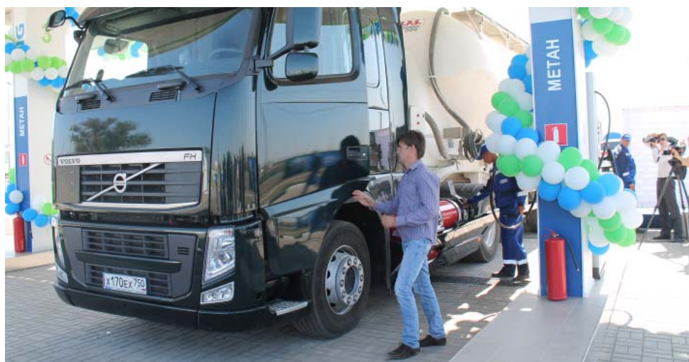
Автомобильная газонаполнительная компрессорная станция в Астрахани