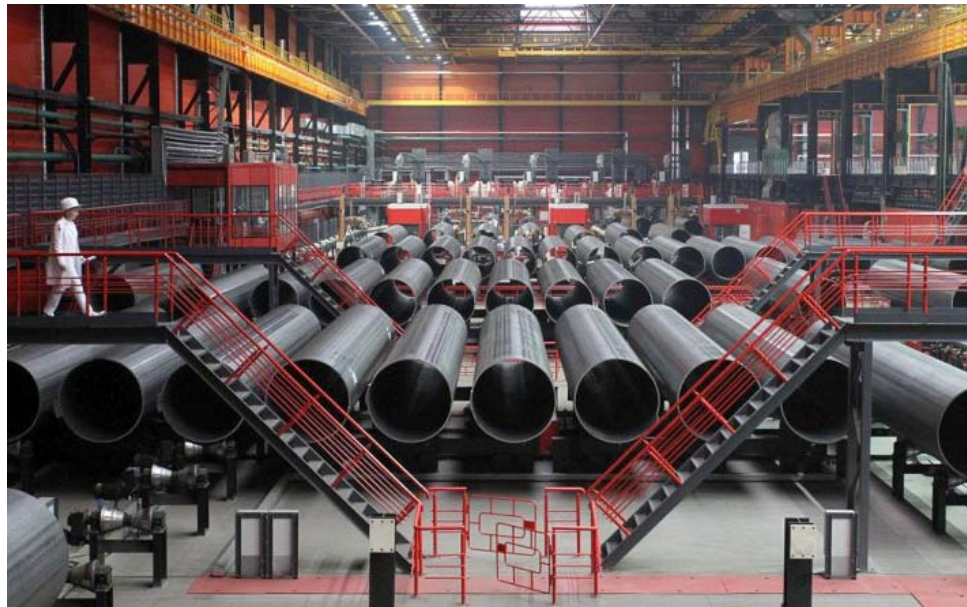
Цех по производству труб большого диаметра Челябинского трубопрокатного завода «Высота 239»