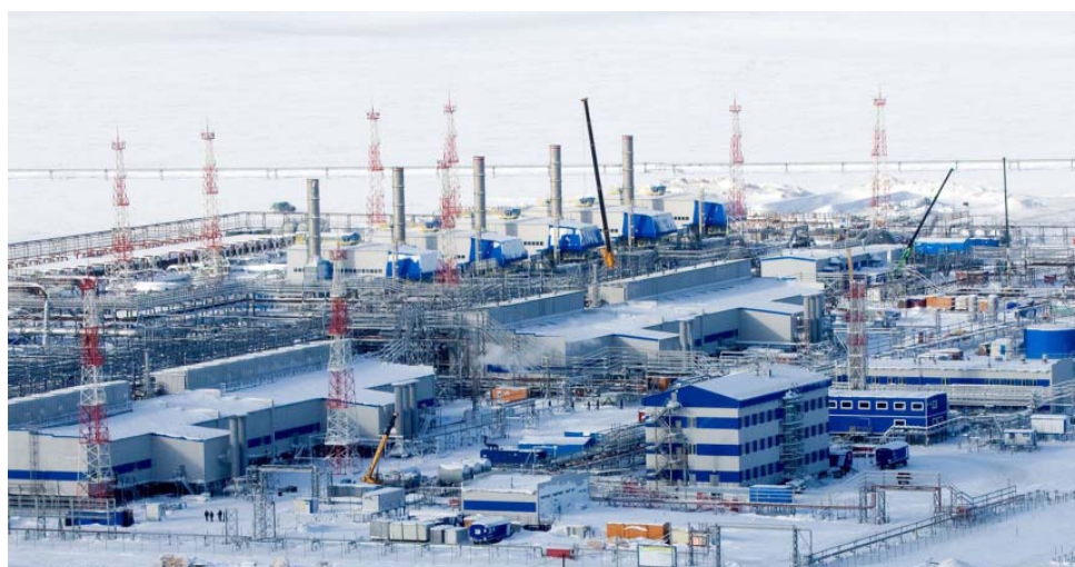
Газовый промысел Бованенковского нефтегазоконденсатного месторождения