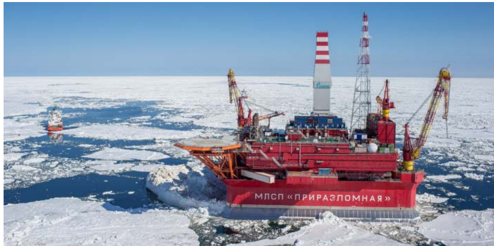
Морская ледостойкая стационарная платформа «Приразломная» на шельфе Печорского моря