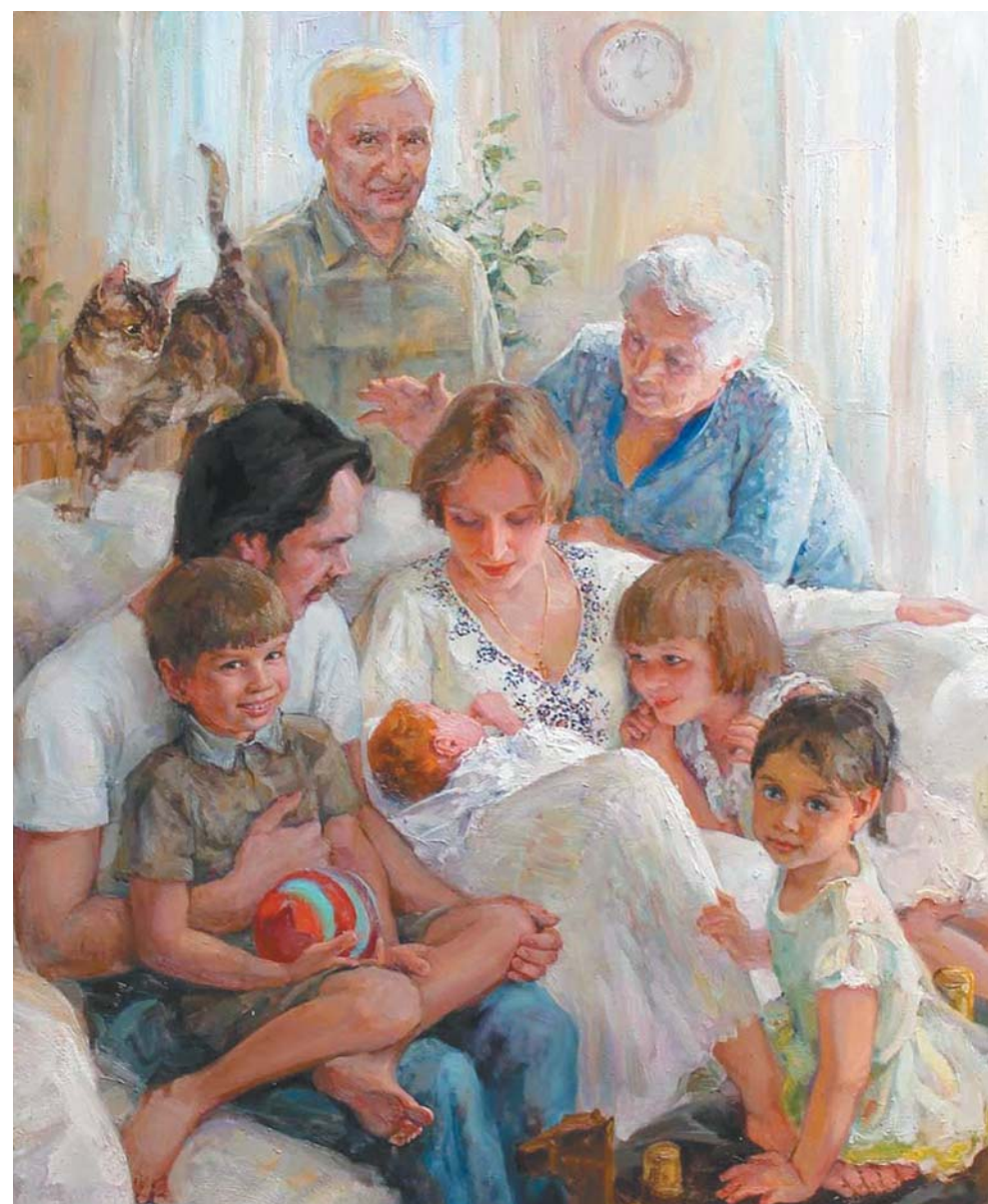
«Семейный портрет. Знакомство», Полина Лучанова