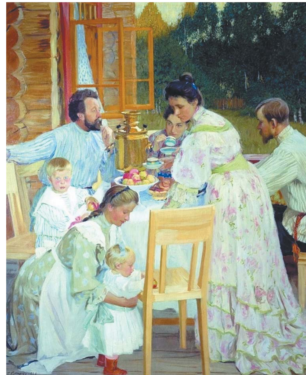
«На террасе», Борис Кустодиев