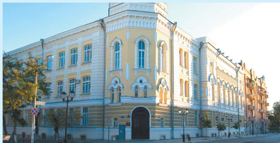
В 2024 году исполняется 55 лет Астраханской государственной консерватории

Календарь знаменательных и памятных дат «Астраханский край: события и даты» – издание, проверенное временем, которое год от года наполняется новой содержательной информацией и приходит к своему читателю благодаря ООО «Газпром добыча Астрахань» и фонду «За достойную жизнь».