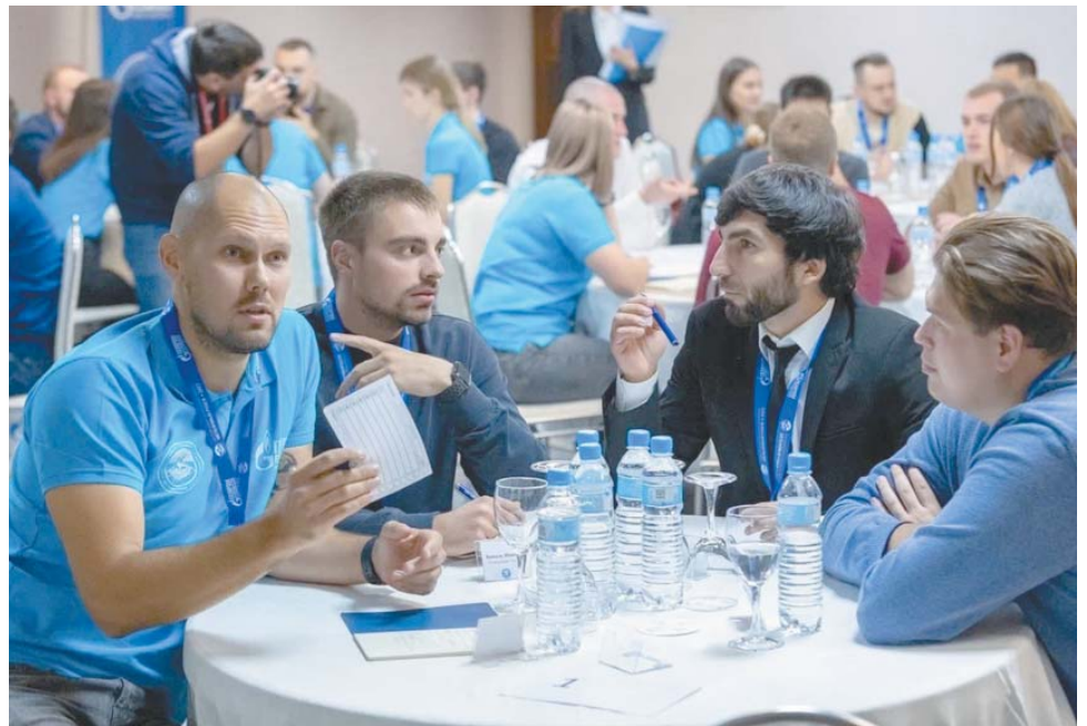
Обсуждение вопросов интеллектуальной игры