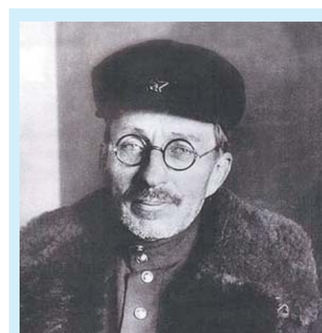
Антон Семёнович Макаренко, педагог и писатель (1888–1939):

По всем вопросам участия в проекте обращайтесь по телефонам редакции: 2-61-49, 2-61-40.