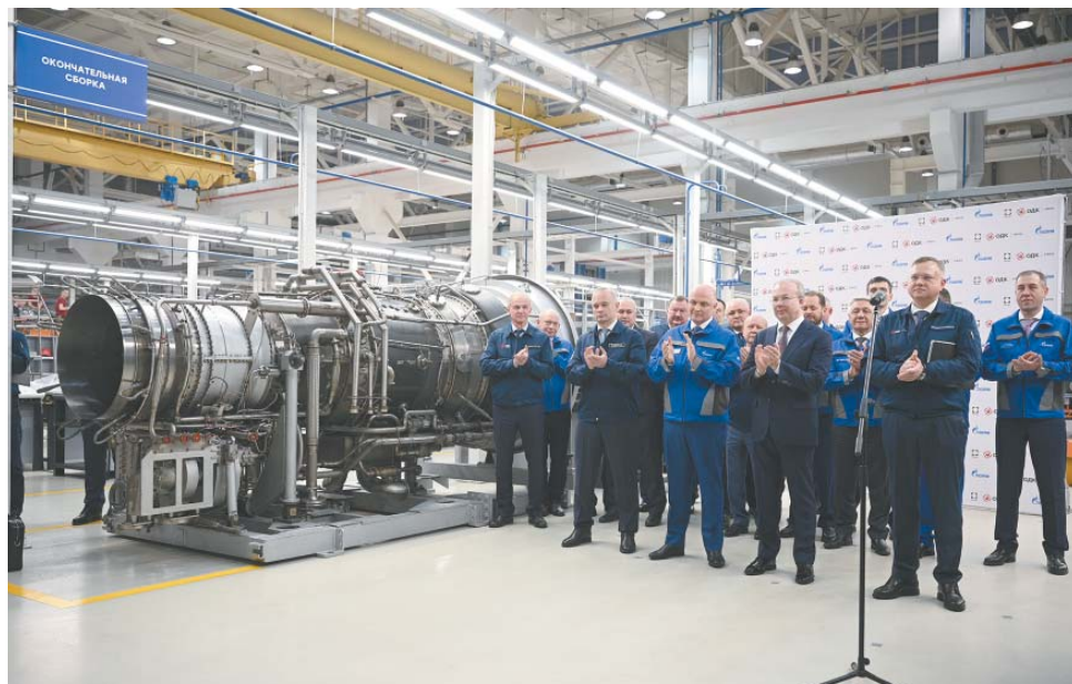
Во время мероприятия