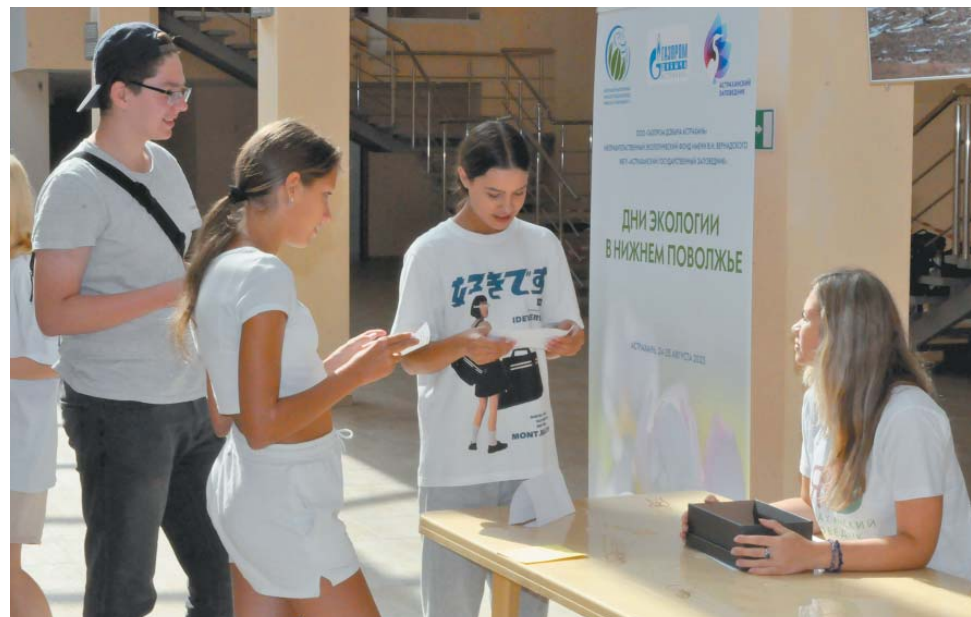
«Дни экологии в Нижнем Поволжье» в ДОЦ имени А.С. Пушкина, 2023 год