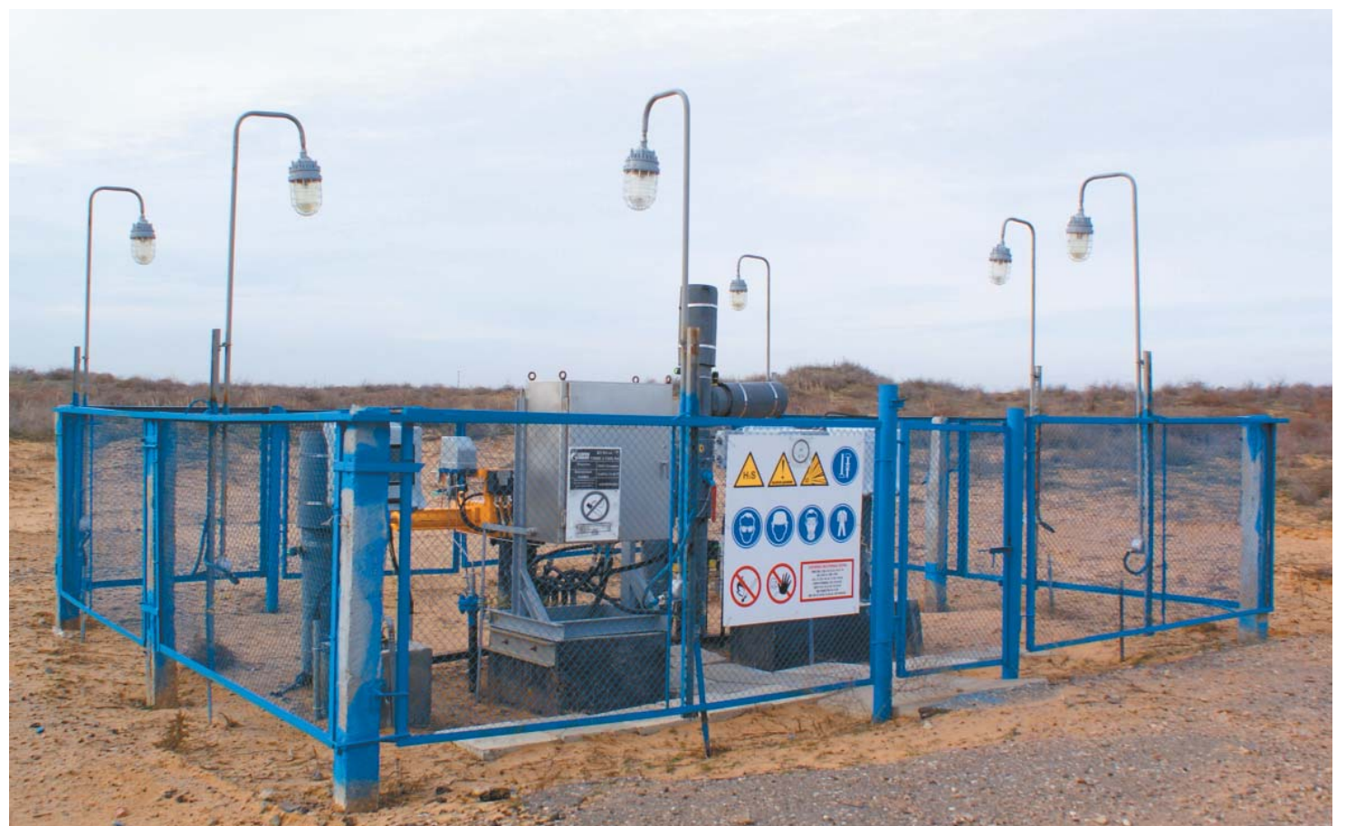
Крановый узел № 3 газоконденсатопровода № 4 после проведённой реконструкции