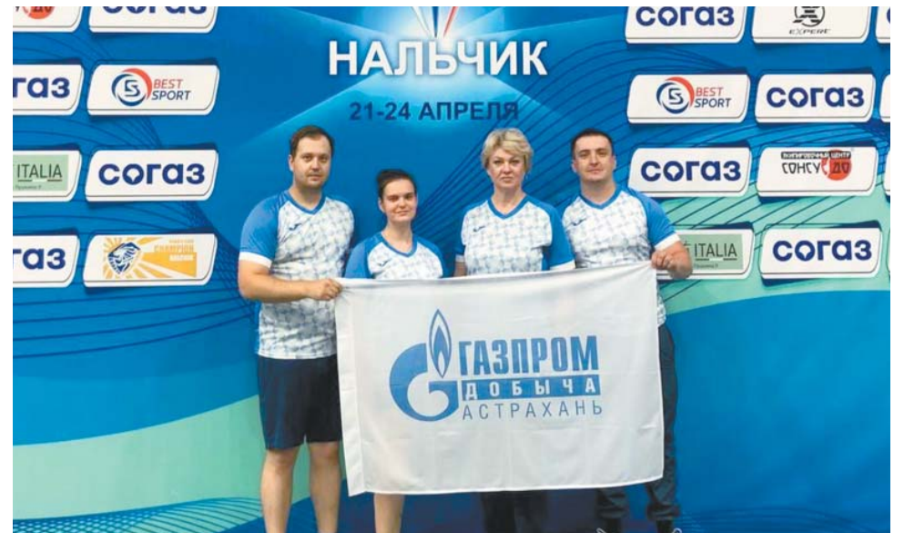
Команды Общества по баскетболу и настольному теннису во время подготовки к Зимней спартакиаде ПАО «Газпром» на турнирах в Краснодаре и Нальчике