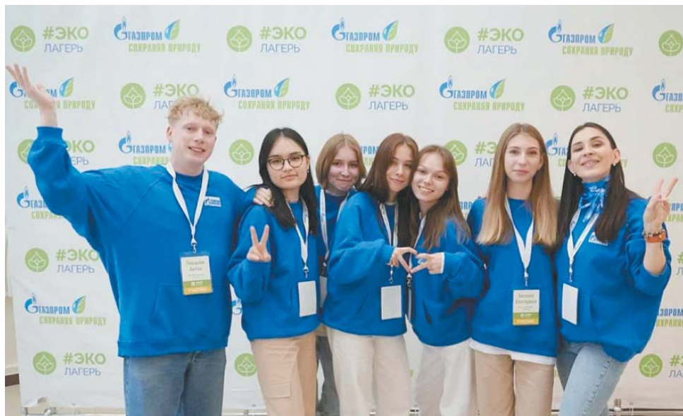
Команда ООО «Газпром добыча Астрахань» – участник Экологического лагеря для детей работников дочерних обществ и организаций ПАО «Газпром», 2023 год

– Важно обучать рациональному использованию природных ресурсов, поскольку это способствует более глубокому пониманию взаимосвязей между человеком и окружающей средой. Содействуя экологическому осознанию, мы развиваем в молодёжи чувство ответственности по отношению к природе. Такое образование направлено на сохранение биоразнообразия, смягчение последствий изменения климата. Это также даёт людям возможность делать осознанный выбор, который минимизирует их воздействие на окружающую среду и способствует более сбалансированному и гармоничному сосуществованию с миром природы.