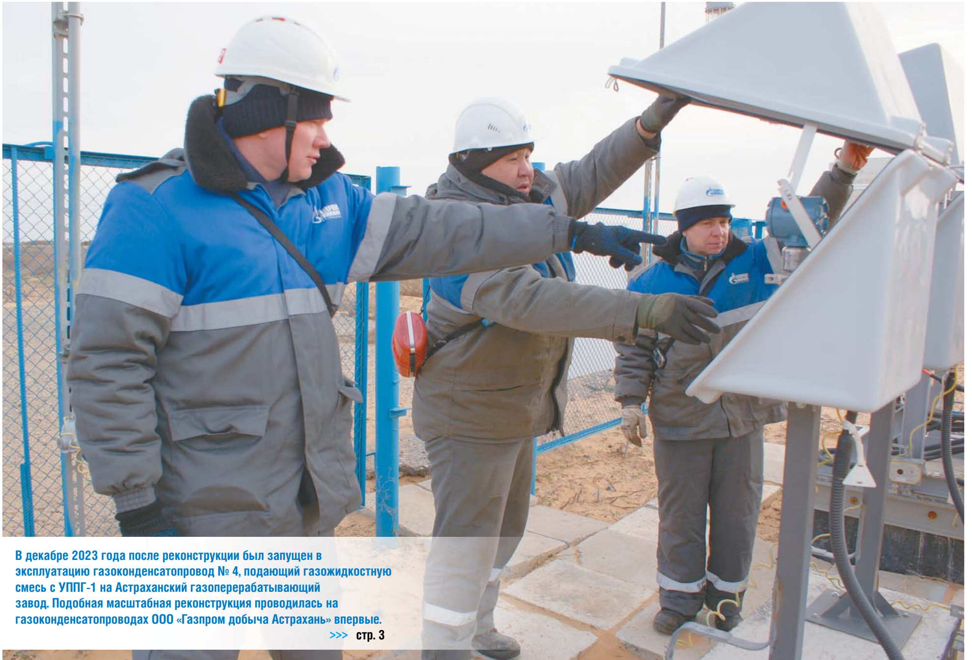
В декабре 2023 года после реконструкции был запущен в эксплуатацию газоконденсатопровод № 4, подающий газожидкостную смесь с УППГ-1 на Астраханский газоперерабатывающий завод. Подобная масштабная реконструкция проводилась на газоконденсатопроводах ООО «Газпром добыча Астрахань» впервые. >>> стр. 3