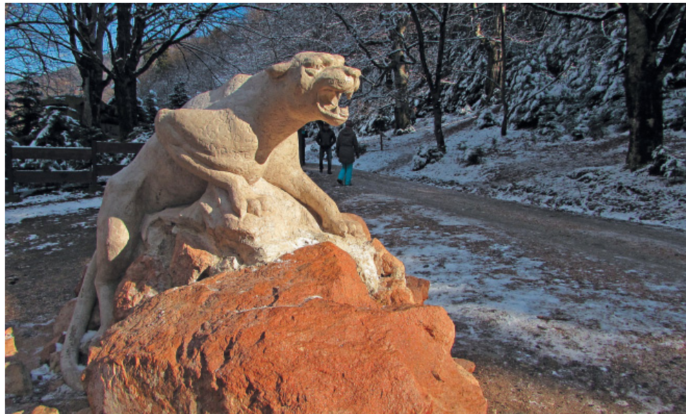
Начало Леопардовой тропы на Гузерипльском кордоне