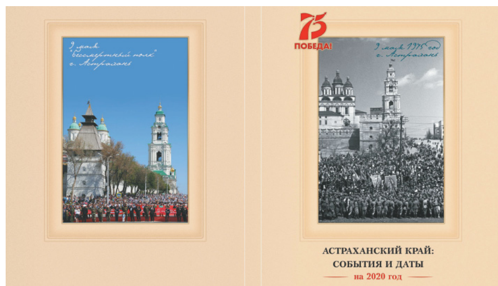
Презентация Календаря знаменательных и памятных дат «Астраханский край: события и даты» на 2020 год