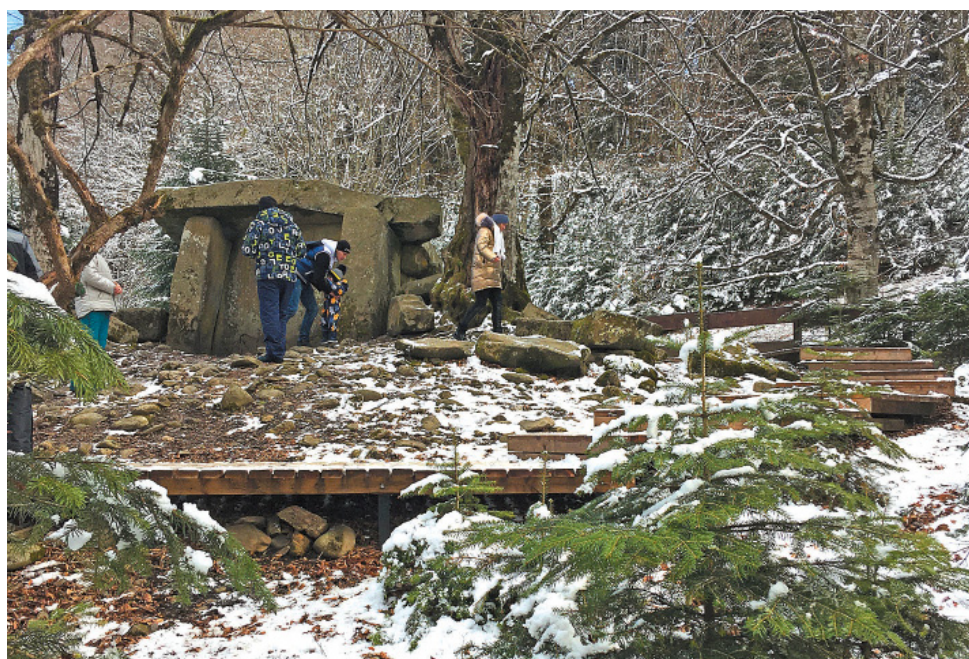
Дольмен на Гузерипльском кордоне Кавказского заповедника