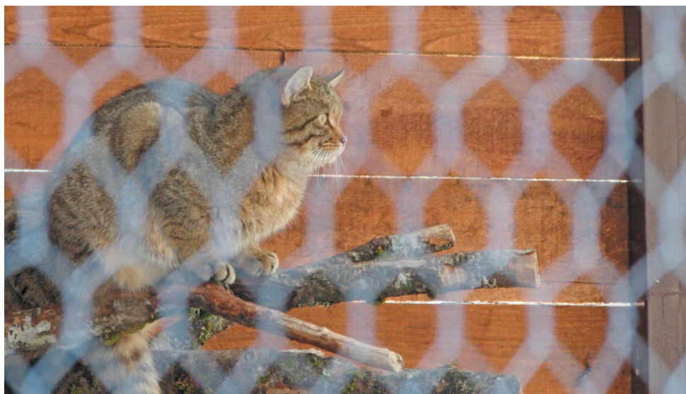
Зооуголок на Гузерипльском кордоне: лесной кот