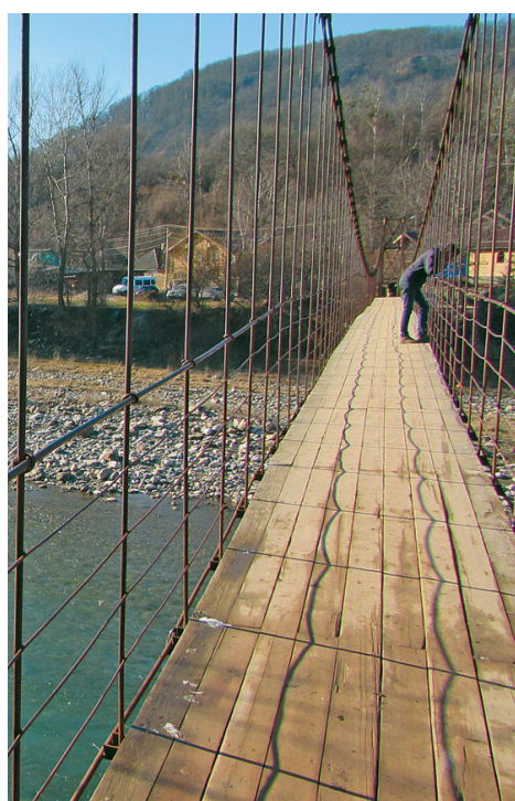
Подвесной мост через реку Белая