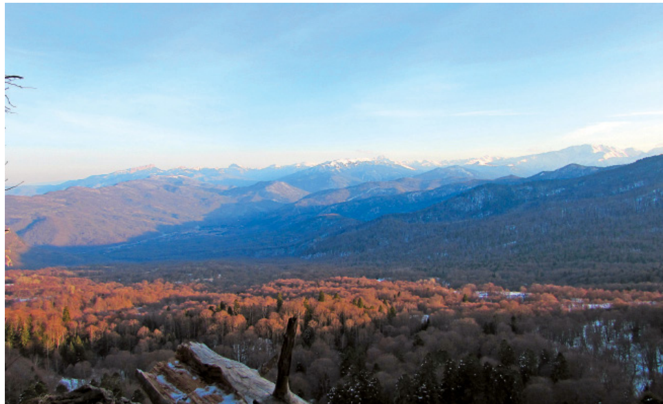
Вид со смотровой площадки Лаго-Наки