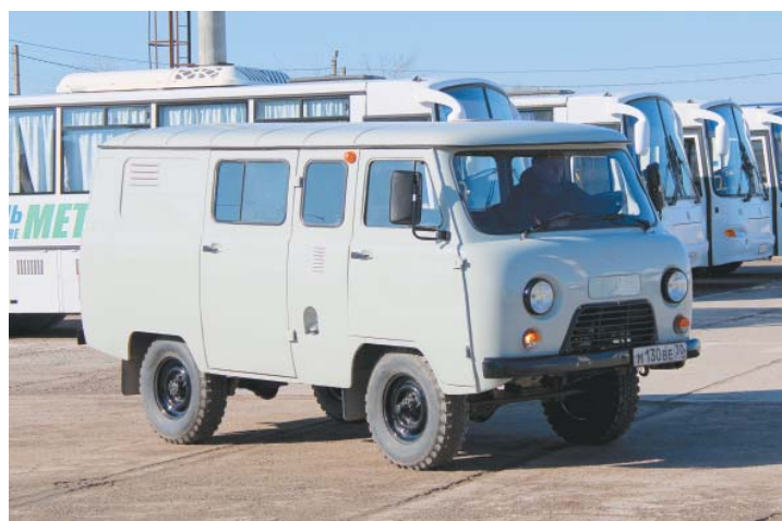
Автомобиль УАЗ-390992 передан для нужд участников специальной военной операции