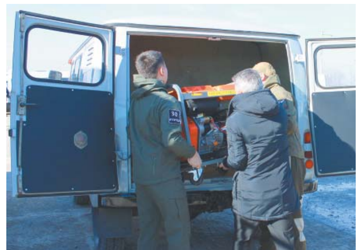
Фонд солидарности «Мы вместе», созданный Объединённой первичной профсоюзной организацией «Газпром добыча Астрахань профсоюз», передал вместе с автомобилем дизельный генератор

Фонд солидарности «Мы вместе» создан и осуществляет свою деятельность на базе Объединённой первичной профсоюзной организации «Газпром добыча Астрахань профсоюз». Его цель – оказание поддержки членам профсоюза – работникам ООО «Газпром добыча Астрахань», призванным на военную службу в связи с проведением специальной военной операции, а также членам их семей.