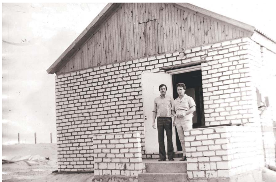
Первое помещение узла связи. 1984 год

Управления связи входили четыре автоматических телефонных станции (АТС) общей ёмкостью 500 номеров, более восьмисот километров кабельных линий связи, более тысячи километров радиорелейных линий.