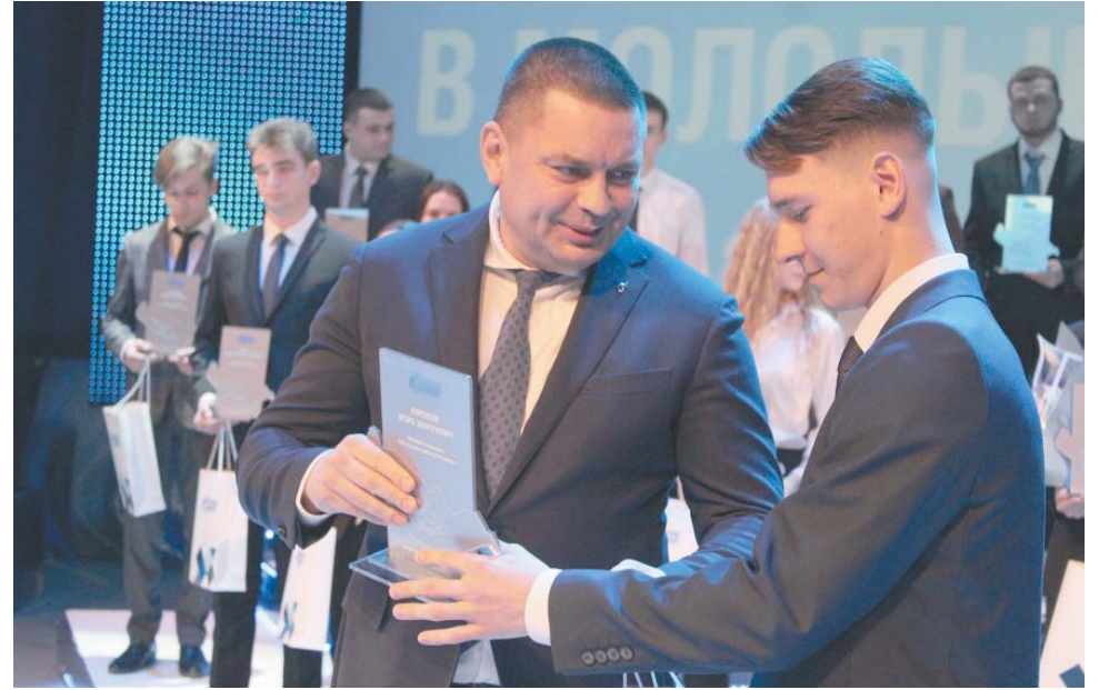
Вручение памятных стел

2024 год в нашей стране объявлен Годом семьи, и сегодняшнее мероприятие будет посвящено этой теме. Наш коллектив – это тоже в некотором роде семья. Большая, дружная трудовая семья астраханских газовиков. В ней есть свои