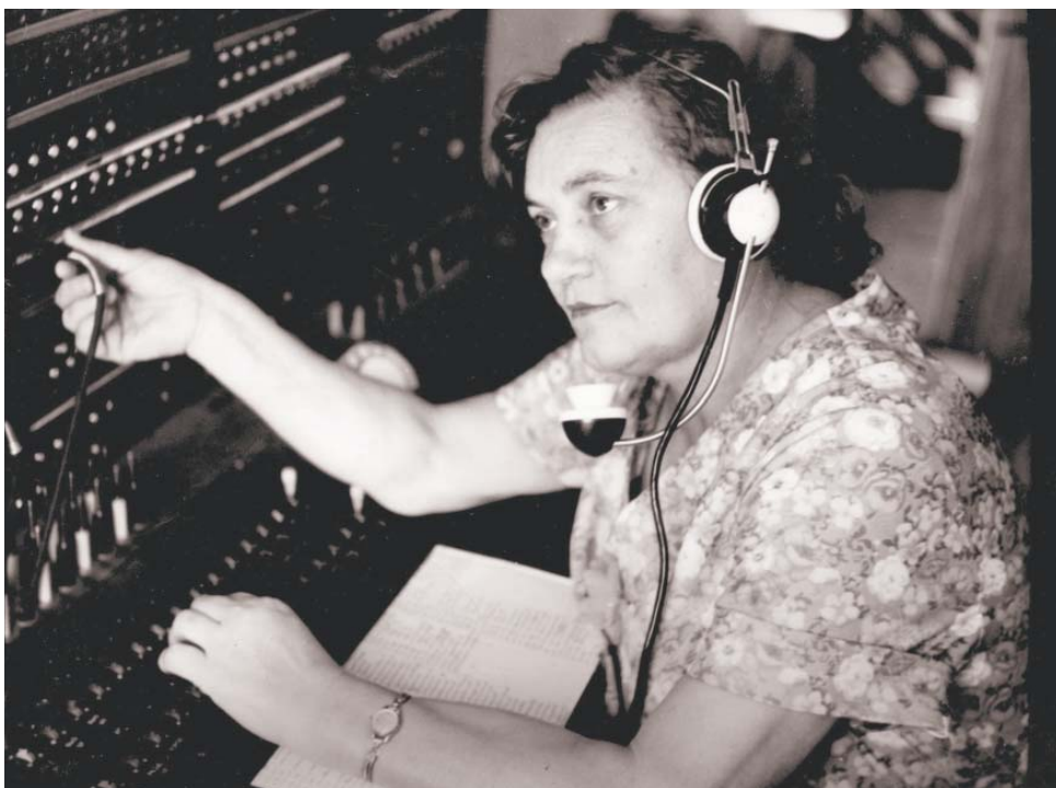
На коммутаторе узла связи. 1980-е гг.