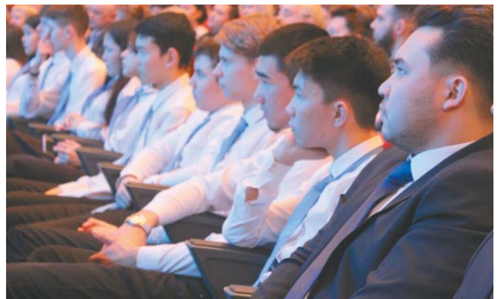
Среди гостей мероприятия – учащиеся «Газпром-класса»