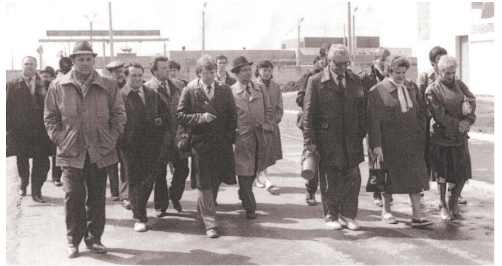
Одна из первых экскурсий на АГКМ. 1989 год

1 марта отмечено в истории службы по связям с общественностью и СМИ при Администрации ООО «Газпром добыча Астрахань» как дата её основания. Сегодня службе исполняется 30 лет. Не лишним будет отметить, что на нашем предприятии формирование ССОиСМИ длилось на протяжении почти шести лет. И тому были серьёзные предпосылки.