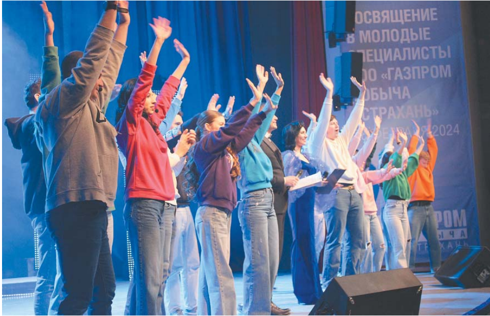
Приветствие от молодёжного актива ООО «Газпром добыча Астрахань»

Мероприятие ещё не началось, а атмосфера зала уже была наполнена значимостью предстоящего события: главные виновники торжества заняли почётные места в первом ряду и со всей серьёзностью устремили взоры на сцену. Точно в назначенное время занавес открылся, и представители молодёжного актива ООО «Газпром добыча Астрахань» поприветствовали тех, кто вот-вот вступит в их ряды, ярким концертным номером «Много ли нас».