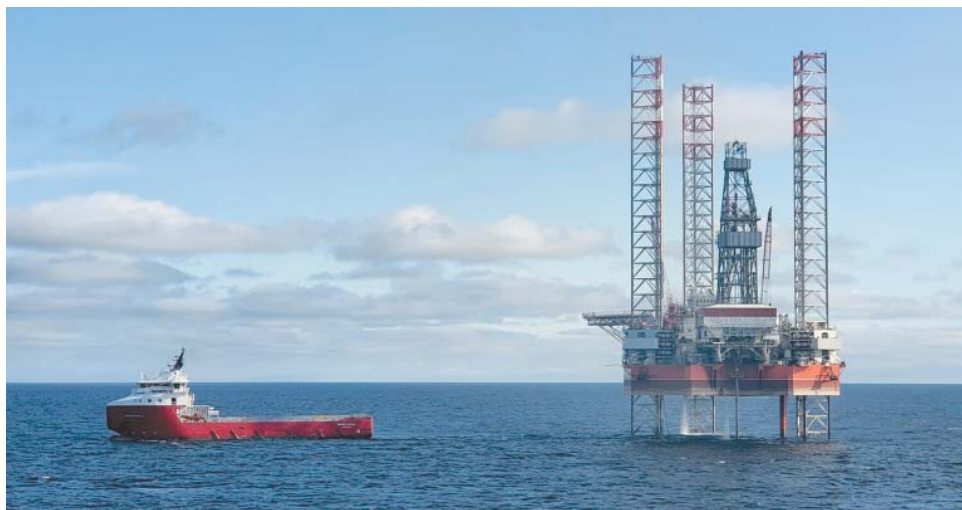
Самоподъёмная плавучая буровая установка «Арктическая» в акватории Карского моря

В 2023 году благодаря геологоразведке компания, как и прежде, достигла одного из ключевых стратегических целевых показателей по газовому бизнесу – обеспечила прирост запасов газа над объёмами добычи. Таким образом, коэффициент выполнения запасов уже 19 лет подряд превышает единицу.