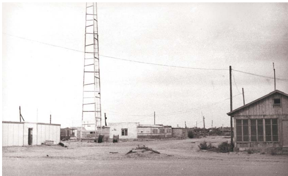
Узел связи ПО Астраханьгазпром. 1982 год

1 марта исполняется 40 лет Управлению связи ООО «Газпром добыча Астрахань», которое обеспечивает работников Общества самыми разнообразными видами коммуникаций.