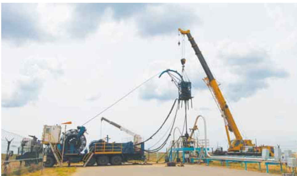
Ремонт скважин с использованием установки гибких насосно-компрессорных труб