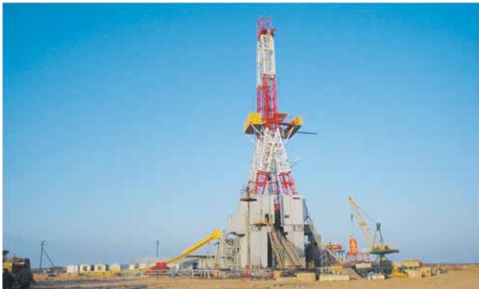
Стационарная буровая установка UNOC

По программе эксплуатационного бурения на Астраханском ГКМ было успешно завершено строительство скважины с условно-горизонтальным окончанием ствола в продуктивном горизонте, с забоем длиной от 4340 до 4641 метра. Данное техническое решение привело к повышению добычных возможностей сква-