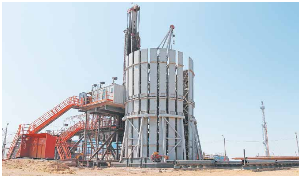
Мобильная буровая установка «Drillmek»