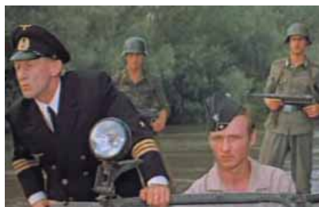
Кадр из фильма «Тройной прыжок «Пантеры».

вать после войны, карточную систему в декабре 1947 года отменили, однако было голодно. Несмотря на это, наша семья постоянно увеличивалась: в послевоен-