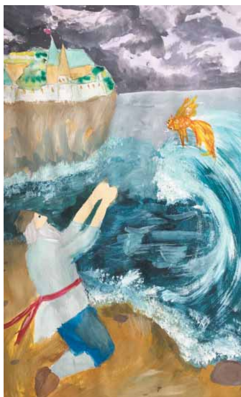
«Золотая рыбка» Вероника Радаева, 9 лет