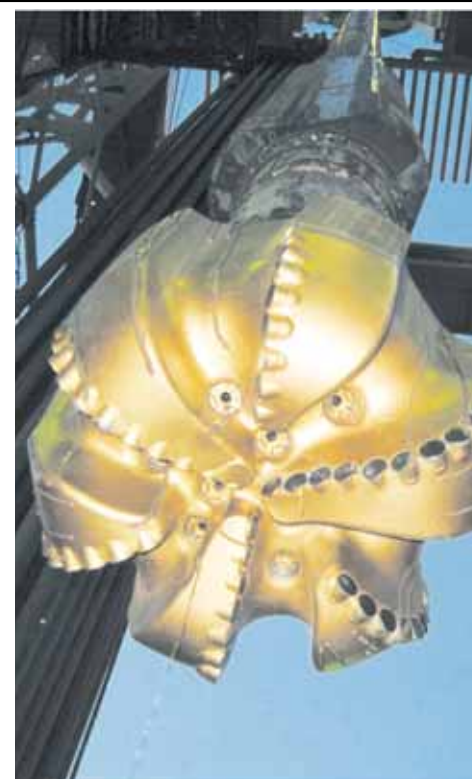
Буровое алмазное PDC долото

Современный контроль строительства, ремонта и ликвидации скважин проводится в режиме реального времени с помощью системы удалённого мониторинга с автоматизированных рабочих мест, информация на которые поступает со станций геолого-тех-