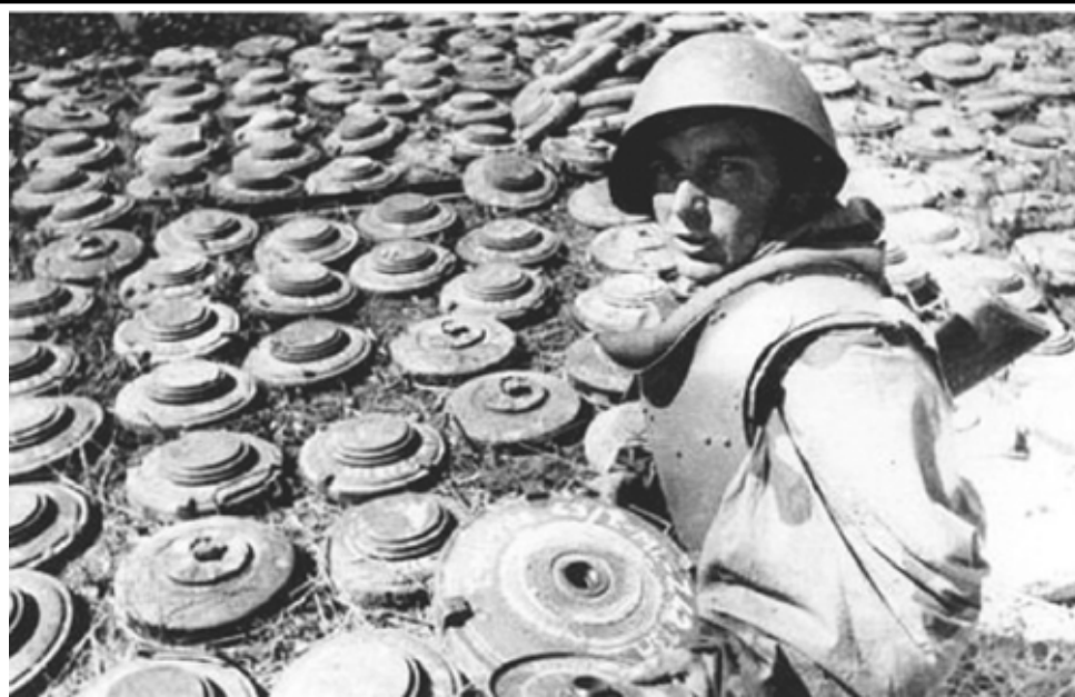
В бой солдаты инженерно-сапёрных батальонов шли в стальных нагрудниках, за это их иногда называли панцирной пехотой