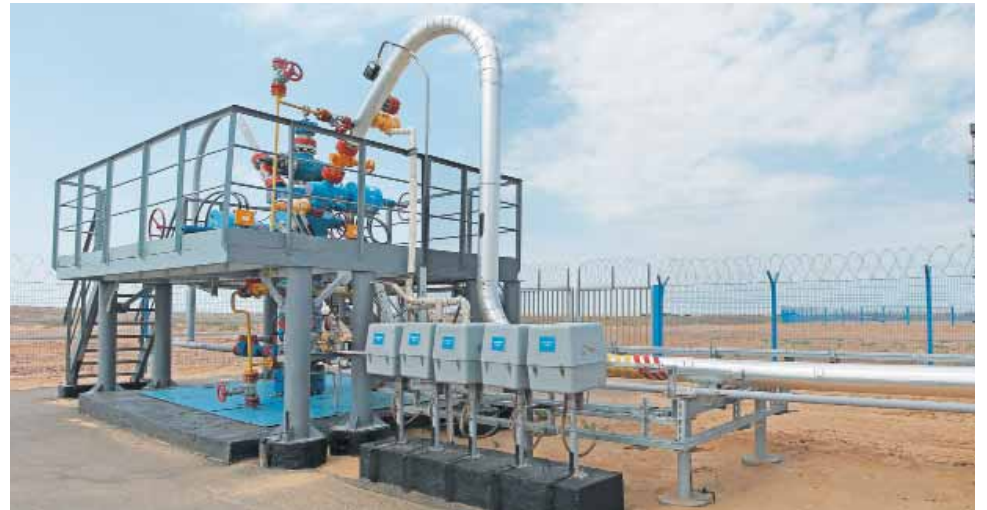
Эксплуатационная скважина на АГКМ

– В 2014–2016 годах Общество «Газпром добыча Астрахань» сделало существ-