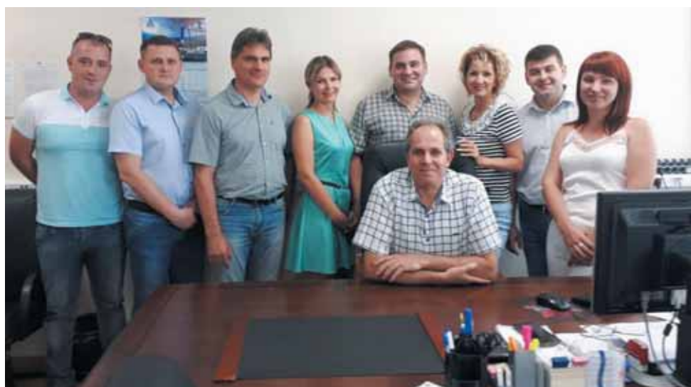
Коллектив службы технологии строительства, ремонта, консервации и ликвидации скважин, 2019 год