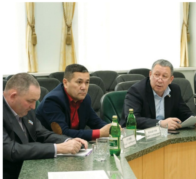
На заседании Совета МО «Красноярский район»