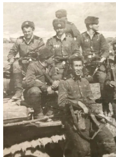
Во время срочной службы в вооруженных силах