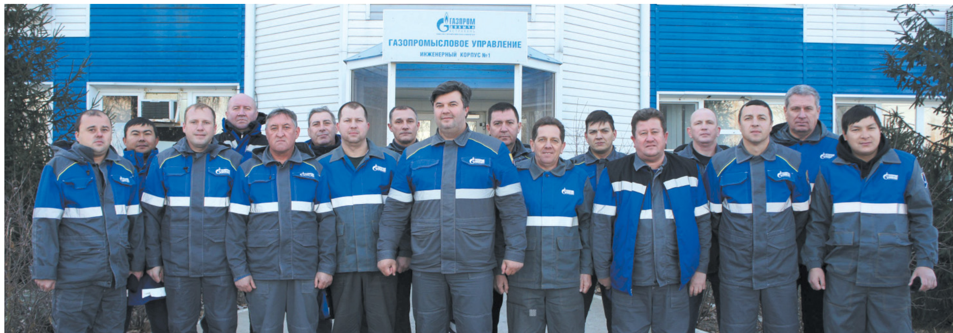
Коллектив ЦРПО, 2020 год