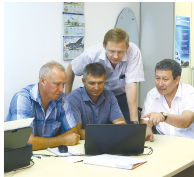
С коллегами из Управления корпоративной защиты