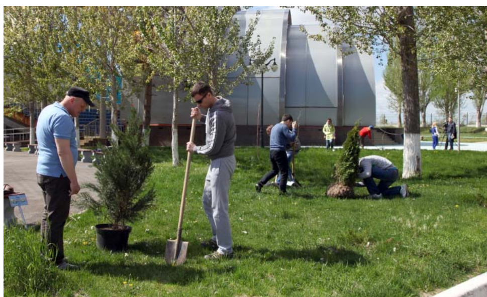
Коллектив УС посадил семейные деревья на территории ОЦ имени А.С. Пушкина