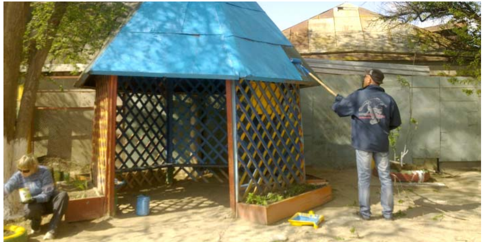
УТТиСТ: беседка станет как новая!