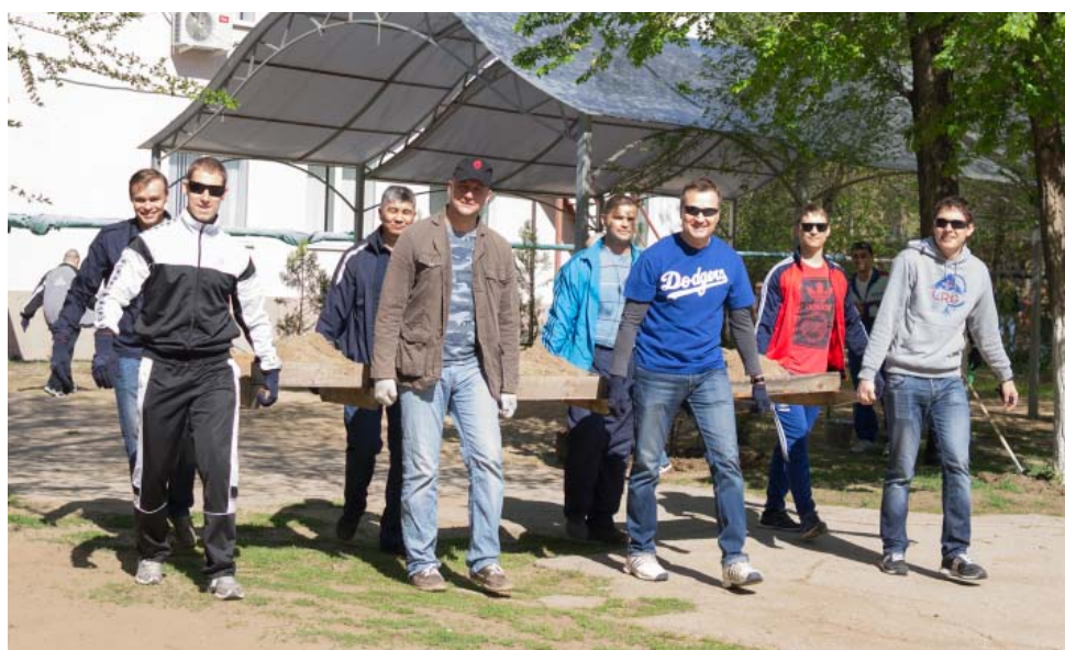
Коллектив УКЗ приводил в порядок территорию Реабилитационного центра для детей