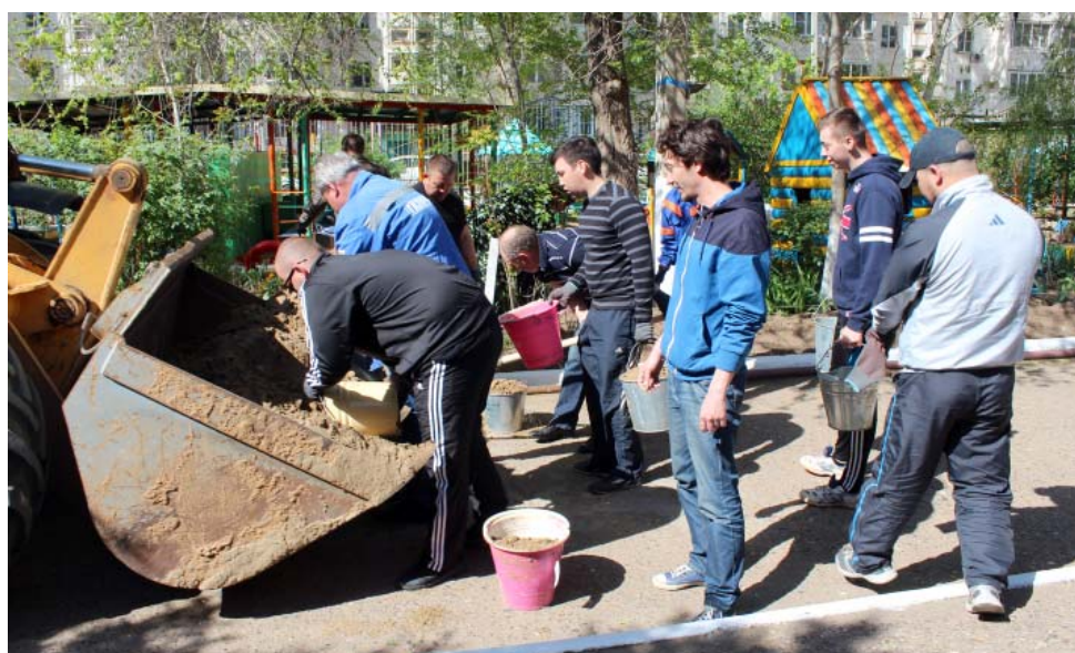
Промысловики очистили от мусора более 42 тыс. кв. м в подшефных учреждениях