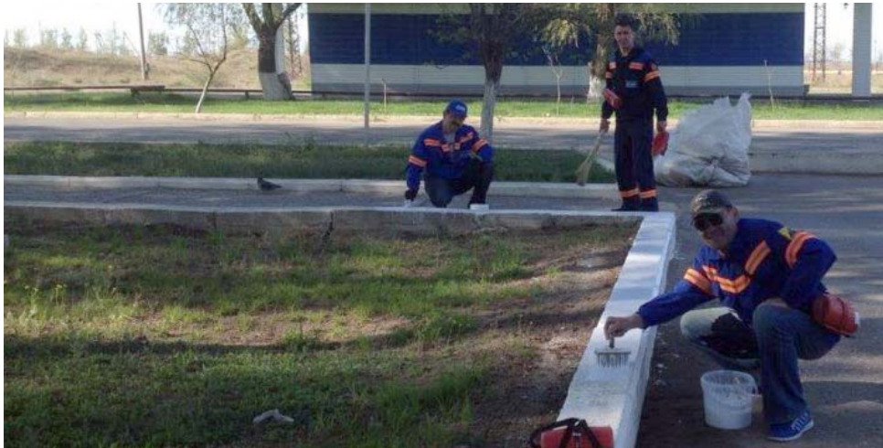
ВЧ: в Аксарайске должно быть красиво!