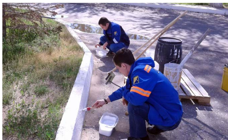
В общей сложности коллектив УМТиК покрасил около 600 погонных метров бордюров