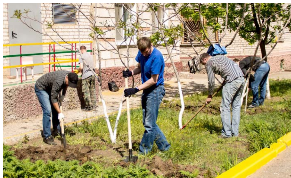
Заводчане окопали и побелили более 200 деревьев