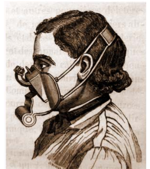
Респиратор, 1874 г.

В последнее время заменителями наушников выступают беруши. Название этого нехитрого предмета состоит из двух слов «берегите уши». Но история у них презабавная. Можно смело утверждать, что изобретателем берушей является Одиссей. Именно он предложил своим спутникам заклеить уши воском, чтобы не слышать губительного пения Сирен. Рецепт берушей сохранялся вплоть до начала XX века практически без изменений: в основе был всё тот же пчелиный воск с добавлением в конструкцию хлопчатобумажной ткани, пропитанной вазелином. В 1962 году супруги Рэй и Сесилия Беннер разработали первые в мире силиконовые беруши. В 1972 году Росс Гарднер создал беруши из пены. Затем на смену пене пришли поливинилхлорид и полиуретан.