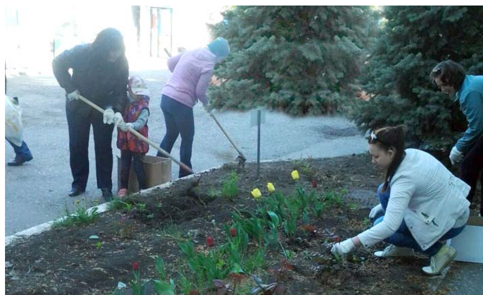
Сотрудники ИТЦ благоустроили территорию около здания Центра