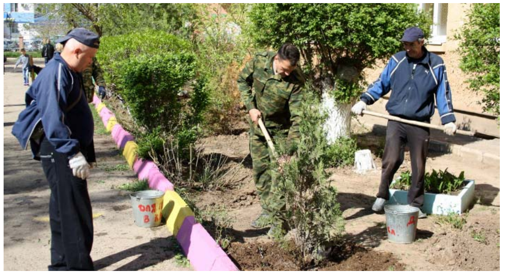
Коллектив ОБПО – для воспитанников школы-интерната № 2 г. Астрахани