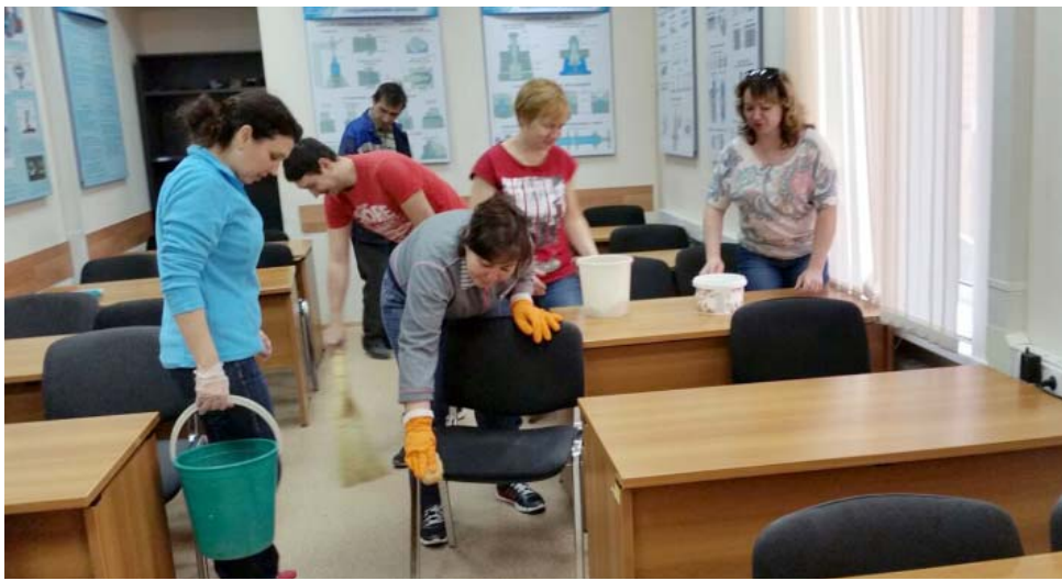
УПЦ: уборка в учебных аудиториях