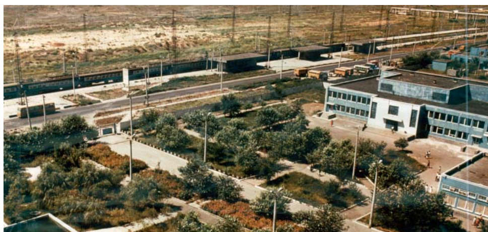
Аксарайск, 1993 г.