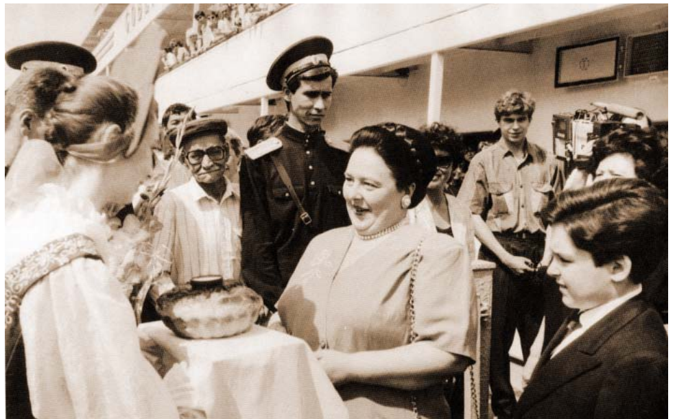
Визит в Астрахань представителей Августейшего Дома Романовых в 1993 году