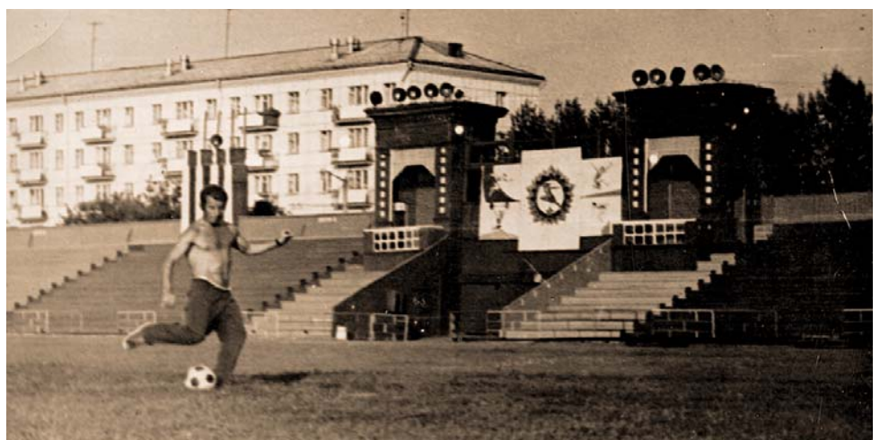
Тренировка на Центральном стадионе, середина 60-х