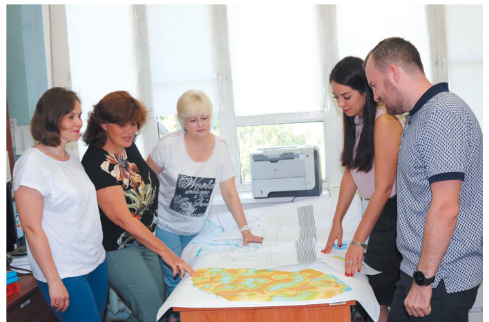
Отдел геолого-геофизического обеспечения