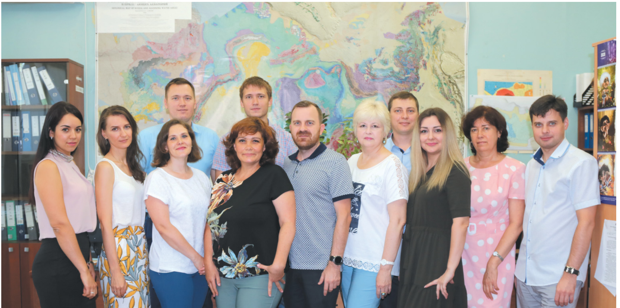
Коллектив службы разработки месторождений и геолого-промысловых работ ИТЦ

что-то все-таки пойдет не так, как планировалось, – продолжает начальник службы разработки месторождений и геолого-промысловых работ ИТЦ. – Анализируем, оцениваем, готовим предложения для коллег из других структурных подразделений Общества. Наша работа неотделима от деятельности администрации и ГПУ. Большим плюсом геологического братства является то, что каждый сотрудник может и должен иметь свое мнение в той или иной ситуации, и высказывать его своим коллегам. По этой причине мы постоянно контактируем и совместно решаем задачи с главным геологом Общества и главным геологом ГПУ.