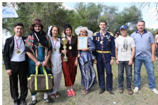
1 место в общем зачёте – АГПЗ