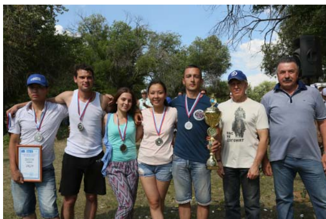
2 место в общем зачёте – УТТиСТ