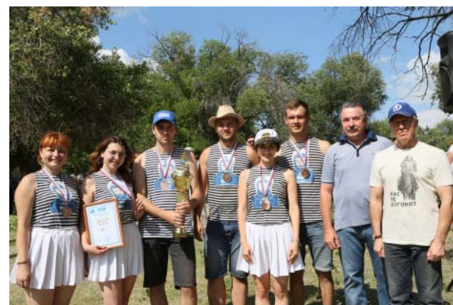
3 место в общем зачёте – ВЧ