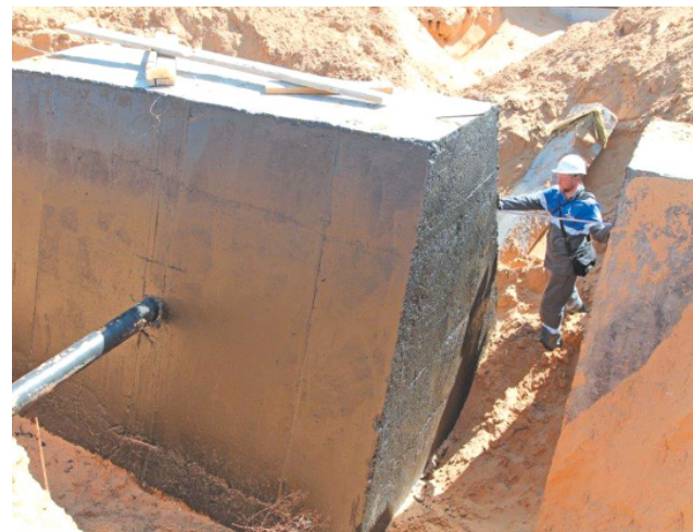
Проведение измерений геометрических размеров фундамента