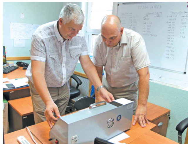
Контроль сварных соединений радиографическим методом

– Что включает в себя контроль подрядчика?