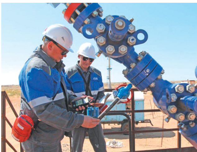
Толщинометрия стенок труб

Все это характеризует работу нашей службы, специалисты которой успешно справляются с поставленными производственными задачами и принимают активное участие в спортивной и культурной жизни Инженерно-технического центра Общества «Газпром добыча Астрахань».