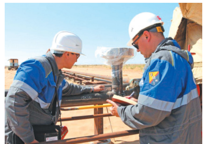
Проведение визуально-измерительного контроля сварочных соединений