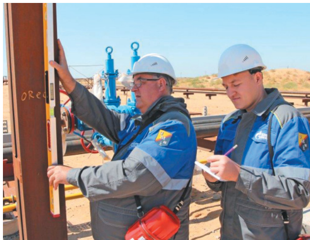
Проверка вертикальности опоры трубопровода