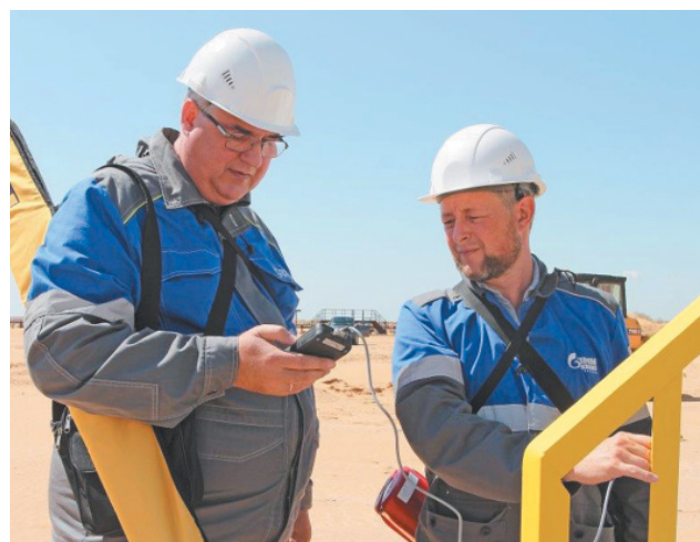
Измерение толщины лакокрасочного покрытия