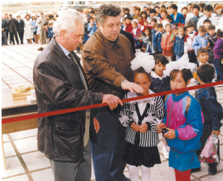
Торжественное открытие школы в с. Распутловке. 1996 год

При подготовке публикации использована информация из книги В.Щугорева «Записки генерального директора», «Полиграфмастер», Москва, 2005 год.