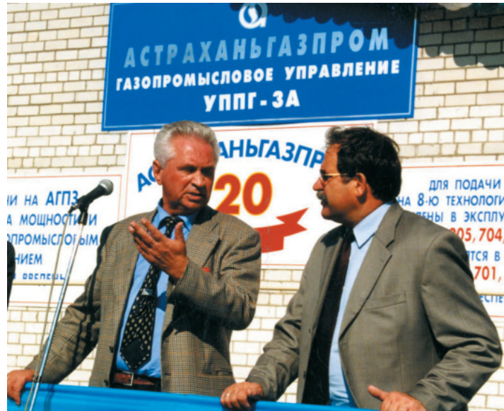
Митинг по случаю сдачи в эксплуатацию УППГ-3А. 2000 год