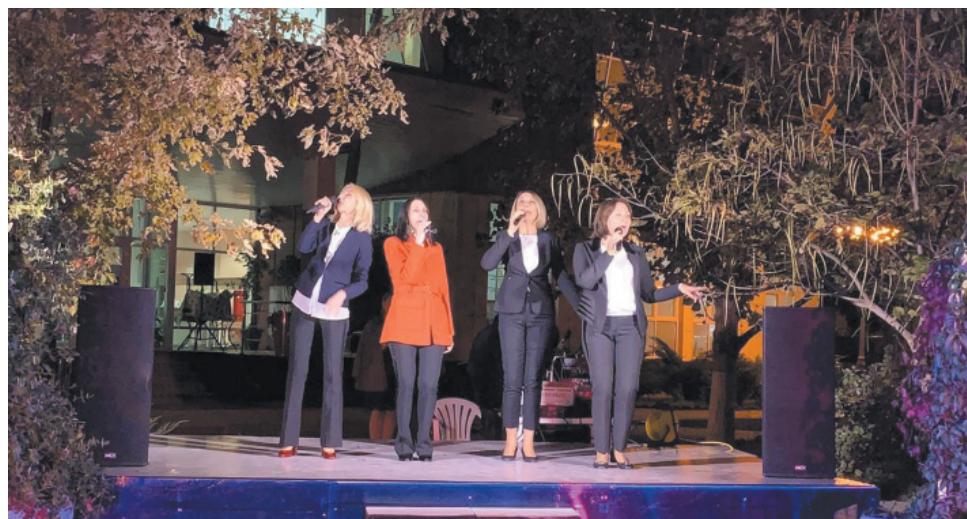
День пожилого человека в ДОО имени А.С. Пушкина

После введения ограничительных мер работники Культурно-спортивного центра поменяли форму интерактивного театра «Дом сказок». Были организованы видеозаписи сказок в исполнении работников центра: «Дивный гудочек», «Чудо-гармошка», «Медвежонок и солнышко», «Птицы и люди», «Принцесса и свинопас», «Подарки от красавицы», «Подарки феи», «Как кот всех зверей напугал», «Зухра – Йолдыз». Но и на этом создатели «Дома сказок» решили не останавливаться. Был задействован макет, в котором проходили съёмки мультипликационных сказок «Колосок» и «Как делили сыр», где в роли артистов «выступили» куклы, сделанные руками детей студии прикладного творчества «Мозаика».