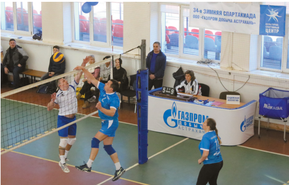
34-я Зимняя спартакиада ООО «Газпром добыча Астрахань»