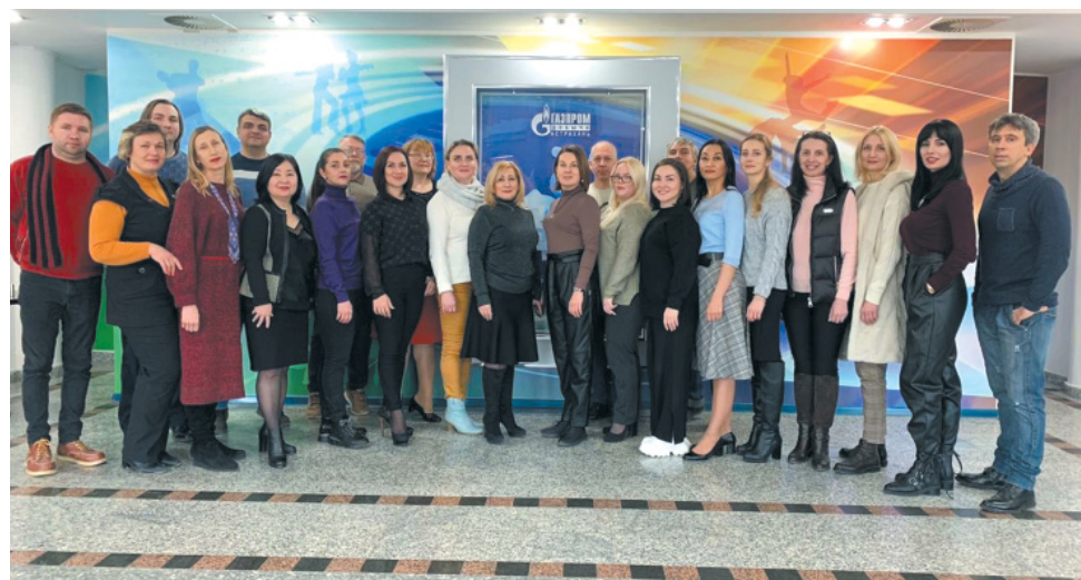
Коллектив Культурно-спортивного центра ООО «Газпром добыча Астрахань»

В общей сложности, в 2020 году нормативы ВФСК «ГТО» сдали 182 работника Общества и воспитанника Культурно-спортивного центра, из которых 135 человек прошли все испытания на «золотой» знак, 28 – на «серебряный», и 19 – на «бронзовый».