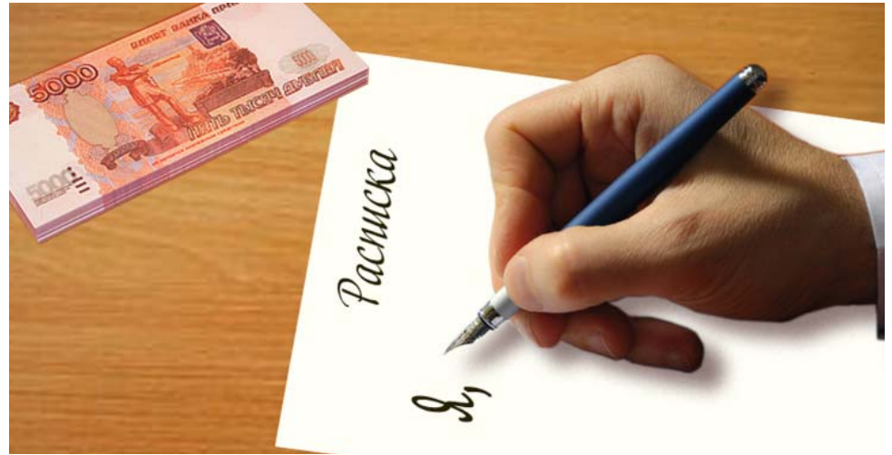
Если расписка находится на руках того, кто дал займы денег, то это означает, что должник их ещё не вернул

Таким образом, делает вывод из всего вышесказанного Верховный суд, для квалификации отношений между гражданами