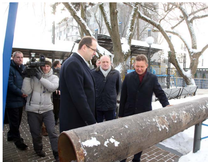
Фрагмент трубы первого отечественного магистрального газопровода «Саратов – Москва»

Внимание посетителей музея представлены интерактивные макеты газотранспортных объектов – компрессорной, газораспределительной и газоизмерительной станций. Гости также могут совершить виртуальное путешествие по газовой трубе от эксплуатационной скважины до потребителя с помощью специальной анимационной модели или ощутить реальные габариты трубопровода диаметром 1420 мм, пройдя сквозь его модель в натуральную величину. На мультимедийных терминалах любой желающий может, например, пройти тестирование и определить список наиболее подходящих для него профессий газовой отрасли или попробовать себя в роли диспетчера линейно-производственного управления.