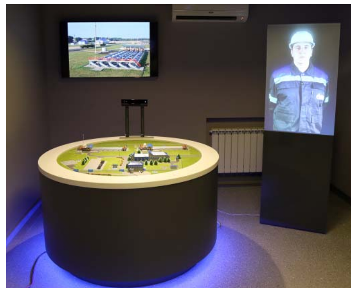
Интерактивный макет «Газоизмерительная станция «Суджа»

– Сегодня мы открываем первый в мире Музей магистрального транспорта газа. Это современный, прекрасно оснащённый, высокотехнологичный промышленный музей. Он даёт возможность прикоснуться к истории создания и современному развитию уникальной газотранспортной системы нашей страны. Убеждён, новый музей будет интересен многим – специалистам и ветеранам отрасли, студентам профильных вузов и школьникам, а также всем любознательным людям, неравнодушным к прошлому и настоящему нашей страны, – сказал Алексей Миллер.