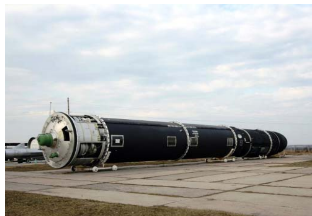
МБР «Сармат» – перспективный стратегический ракетный комплекс 5-го поколения. Штатная загрузка одной ракеты позволяет уничтожить территорию размером с Техас. Не имеет аналогов в мире.