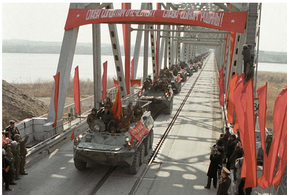
Последняя колонна советских войск покидает Афганистан. 15 февраля 1989 г.

– Пожалуй, гордости. Все раны – и физические, и моральные – уже зажили. А чувство, что был тогда настоящим воином, до конца выдержал испытание «горячей точкой», греет душу до сих пор. И когда мой сын с гордостью говорит окружающим: «А мой папа – десантник, он в Афгане был!», понимаю – те одиннадцать боевых месяцев прожил совсем не зря.