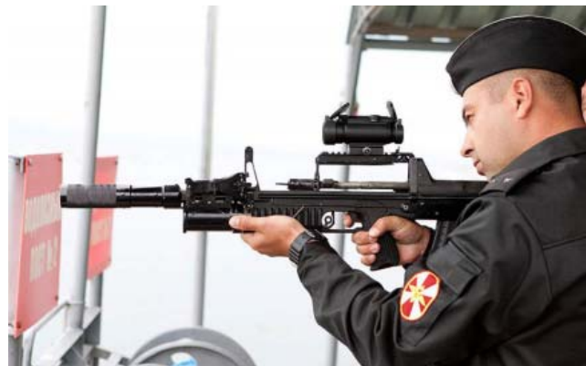
Автомат АДС – уникальное стрелковое оружие, которое способно эффективно стрелять как на суше, так и под водой. Серийный выпуск начат в 2016 году.