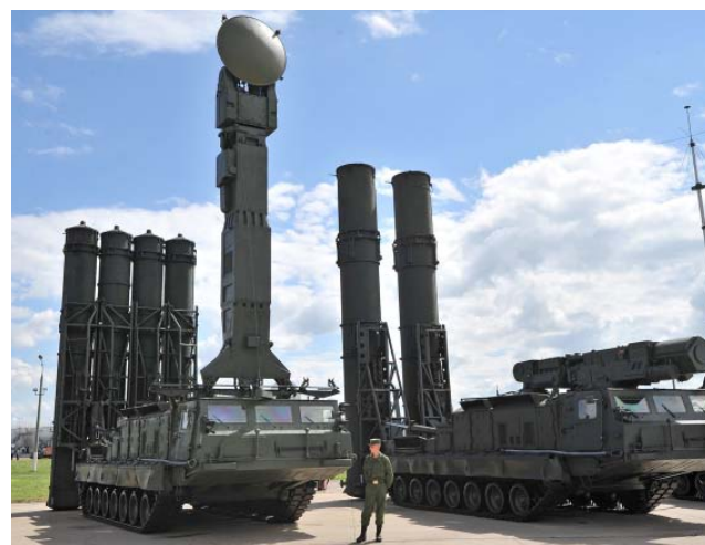
С-500 «Прометей» – зенитно-ракетный комплекс класса «земля-воздух», предназначенный для перехвата баллистических ракет средней дальности и поражения целей в радиусе до 600 км. Окончание разработки намечено на 2017 год.