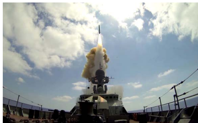
ПКР «Циркон» – гиперзвуковая противокорабельная ракета, на высоте 100 км летящая со скоростью 7 км/сек и в полёте выполняющая сложные маневры, чем осложняет работу ПРО. Серийный выпуск намечен на 2018 год.