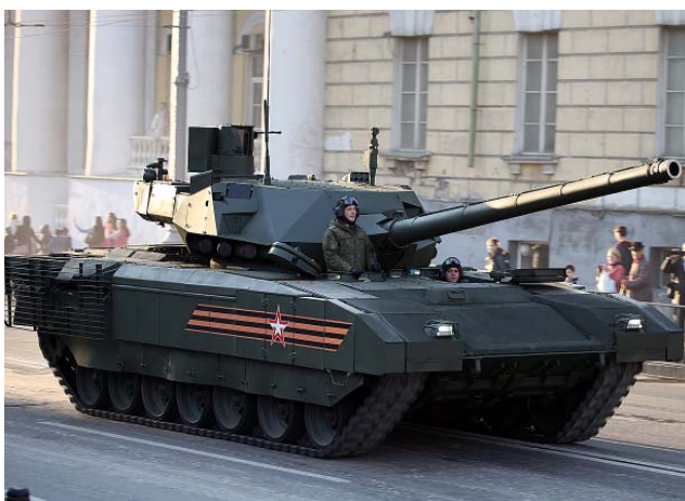
Т-14 «Армата» – первый в мире танк, способный выполнять целый ряд боевых функций: разведку, корректировку огня, сопровождение, силовое давление. Зарубежная пресса называет его переворотом в танковой отрасли. Серийное производство начато в 2016 году.