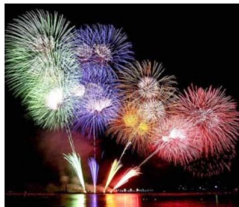
Астрахань попала в список восьми городов Южного и Северо-Кавказского федеральных округов, где 23 февраля в честь Дня защитника Отечества состоится праздничный салют

В самый эпицентр праздника Театр оперы и балета покажет сценическую версию известной опер-аиг постановки «Князь Игорь». Особенно символично показать 23 февраля героическую постановку о подлинных исторических событиях XII века, воссозданных под музыку А. Бородина. Перенеся спектакль из живых декораций Астраханского кремля на сцену, создатели максимально расширили действие с помощью эффектного видеоконтента. В зрелищном классическом спектакле уча-