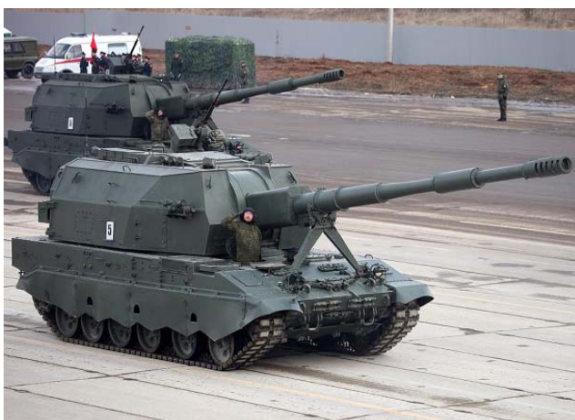
2С35 «Коалиция-СВ» – 152-мм самоходная гаубица, предназначенная для уничтожения тактических ядерных средств, артиллерии и бронетехники. Превосходит аналогичные зарубежные системы в 1,5–2 раза. Впервые официально была показана в 2015 году.