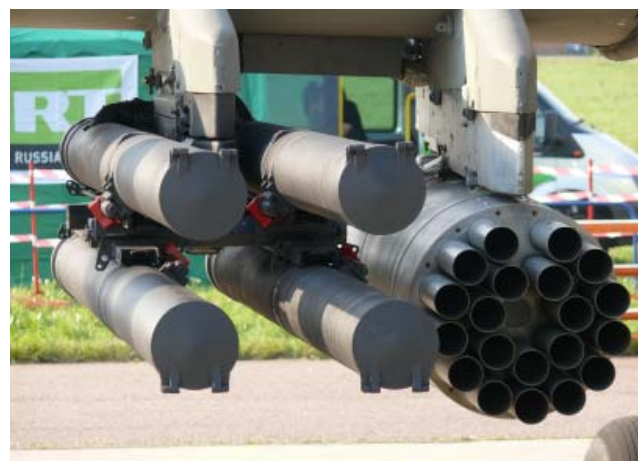
Комплекс «Гермес» – многоцелевой ракетный комплекс управляемого вооружения, способный поражать цель до 100 км. Имеет варианты для использования на кораблях, вертолётах и танках. Официально представлен в 2009 году.