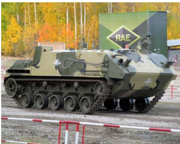
БТР-МД «Ракушка» – десантируемый бронетранспортёр, способный двигаться со скоростью 70 км/ч. По манёвренности и запасу хода по шоссе (500 км) превосходит все аналоги. К 2016 году выпущено 12 единиц.