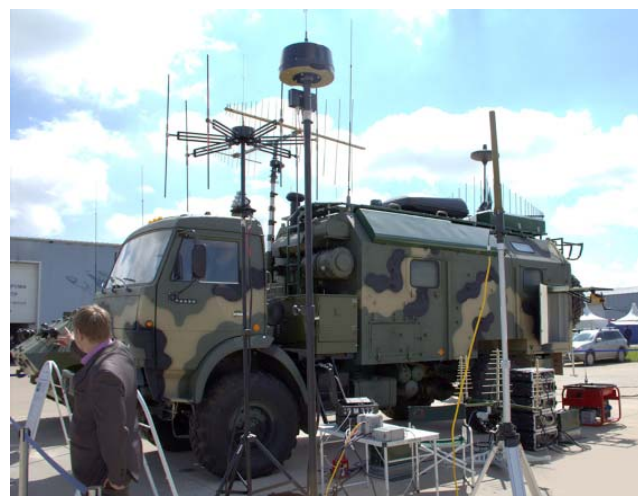
РЭБ «Шировник-АЭРО» – комплекс для радиоэлектронной борьбы, способный в радиусе 10 км заглушить все передающие устройства и за секунду перехватить управление вражеским беспилотником. Показан широкой публике в 2015 году.