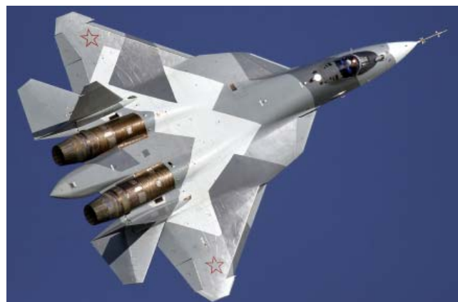
Т-50 (ПАК ФА) – многофункциональный истребитель фронтовой авиации. Истребитель 5-го поколения, серийное производство которого началось в 2016 году.