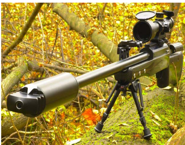
Снайперская винтовка СВЛК-14С – сверхточное оружие, способное эффективно поражать цели на дистанции в 1,5–2 км.