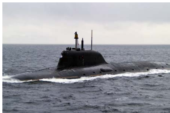
АПЛ «Северодвинск» – многоцелевая атомная подлодка 4-го поколения. Сравнивается сразу с двумя линейками американских субмарин – многоцелевыми («Virginia», «Seawolf») и стратегическими («Ohio»). В составе Северного флота с 2015 года. К 2020 году планируется построить 7 лодок данной серии.

Армию характеризуют не только выучка и боевое мастерство личного состава, но и то, чем она вооружена. И в этом плане Россия может быть спокойна – её щит представляют уникальные образцы вооружения, многие из которых вызывают зависть и уважение многих армий мира.