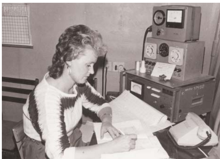
Фиксация наблюдений за окружающей средой в лаборатории охраны окружающей среды

Вот как писала газета «Волга» об атмосферном мониторинге, некоторые элементы которого появились на строящихся объектах газового комплекса уже в 1982 году: «Постоянные наблюдения за атмос-