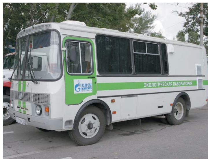
Передвижная экологическая лаборатория

В 1987 году, когда были введены в эксплуатацию промысел и завод, действо-