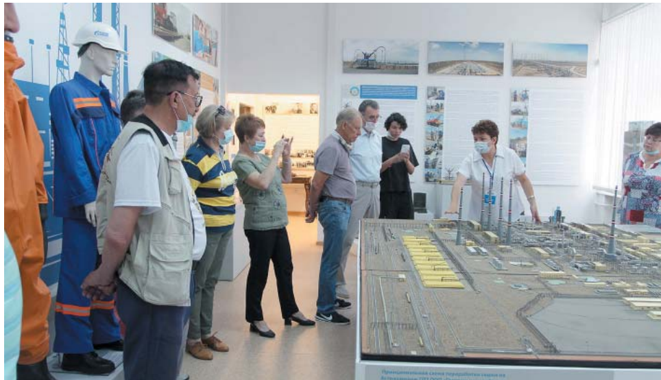
Комиссия Общественной палаты Астраханской области начала работу с посещения корпоративного музея

Диспетчерская оснащена системой отображения информации, которая состоит из двух подсистем: отображения технологической информации и видеомониторинга. Подсистема отображения технологической информации позволяет визуализировать все технологические параметры комплекса, необходимые для контроля и анализа (по добыче, по установкам предварительной подготовки газа, работе скважин, количеству добываемого газа и т.д.). Экологическая обстановка отслеживается датчиками контроля загазованности по сероводороду. Видеомониторинг ведётся в режиме реального времени с видеокamer, расположенных так, что позволяет контролировать работу персонала, экологиче-