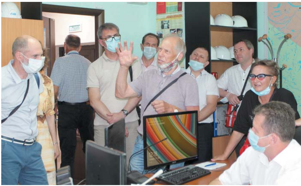
Члены Общественной палаты Астраханской области посетили производственные объекты ООО «Газпром добыча Астрахань» и задали специалистам Общества несколько десятков вопросов